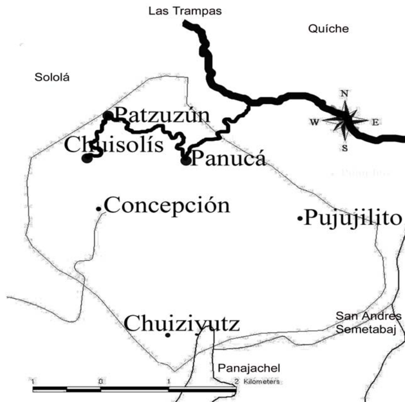
Mapa 1 Municipio de Concepción, Departamento de Sololá Poblados Año: 2006