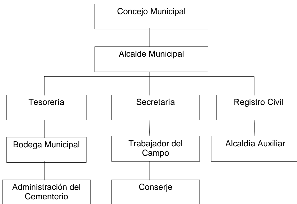
Gráfica 1 Municipio de San Miguel Sigüilá – Departamento de Quetzaltenango División administrativa Organigrama municipal Año: 2005