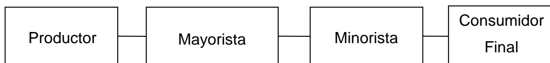
Gráfica 1 Municipio de San Diego, departamento de Zacapa Proyecto: Producción de Aguacate Hass Canal de Comercialización Propuesto Año: 2006