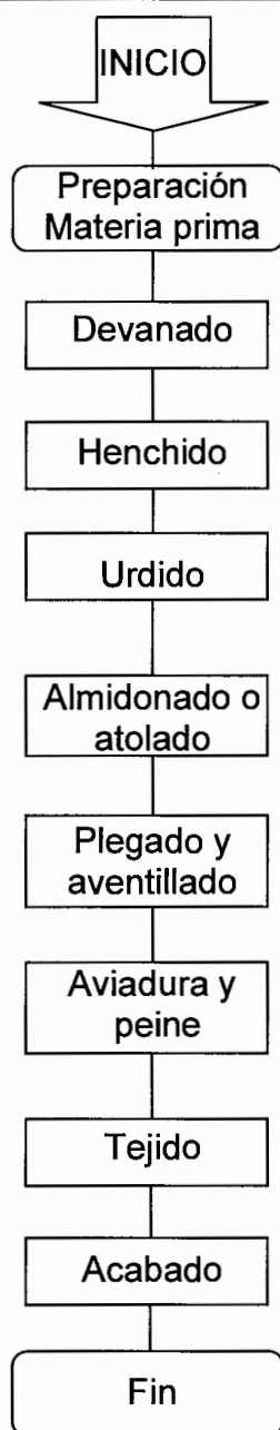
Gráfica 2 San Antonio Sacatepéquez - San Marcos Flujograma del proceso de elaboración de tejidos típicos Año: 2009