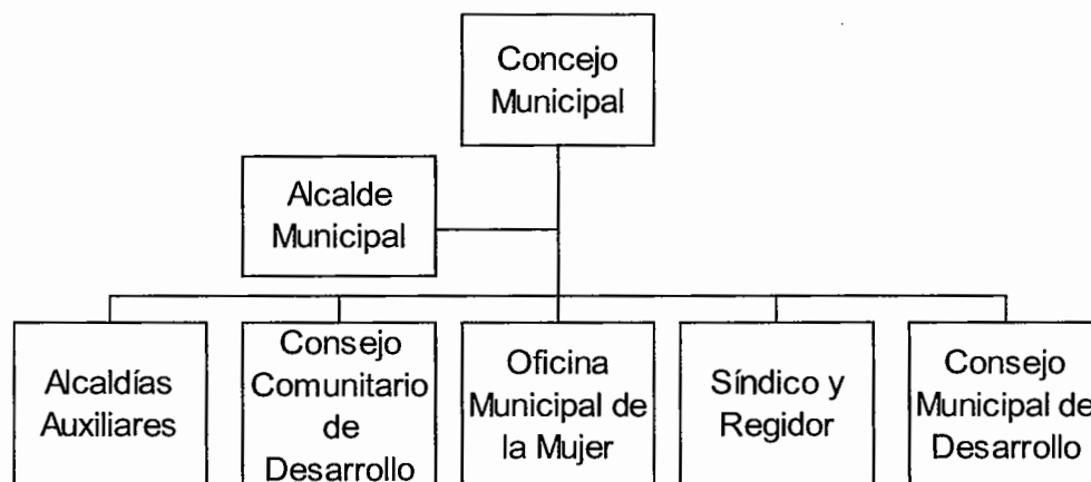
Gráfica 1 Municipio de Santiago Chimaltenango, Departamento de Huehuetenango Organigrama de la estructura municipal Año 2013