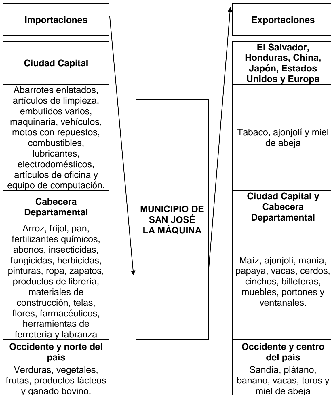
Gráfica 2 Municipio de San José La Máquina, departamento de Suchitepéquez Flujo Comercial Año: 2015