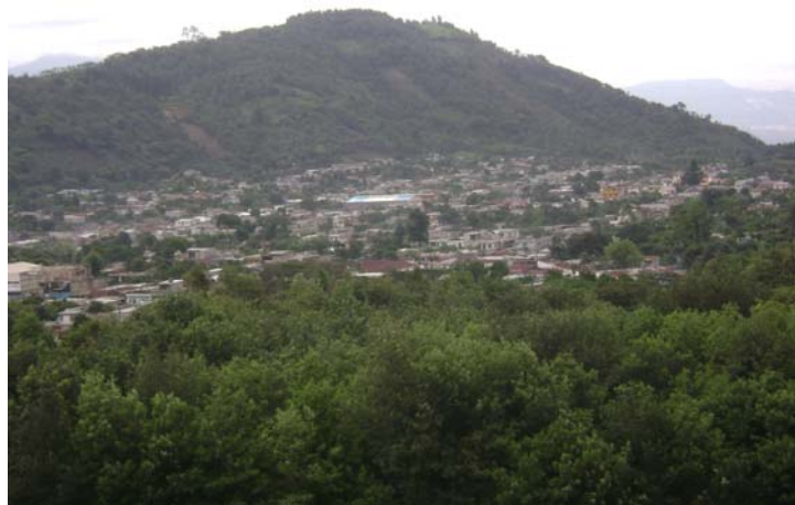
Casco Urbano del Municipio de San Vicente Pacaya

la aldea la Pacallita sobre que dicha reducción se erija en pueblo estableciéndose la Municipalidad que corresponde. Resultando del expediente instruido con tal fin, que aquella aldea, con las rancherías anexas tiene el número de vecinos que la ley designa para formar pueblos y poder establecer la respectiva Municipalidad.