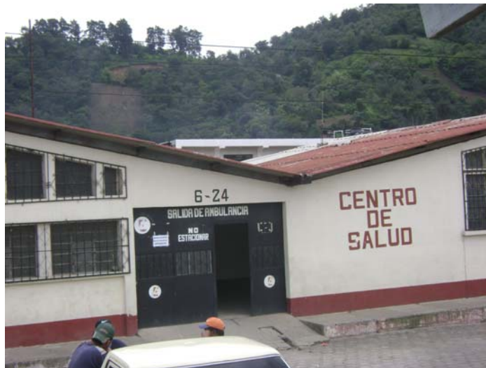
Centro de Salud

En cuanto a los servicios de salud se puede decir que en el municipio de San Vicente existe un Centro de Salud.