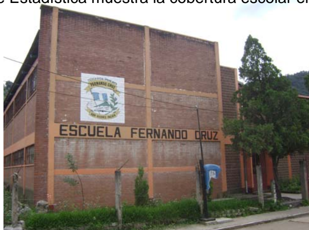
Escuela Fernando Cruz

Uno de los aspectos importantes de los municipios de San Vicente Pacaya es el sector educativo, para el año de 1994 en el censo del municipio elaborado por el Instituto Nacional de Estadística muestra la cobertura escolar en el municipio.