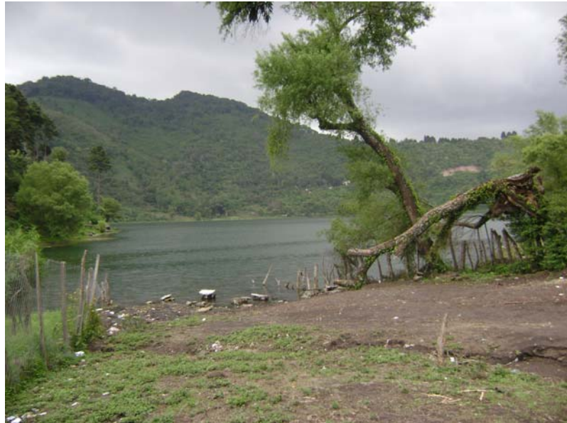
Laguna de Calderas