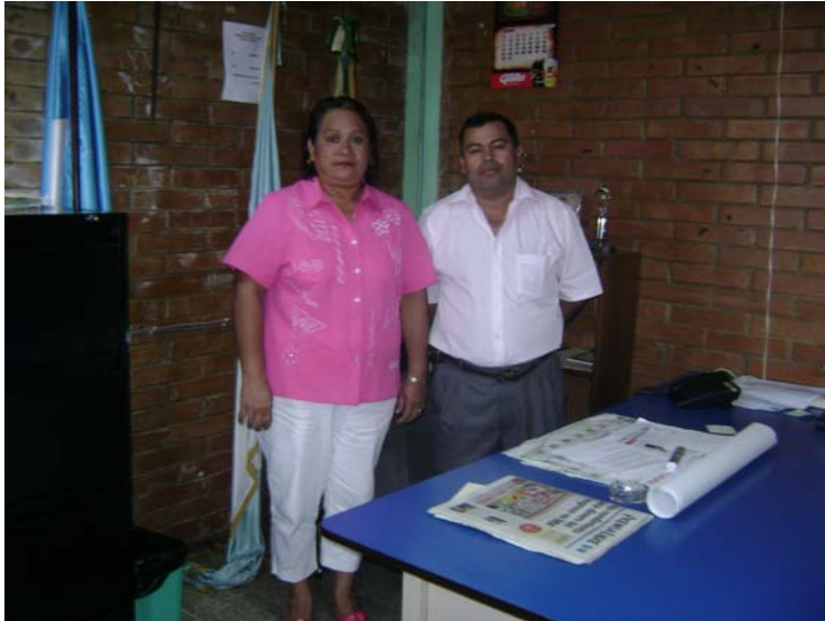
Epesista con el Señor Vicealcalde