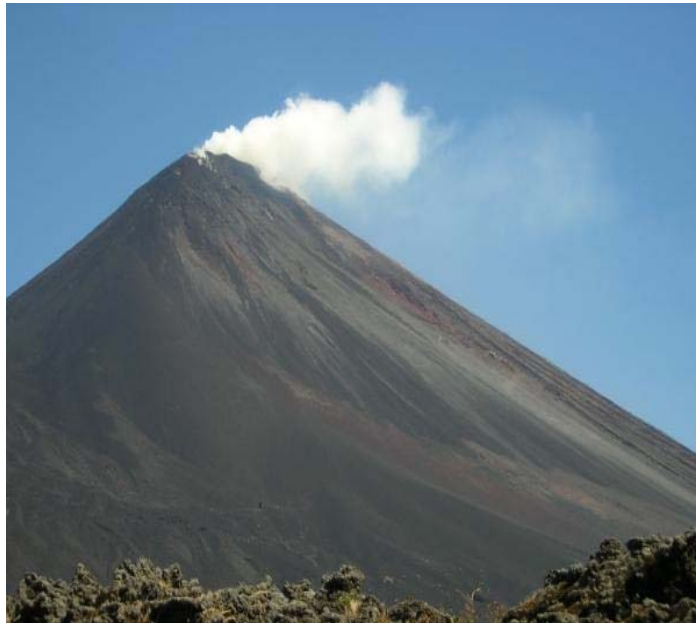
Volcán de Pacaya