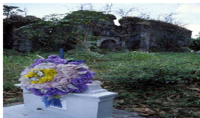
Figure 6. Ruined Colonial Church of San Juan Parícuto