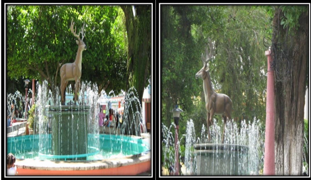
Es la fuente del Venado que se encuentra en la parte sur-oeste del parque central