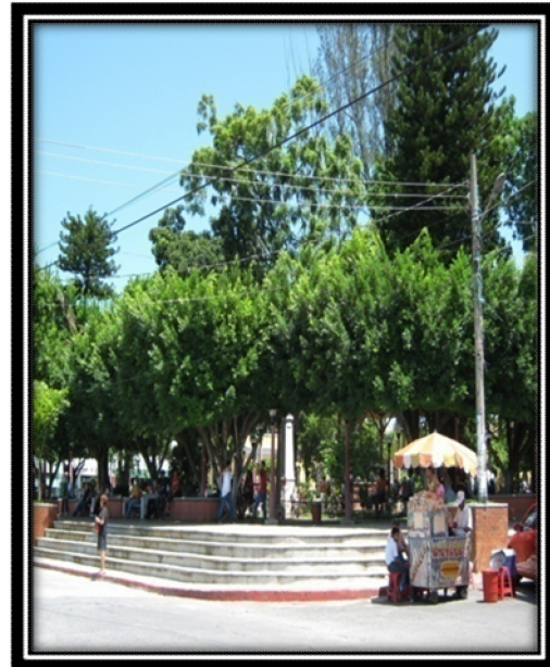
Aquí podemos apreciar el quisco y la entra sur-este del parque central donde se celebraron antiguamente los carnavales. Todo se encuentra remodelado recientemente por la actual Corporación Municipal.