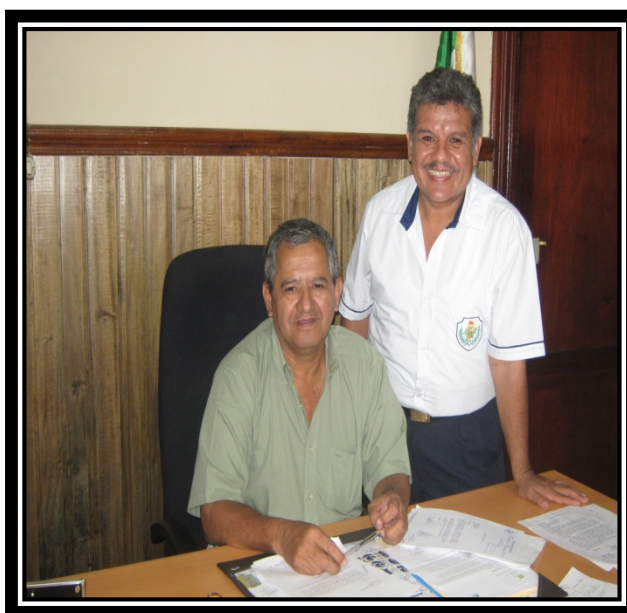
En el despacho municipal del Señor Alcalde y Epesista de la Universidad de San Carlos de Guatemala.