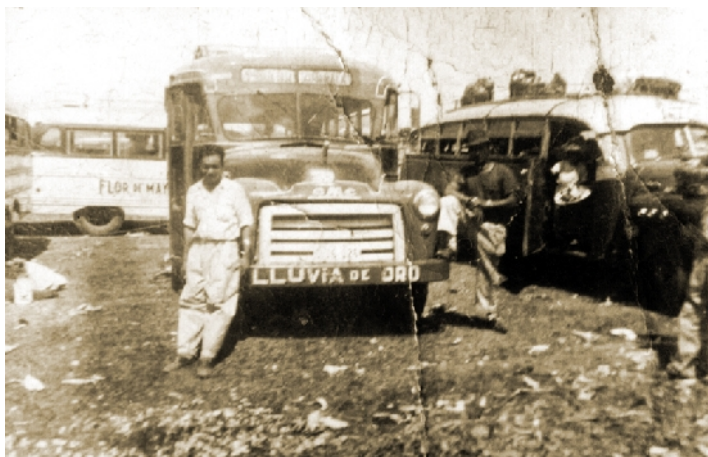
Medios de transporte