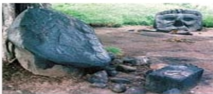
Altar y cabeza del Dios Mundo, en finca Santa Lucía Cotzumalguapa.

Además se encuentra el altar de sacrificio en el interior del edificio y el símbolo Luciano El Jaguar que está al lado derecho de la