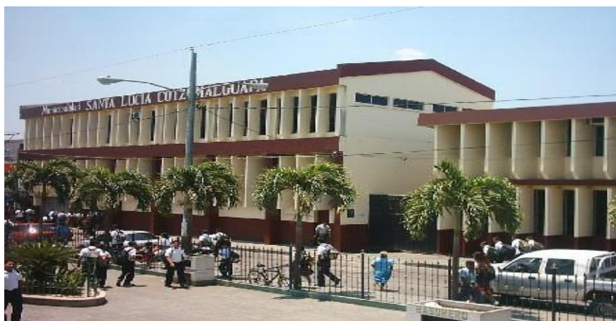
Municipalidad de Santa Lucía Cotzumalguapa