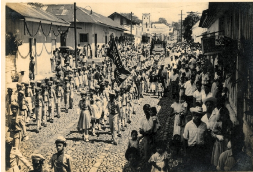
Desfile del 15 de Septiembre