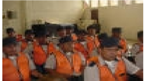
Policía Municipal de Tránsito