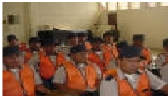
Policía Municipal de Tránsito