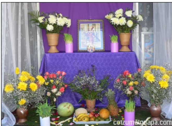
Altar elaborado por los Lucianos cuando JESUS NAZARENO sale en las procesiones.

Dentro de sus ornamentas cabe mencionar que posee tres túnicas, bordadas en hilo de oro y por su importancia se transmitió en la televisión en el programa "Ocurrió así" que se transmite en la cadena Telemundo en Estados Unidos de Norte América, el cual es visto en 28 países del mundo.