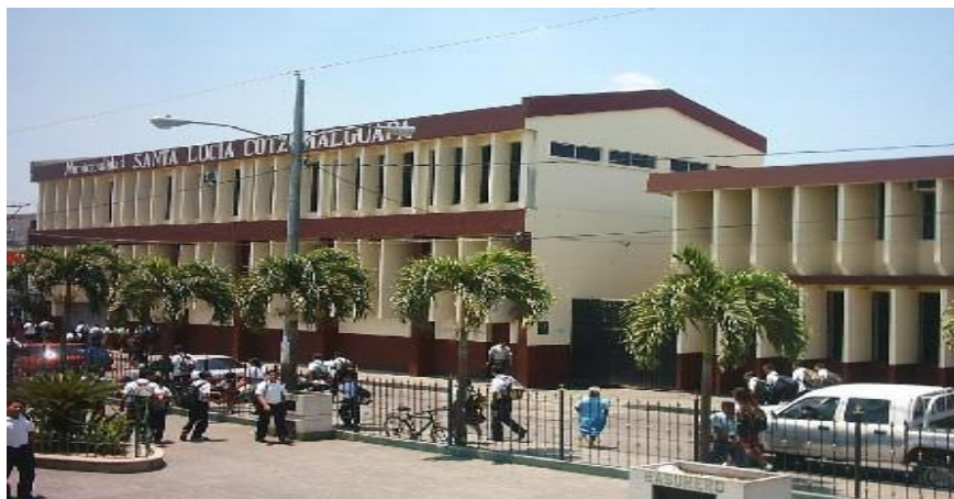
Municipalidad de Santa Lucía Cotzumalguapa