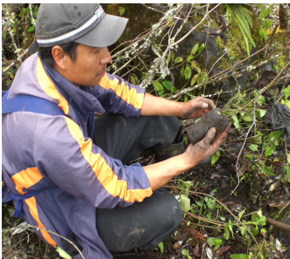
PONIENDO EN PRACTICA LA REFORESTACION