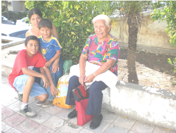
Abuela con hija y nietos en el parque de Mixco