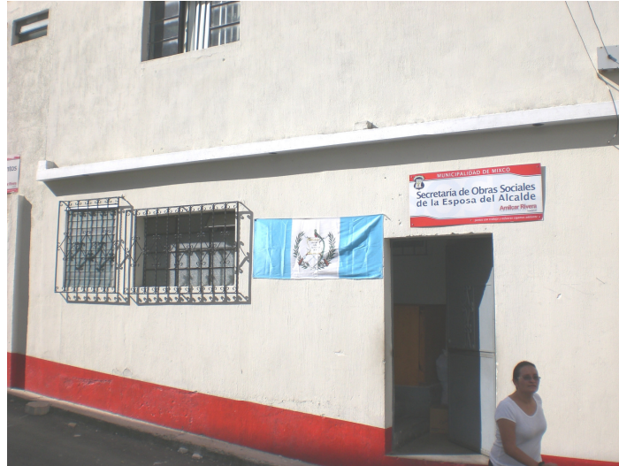
Mujeres sirviendo a su comunidad