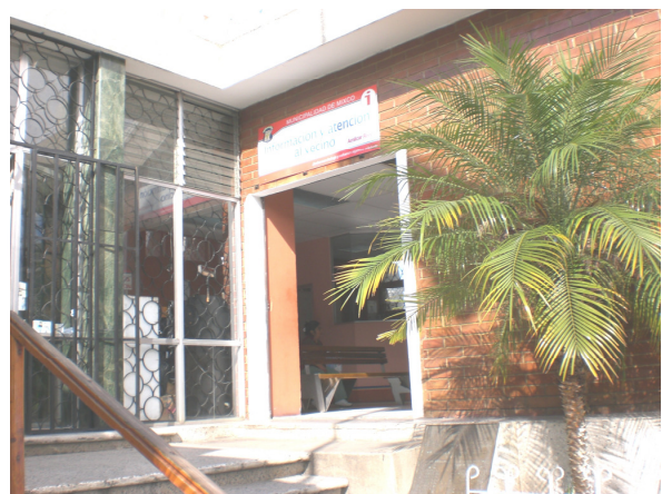
Edificio de la municipalidad de Mixco (atención al vecino)