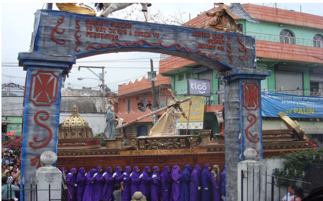
Ilustración No. 25 Procesión del Jueves Santo al momento de pasar bajo un arco, elaborado en la entrada principal de la Iglesia Parroquial. (Fotografía, Marvin Emiliano Rodríguez año 2008).

En Palín la zona que mas ha difundido esta tradición es la zona 3 (Barrio San Antonio), sin dejar de mencionar el barrio San Lucas que colocaba su tradicional arco en la entrada del Calvario, de la misma manera el Barrio San José (actual zona 4) elaboraba sus arcos.