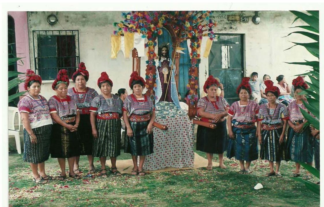
Ilustración No. 5 Capitanas con su indumentaria ceremonial en la Cofradía de Corpus Christi (Fotografía, Alberto Reyes año 2008).

El “Taj w’al” que es usado para cubrir la base de los estandartes (son los adornos o escudos de los santos que están bajo su cuidado). 20