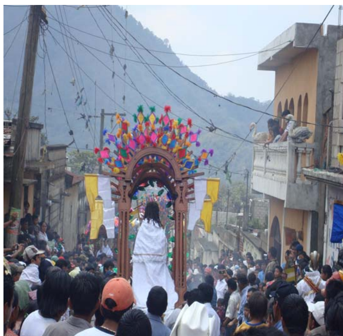
Ilustración No. 34 y 35 (izquierda) Momento en que se da la despedida de la Virgen de Candelaria con la imagen de San Pedro. (Derecha) imagen de Cristo Resucitado en la cortesía despidiendo a la imagen de San Antonio. (Fotografía, Marvin Emiliano Rodríguez año 2009).