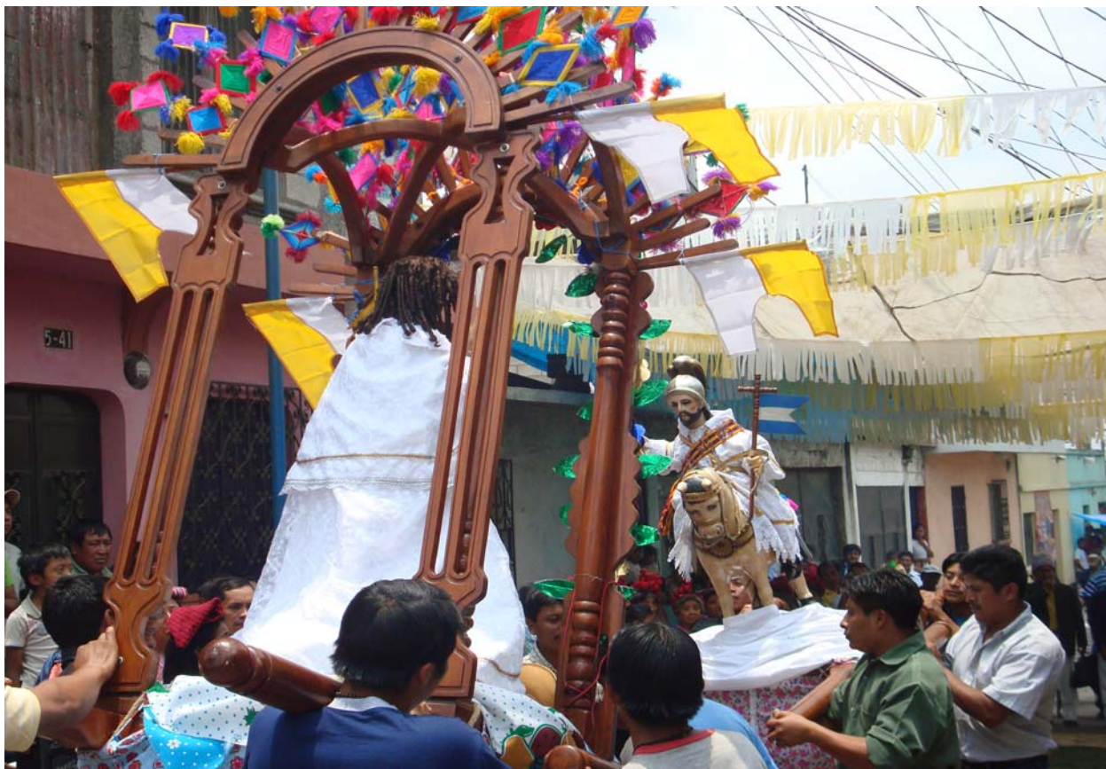
Ilustración No. 36 Imagen de Cristo Resucitado al momento de su despedida por la imagen de Santiago Apóstol. (Fotografía, Marvin Emiliano Rodríguez año 2009).

A las diez de la mañana saldrá nuevamente la procesión en donde se despedirán todas la imágenes hasta concluir en la Cofradía de Corpus Christi que será la principal, acompañando a la imagen de Cristo Resucitado se encontrará la imagen de Santiago que por ser la principal tiene como compromiso acompañar a la del Corpus Christi hasta que esta llega a su hogar, para luego retornar al suyo.