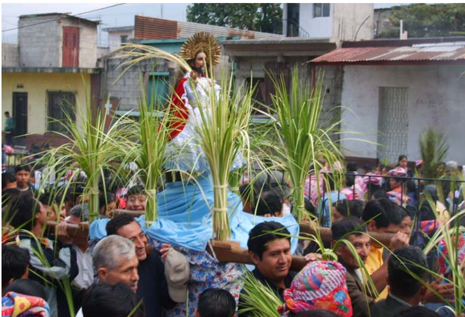
Ilustración No. 12 Procesión de domingo de Ramos dirigiéndose al templo parroquial, acompañada de la comunidad portando palmas.

Otra característica importante, es la representación en vivo por un grupo de niños de la entrada triunfal de Jesús a Jerusalén, haciendo también una procesión por las principales calles del municipio.