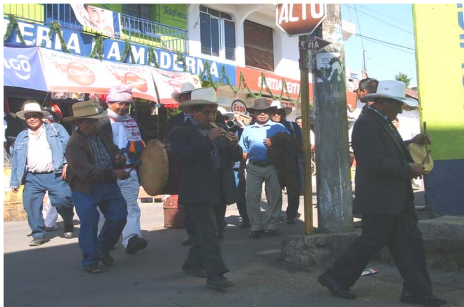
Ilustración No. 6 Miembros del Comité religioso indígena acompañados de cofrades, y el tambor, dirigiéndose la Cofradía de Corpus Christi