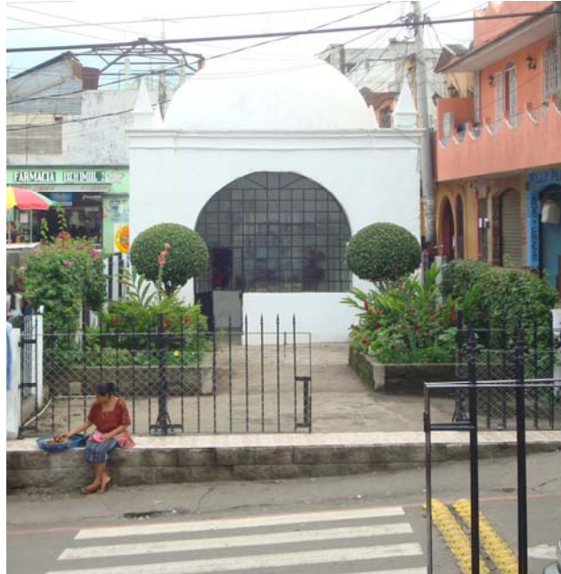
Ilustración No. 3 Ermita de Santa Ana o Capilla Posa (año 2009)