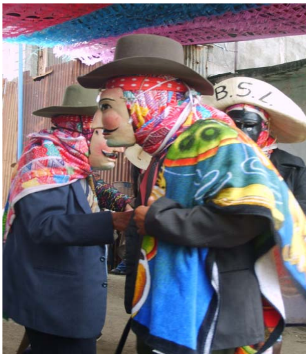
Ilustración No. 19 y 20 (Izquierda) Caporales acompañando al criado, derecha caporales y mayordomos danzando, Fieros del Barrio San Lucas también conocidos como Partideños.