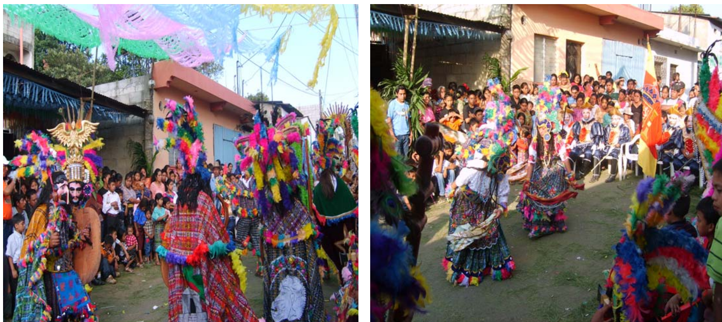
Ilustración No. 22 y 23 (izquierda) Personajes de la conquista danzando, representan al ejército Quiché. (Derecha) Princesas danzando, al fondo el ejército español.

El baile representa la batalla librada entre los españoles y el ejército de los Quiches comandados por Tecún Uman, en los campos de Urbina en Febrero de 1524 22 , la danza termina con la muerte de Tecun Uman, para luego darse la evangelización del pueblo Quiche a la nueva religión traída por los españoles. Esta danza es de carácter evangelizador. Originalmente era representada en honor de la Virgen del Patrocinio, pero que hoy también se representa en Navidad, para conmemorar el nacimiento del Niño Dios