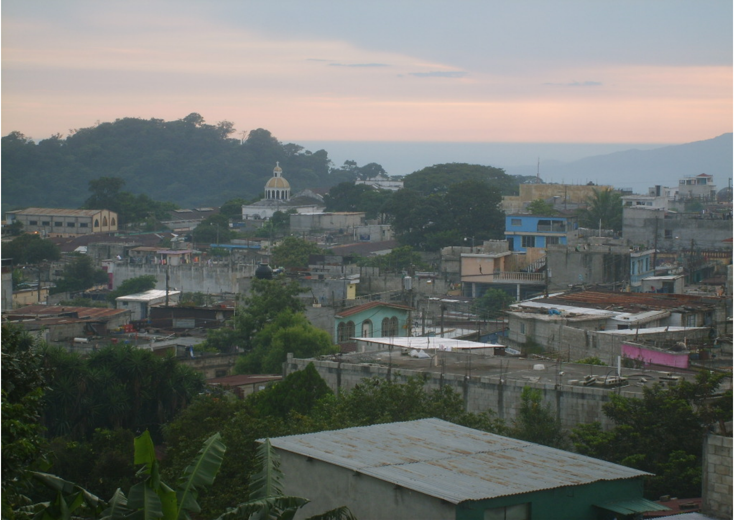
Panorámica del municipio de Palín, departamento de Escuintla.