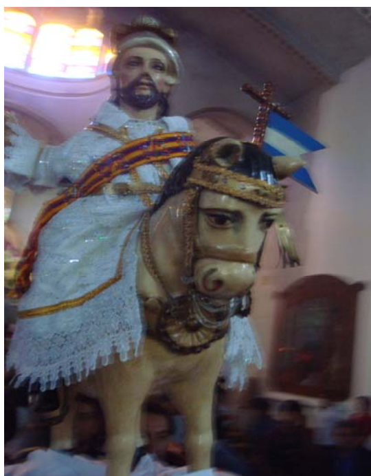
Ilustración No. 7 Imagen de Santiago Apóstol, patrimonio cultural muypreciado del pueblo pocoman, saliendo del templo parroquial.

Dentro de las principales costumbres y tradiciones del municipio de Palín se encuentran: