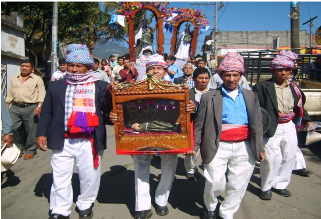
Ilustración No. 17 Cofradía del Niño Dios en su procesión del 25 de Diciembre. (Fotografía, Marvin Emiliano Rodríguez año 2007)