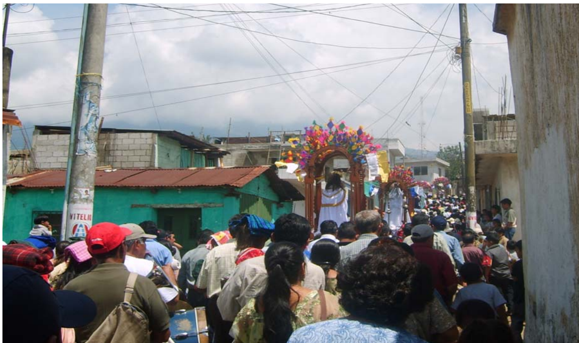
Ilustración No. 32 Multitud acompañando a la procesión de Resurrección, el día domingo por la mañana. (Fotografía, Marvin Emiliano Rodríguez año 2007).

El día Sábado Santo por la tarde, aun se escucha resonar las marchas fúnebres acompañando a la procesión de la Virgen de la Soledad, ya en el templo parroquial se inician los preparativos para la celebración del día grande.