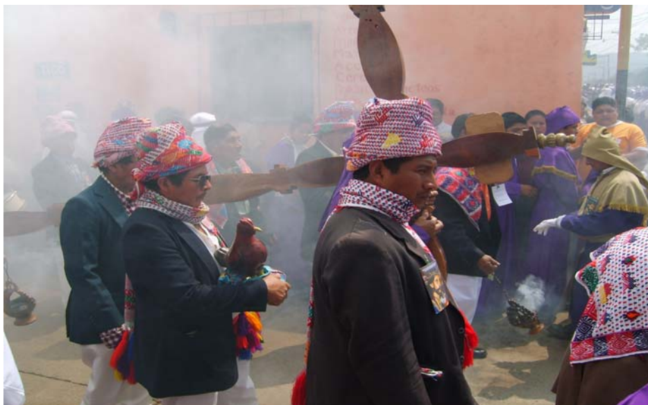
Ilustración No. 27 Cofrades acompañando a la cruz de pasión, junto con ellos, el gallo y los clavos presidiendo la procesión del Nazareno, en su recorrido del jueves Santo. (Fotografía, Marvin Emiliano Rodríguez año 2008).