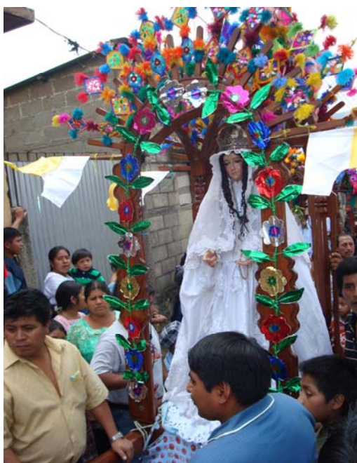
Ilustración No.11 Imagen de la Virgen de Candelaria, en procesión del domingo de resurrección.

A las 10 de la mañana sale en procesión la imagen de la Virgen de Candelaria para luego retornar a su cofradía al filo del medio día. Por la tarde la celebración del día de Candelaria no termina, a las 4:30 la comunidad se reúne en el calvario y allí se da también la bendición de candelas, haciendo una pequeña procesión la comunidad se dirige hacia el templo parroquial en donde se celebra una misa para concluir esta festividad importante.