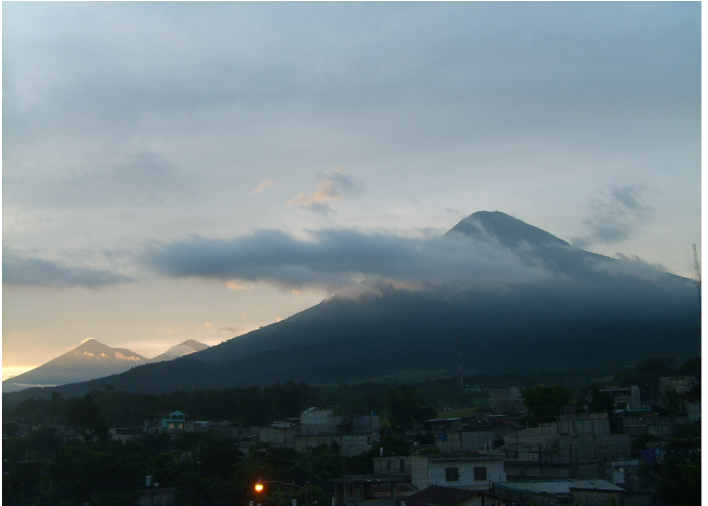
Majestuosidad de la cadena Volcánica que rodea al municipio de Palín, en el departamento de Escuintla (Volcán de Agua, de Fuego y Acatenango).