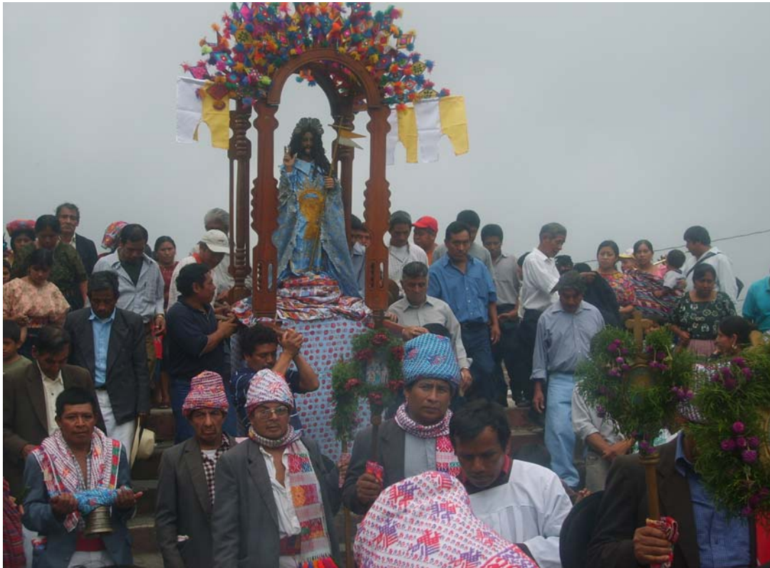
Ilustración No.9 Corpus Christi dirigiéndose a su cofradía