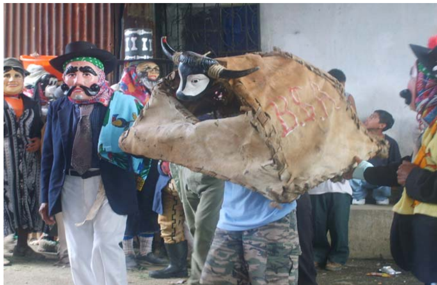
Ilustración No. 18 Fieros del Barrio San Antonio terminando la danza acompañados del toro..

Desde entonces la danza de los fieros, la campana y la Imagen (que es de Cristo Resucitado) son elementos inseparables que se encuentran presentes en la celebración del día del Corpus Christi en la comunidad de Palín.