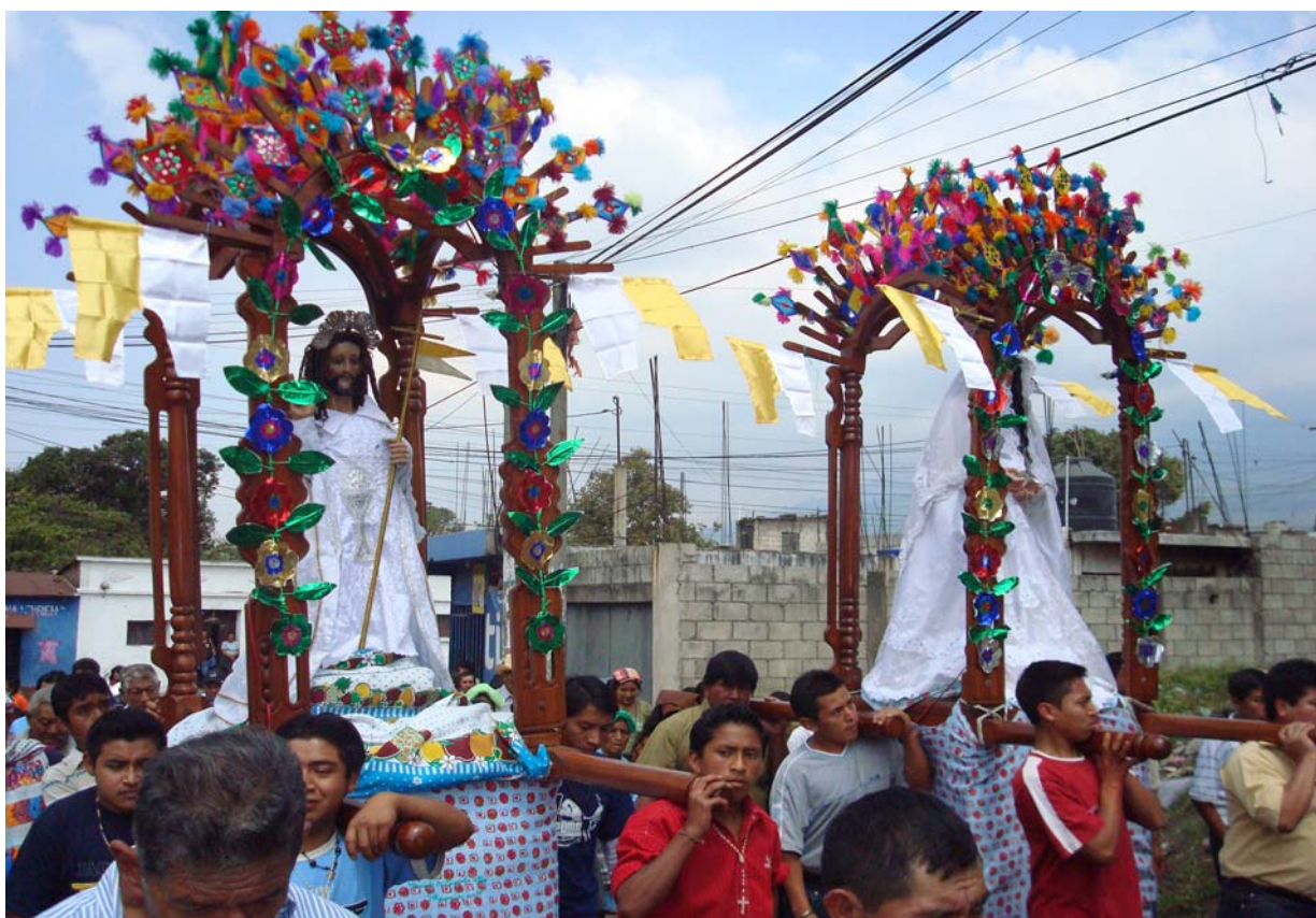
Ilustración No. 33 Imágenes de Cristo Resucitado y Virgen de Candelaria en la procesión de cortesía, domingo de resurrección.

Llegados a la cofradía ambos grupos esperan para que las imágenes del Cristo resucitado como de la Virgen de Candelaria sean preparadas en su trono.