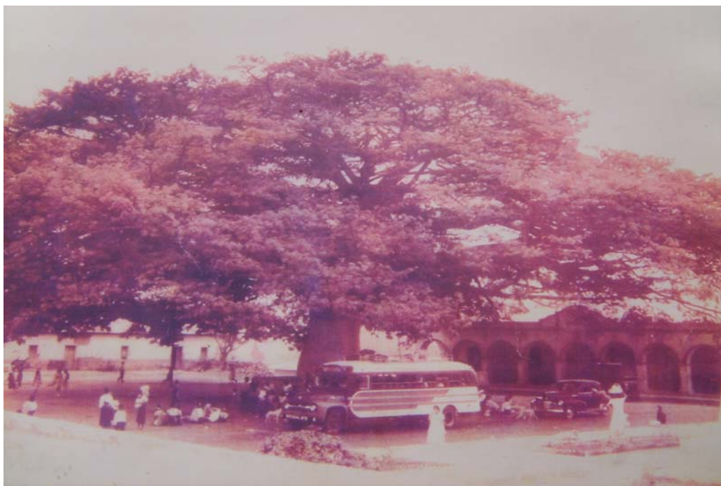
Ilustración No. 1 Parque central del municipio de Palín, departamento de Escuintla (Ceiba, y municipalidad, año 1960) fotografía, archivo particular.

El primero fue trasladado al lugar en el que hasta la fecha se encuentra ubicado, con la denominación de Santo Domingo de Mixco; el otro grupo al sitio nombrado de la Cruz(hoy Chinautla);y el tercero , compuesto por un indeterminado número de familias, al pintoresco valle de Palimachoy, paraje dotado de una singular perspectiva panorámica y dueño de un cuadro paradisíaco, único por la envidiable posición geográfica en que se encuentra y las bellezas naturales que encierra, quedando el pueblo fundado bajo la advocación de San Cristóbal Amatitán, nombrando por consiguiente las primeras autoridades civiles compuestas por un Alcalde Mayor y dos regidores además el respectivo encomendero, encargado de cobrar los primeros tributos, organizar a los “indígenas esclavos” y proveer el vestuario que debían usar para su debido control. 8