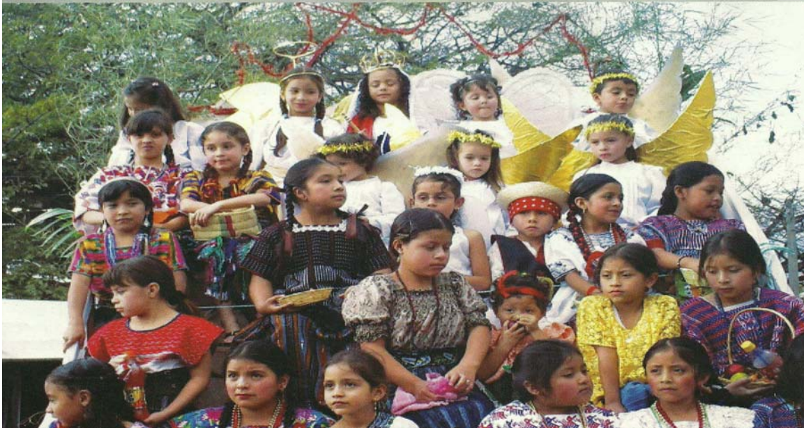
Ilustración No. 24 Niños en la tradicional carroza del convite, al fondo se observa una niña que representa a la Virgen del Patrocinio. (Fotografía, Periódico “El Chiltepe” año 2008).