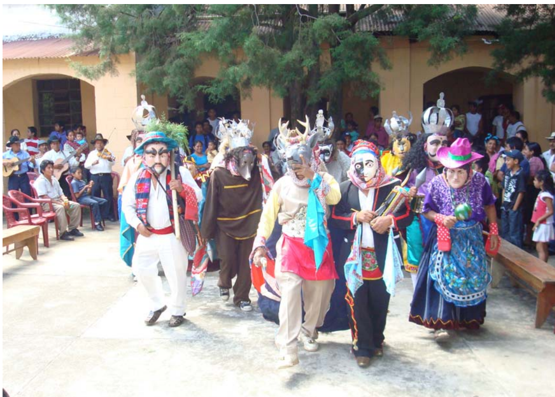
Ilustración No. 21 Personajes de danza el Venado finalizando la representación.

Su argumento esta basado en la casería que se da de animales por parte de un cazador y su esposa junto con sus dos perros, entre los diferentes animales que se identifican en la danza se encuentra. El conejo, el tigre, el león, el pisote, el mapache, el mico y el mas importante el Venado, cada uno con su respectivo argumento, generalmente todos bajan para celebrar a la virgen María, uno a uno los van cazando pero el mas apetecido es el venado, siendo el último en cazar.