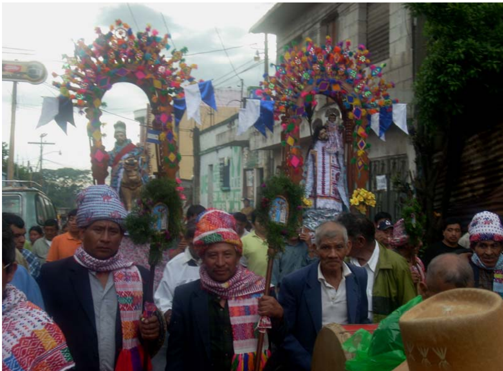
Ilustración No.8 Cofradía de Santiago Apóstol y San Cristóbal (fotografía, Marvin Emiliano Rodríguez año 2008)