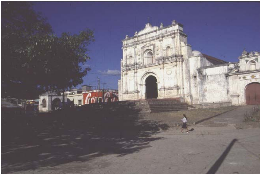
Ilustración No. 2 Parque central del municipio de Palín, departamento de Escuintla (iglesia, Ceiba, Ermita y Convento Parroquial año 1980) fotografía, archivo particular.