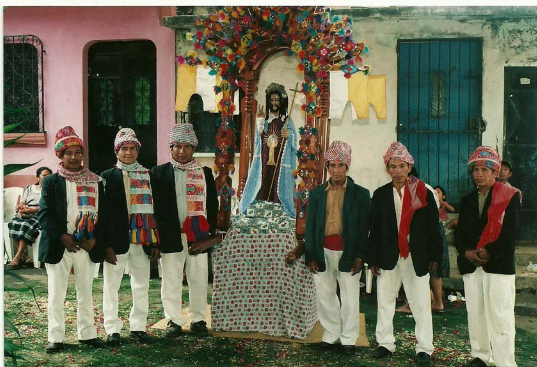
Ilustración No. 4 Alcaldes y mayordomos con su indumentaria ceremonial, en la Cofradía de Corpus Christi.