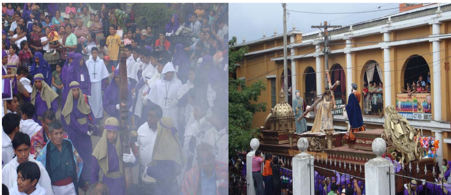
Ilustración No. 28 y 29 (izquierda) Procesión de la cruz de pasión al momento de ingresar al templo parroquial. (Derecha) procesión del Nazareno el día jueves Santo pasando frente al parque central de la población. (Fotografía, Marvin Emiliano Rodríguez año 2008).

Previo a su recorrido el día Jueves Santo se realiza la novena a la Cruz (nueve días de rezo del santo rosario en el templo parroquial), concluyendo el día miércoles Santo en donde se realiza la velación al Nazareno.