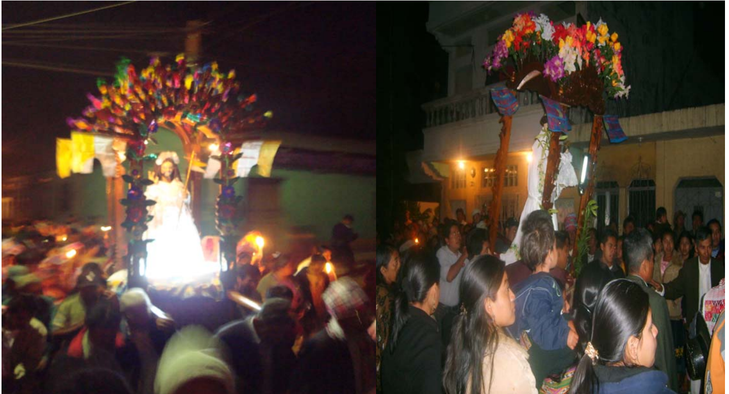
Ilustración No. 30 y 31 Imagen del Cristo Resucitado (Corpus Christi) y San Antonio, en la importante procesión de resurrección, en la madrugada del domingo. (Fotografía, Marvin Emiliano Rodríguez año 2009).

Otras de las manifestaciones de las Costumbres y tradiciones en el municipio de Palín es la celebración de la procesión del día domingo de Resurrección. Finalizada la Semana Santa el día viernes Santo en toda Guatemala las procesiones del Santo entierro son esperadas con mucha fe por todos los feligreses, en Palín aparte de estas importantes procesiones, el día domingo de Resurrección es esperado con mucha alegría. En realidad debe ser el día más importante, ya que es el día en que Cristo venció a la muerte.