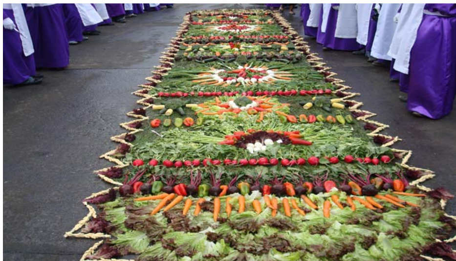
Ilustración No. 26 Alfombra del Jueves Santo, elaborada a base de verduras. (Fotografía, Marvin Emiliano Rodríguez año 2008).