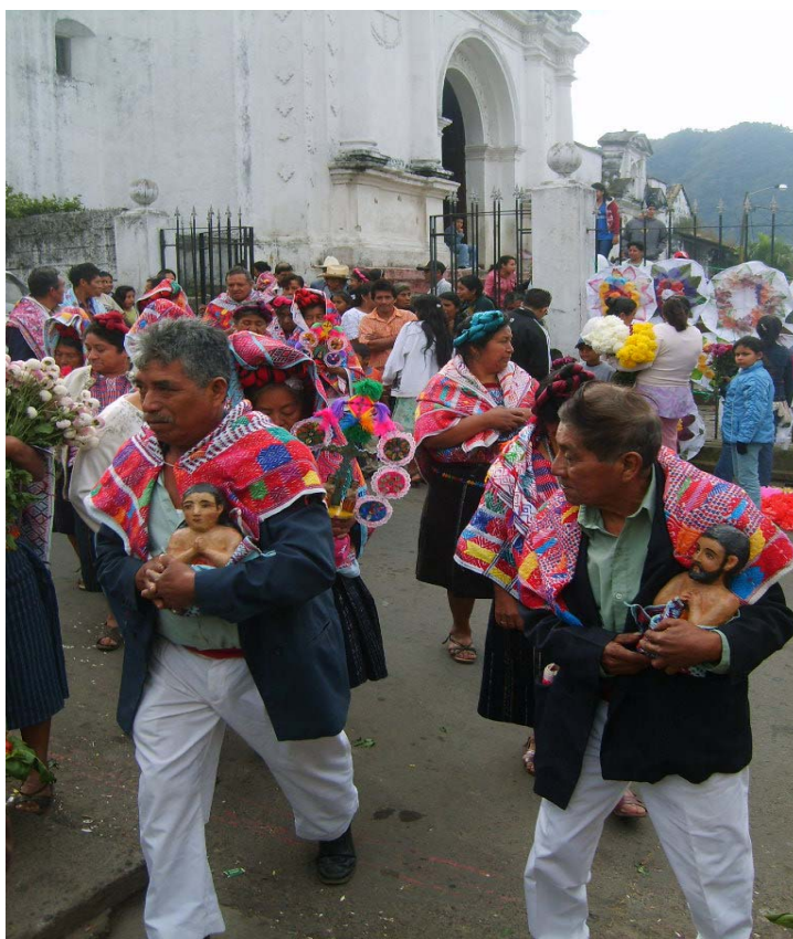
Ilustración No.13 y 14 (Izquierda) Cristo de las Ánimas en el templo parroquial. (Derecha) miembros de la cofradía dirigiéndose a la casa del cofrade después de participar en la celebración litúrgica el día 01 de Noviembre.