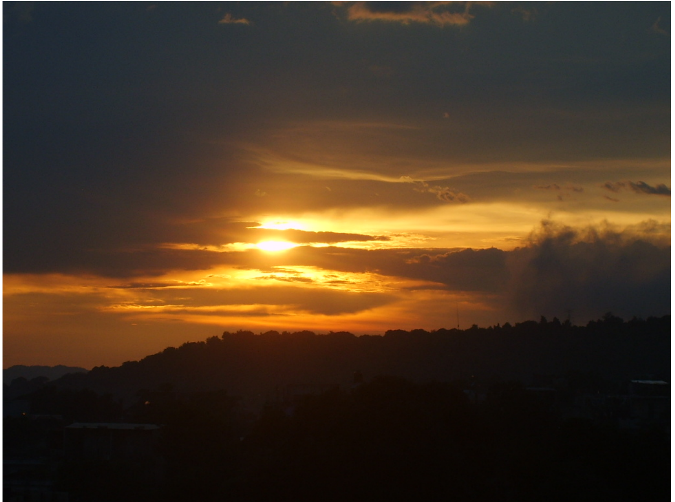
Puesta del sol, vista desde el municipio de Palín, departamento de Escuintla, como antesala a la boca costa en el Pacífico guatemalteco.