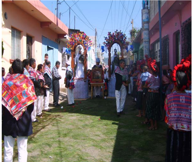
Ilustración No. 15 y 16 Imágenes de la Virgen María y el Niño Dios en su cofradía, a la derecha recibida en ceremonia especial por miembros de su cofradía al retorno a su hogar el 25 de Diciembre. (Fotografía, Marvin Emiliano Rodríguez año 2007).