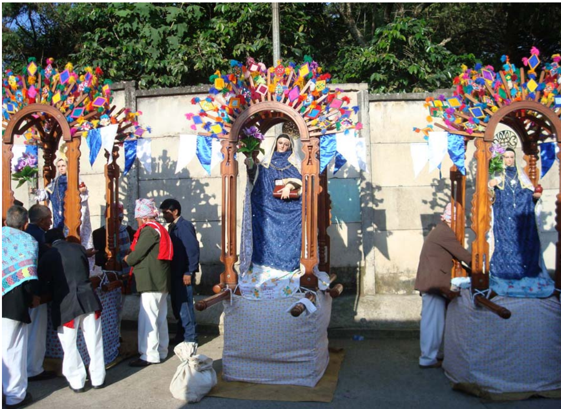
Ilustración No.10 A la izquierda Imagen de Santa Margarita, al centro Santa Teresa de Jesús, a la derecha Santa Teresa del Niño Jesús, a un extremo miembros de la cofradía y el Comité preparando los tronos para la procesión del 15 de octubre. (Fotografía, Marvin Emiliano Rodríguez año 2008)