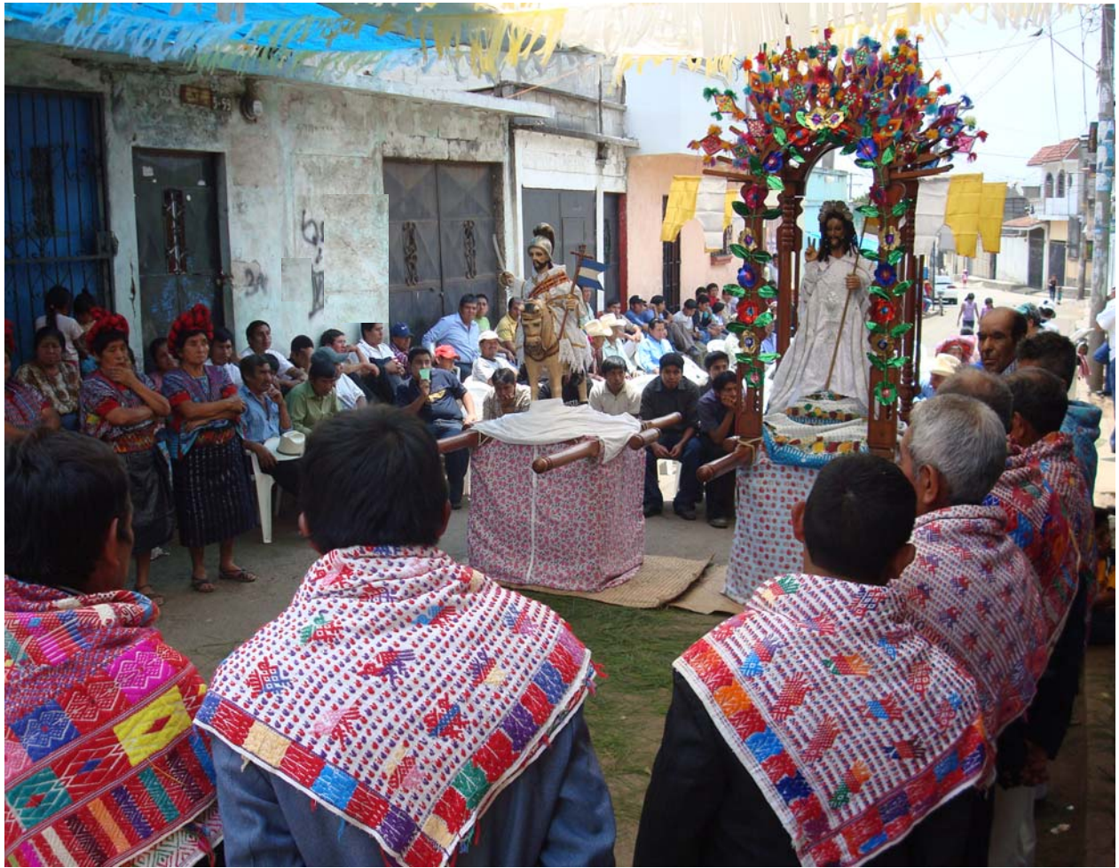
Ilustración No. 37 Imagen de Cristo Resucitado y Santiago apóstol en la ceremonia de recepción por los ancianos miembros de la Cofradía, terminada la procesión de resurrección.