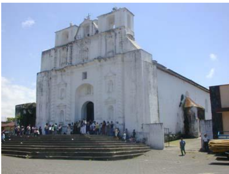
Fachada de la iglesia católica de Samayac

Es la predominante en la población, tiene un imponente templo tipo colonial declarada Monumento Nacional. Cuenta con otras dos iglesias pequeñas denominadas de “El Calvario” y la de “Justo Juez”. Las imágenes más veneradas son las de la Virgen de Concepción tiene el título de PATRONA DE SAMAYAC y en cuyo honor se celebra la feria titular del municipio el 8 de diciembre. La imagen de JUSTO JUEZ a la que se le atribuyen muchos milagros es venerada, y en su honor se celebra la fiesta de la romería del Tercer Viernes de Cuaresma. La imagen de Esquipulas cuya celebración se realiza el 15 de enero.