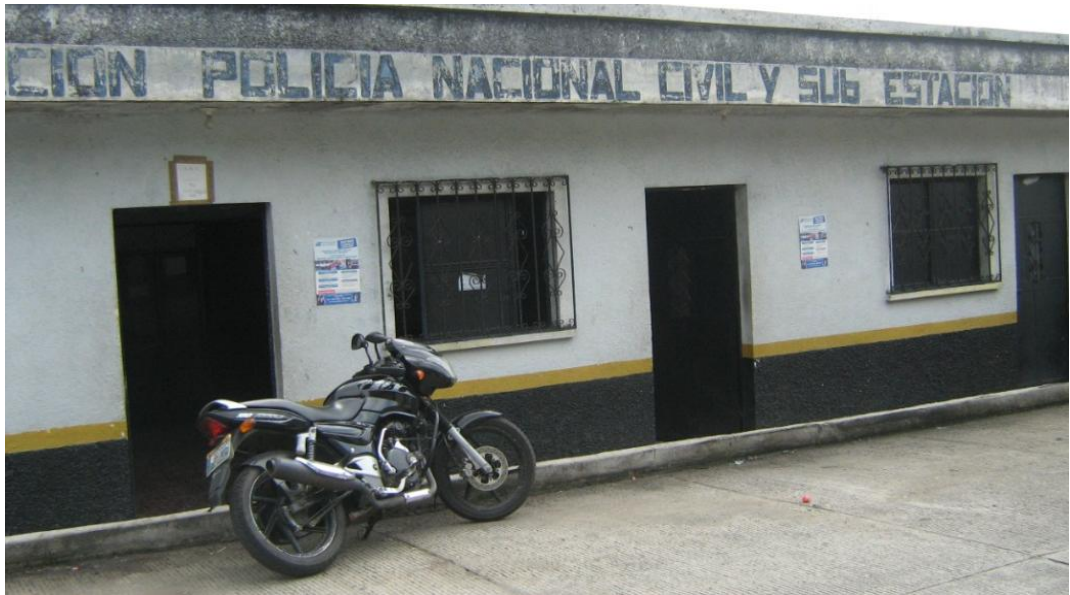
Sub estación de la Policía Nacional Civil –PNC-