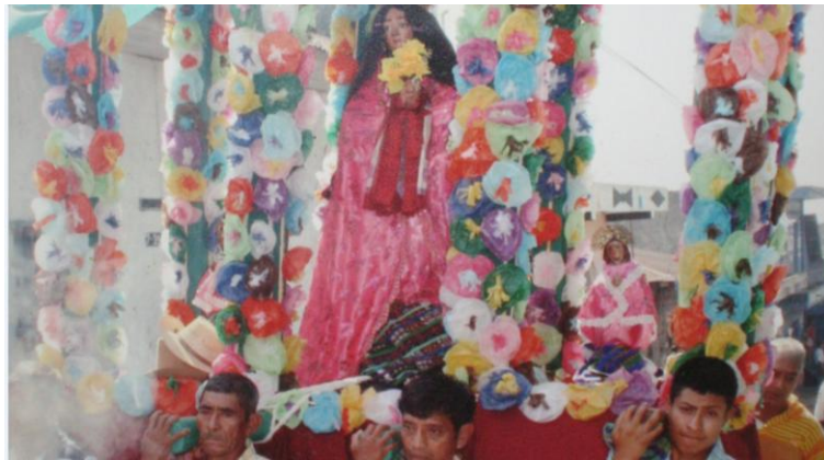
Imagen de la Virgen María, patrona de la cofradía

Por el momento se está tramitando por medio de Ministerio de Cultura y Deportes la recuperación de las imágenes de San Jerónimo, Sacramento y Pensamiento, imágenes que permanecen a cargo de personas ajenas a la cofradía.