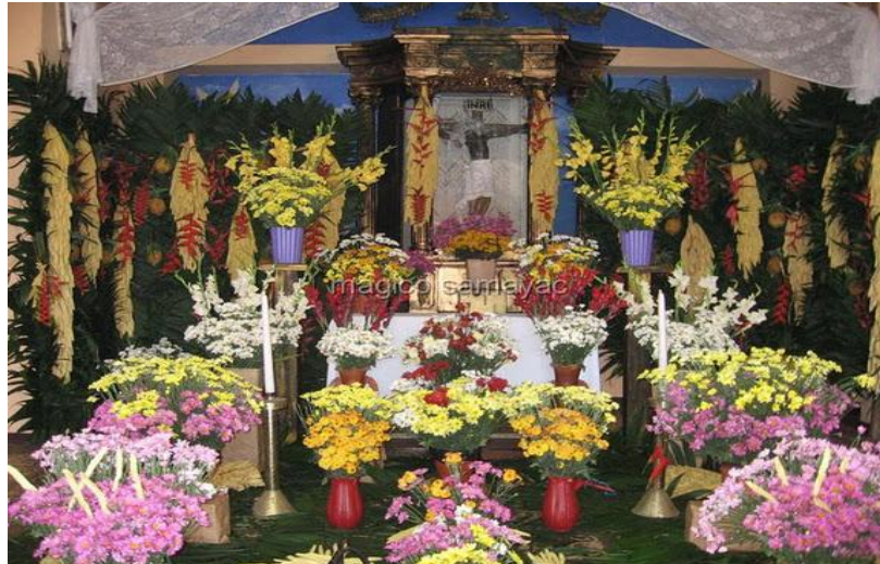
Altar en honor al milagroso Cristo de Esquipulas.

Cantón Concepción, 15 de agosto, celebran el día de su fundación. Además de tener a su cargo la actividad de “Los Judíos” que se lleva a cabo el viernes santo, representando la pasión de Cristo, mezclada con tradiciones propias del lugar.