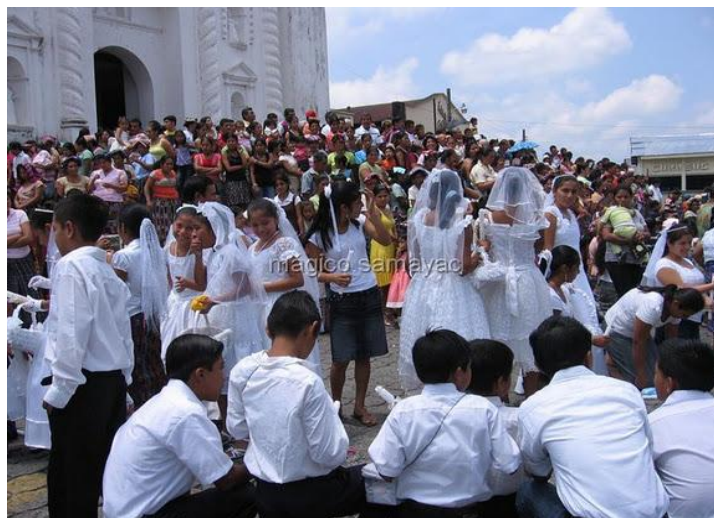
Primera comunión, día de la virgen de concepción.