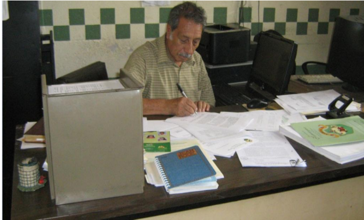
Secretario Municipal desempeñando sus labores.