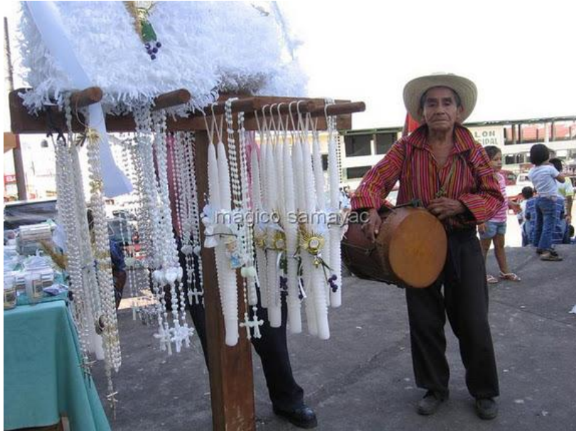
Los ancianos de la localidad ejecutan el tún el día de celebración de las imágenes de la cofradía