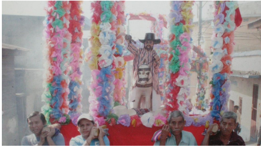
Imagen de Santiago