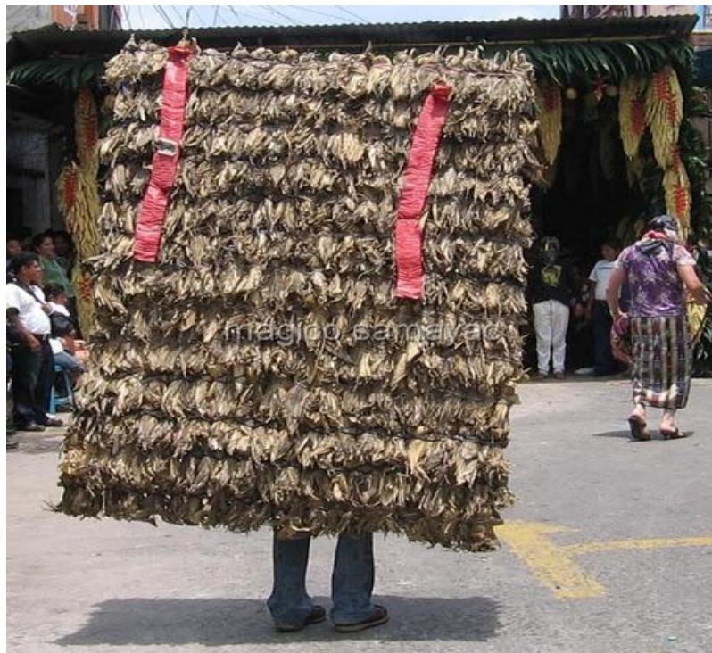
Tradicional quema del rancho, en el día de Corpus Christi