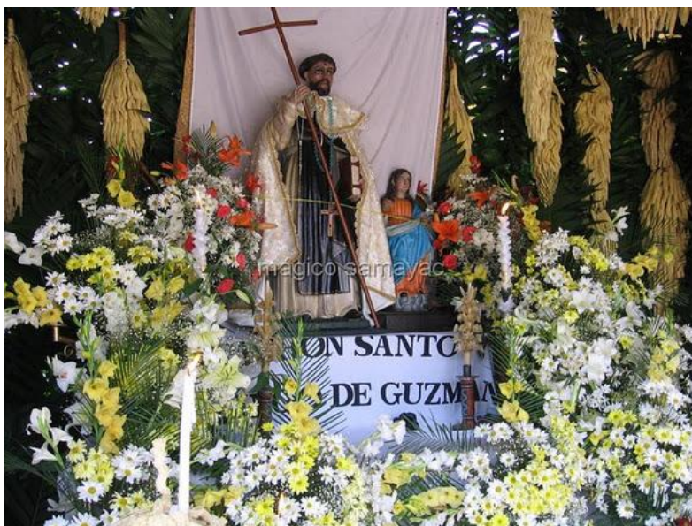
Altar a Santo Domingo de Guzmán, en el Cantón Santo Domingo del municipio.