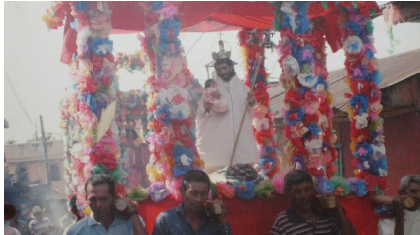
Imagen de San José