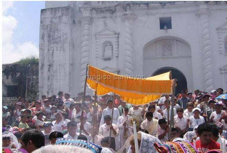
Procesión del corpus crhisti, al salir de la iglesia católica.