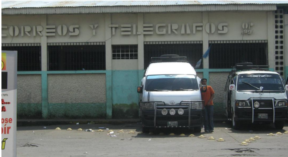
Correos y Telégrafos