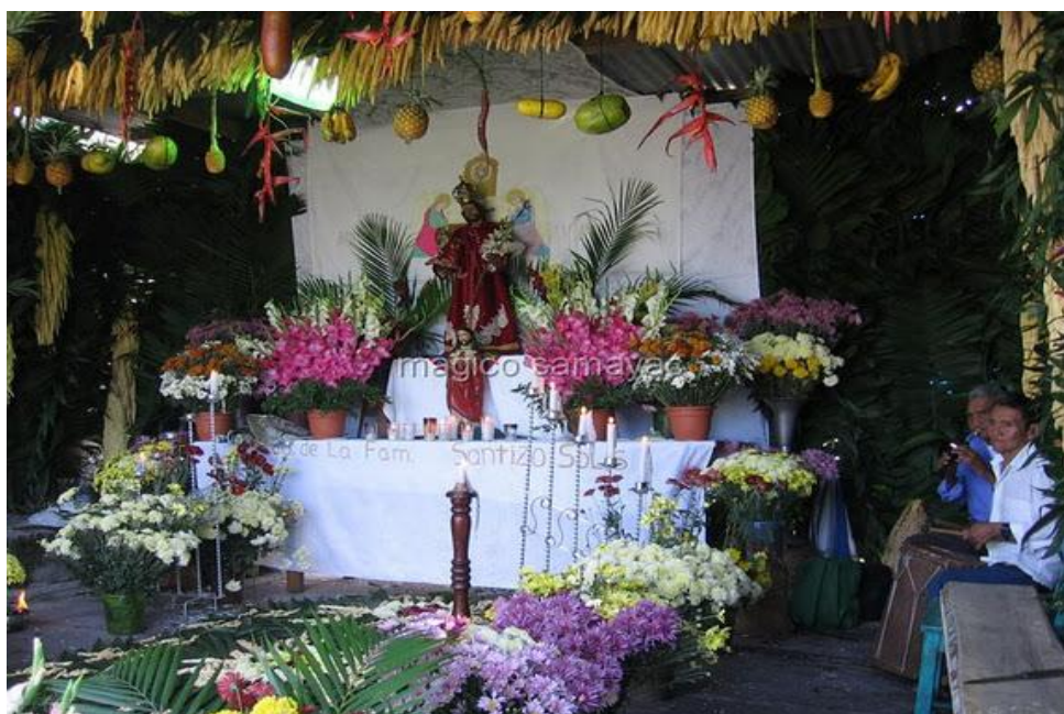
Altar a San Antonio de Padua, en el Cantón San Antonio de municipio.