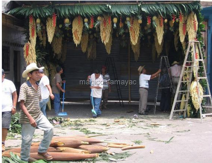
Preparación de altar para el patrón del cantón.