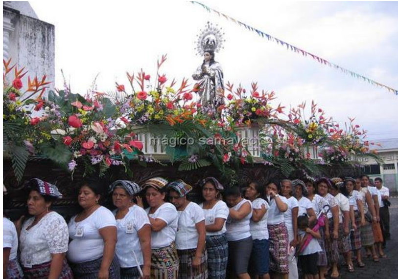
Procesión de la imagen de la virgen de concepción.

Como parte de la fe religiosa, el día de la virgen de concepción los niños y niñas realizan su primera comunión para formar parte de la comunidad católica.