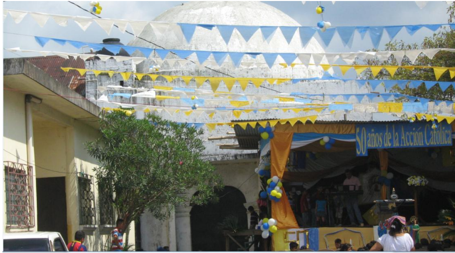
Iglesia del Señor Justo Juez