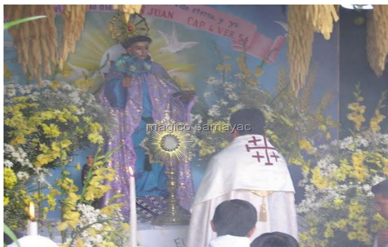
Eucaristía celebrada en el día de corpus crhisti.

Durante esta celebración se lleva a cabo la quema de ranchos, baile del tun y se elabora un altar en cada uno de los cantones,