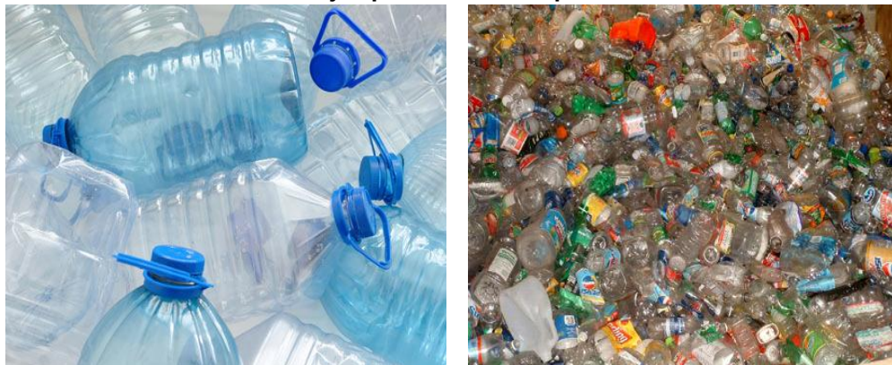
Ejemplo de residuos plástico