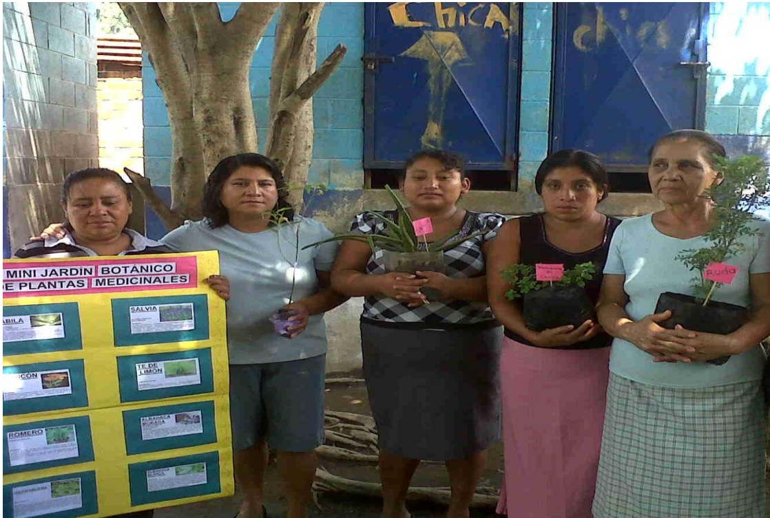
Padres de familia involucrados activamente en la actividad