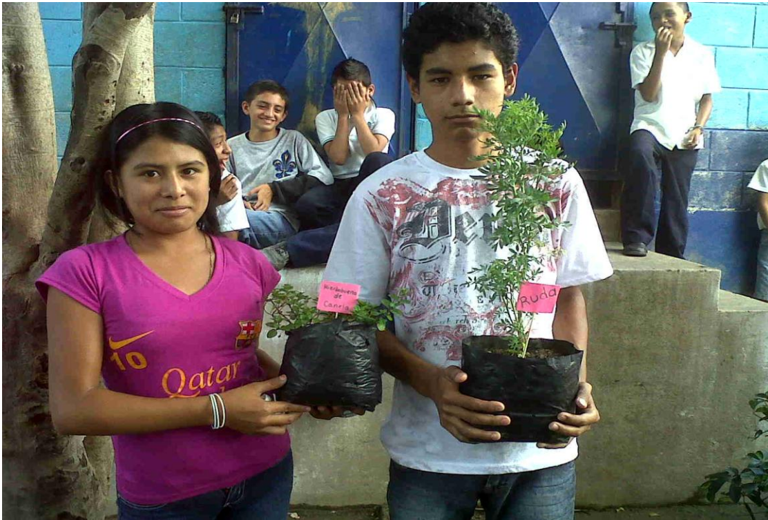
Estudiantes participando en la creación del Mini Jardín Botánico