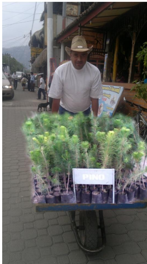
Trasladando los arbolito hacia el lugar de donde los llevará el camión