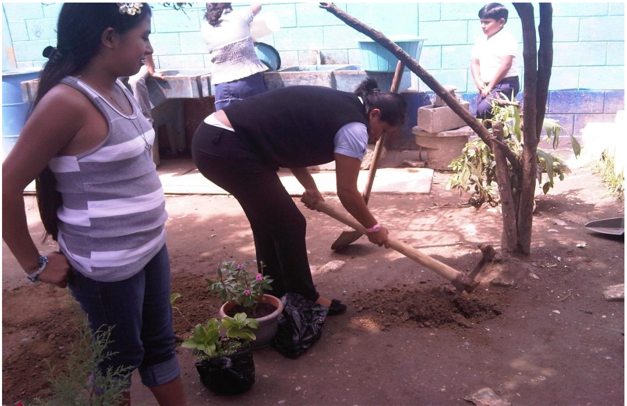
Maestros, padres de familia y estudiantes colaborando