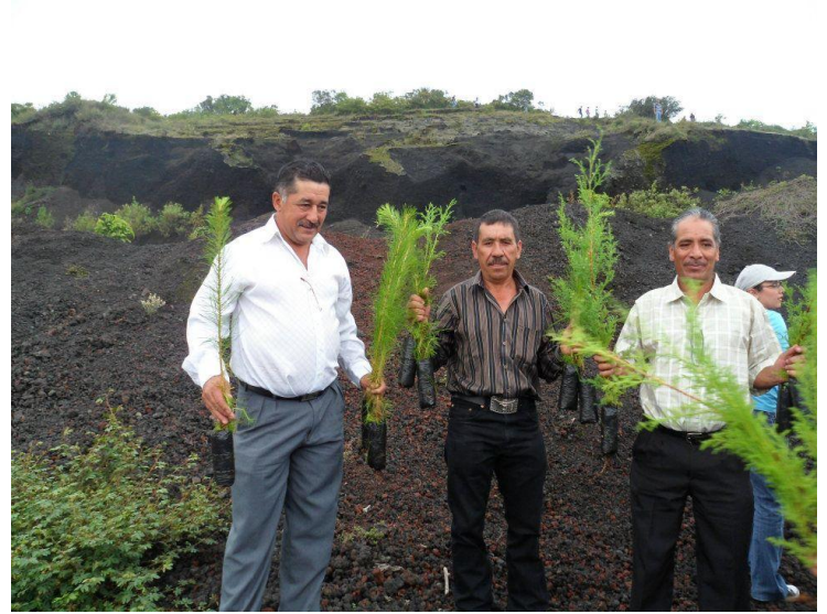
Inauguración para plantación de árboles