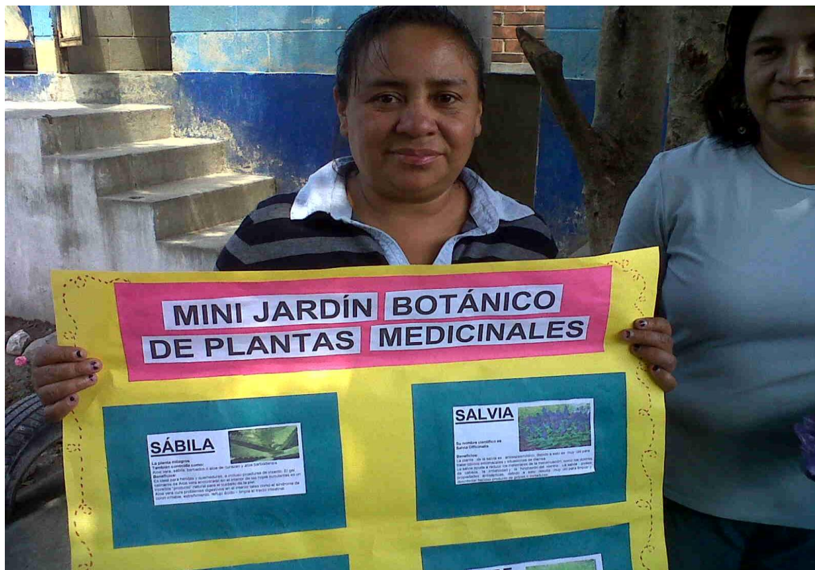
En la preparación del Mini Jardín Botánico