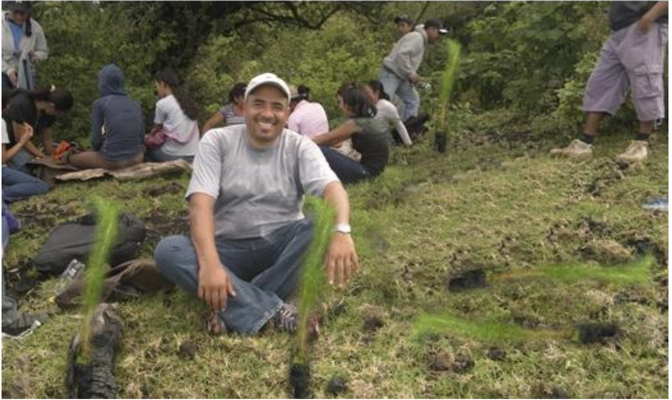
Estudiantes de la comunidad en el lugar para reforestar.