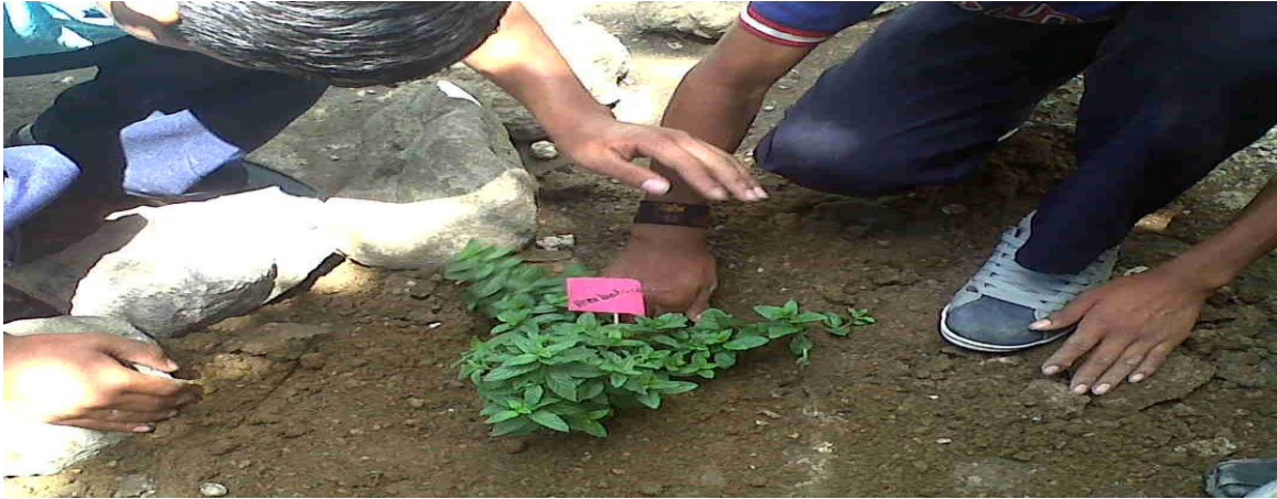
Agregando rótulos informativos al Mini Jardín Botánico