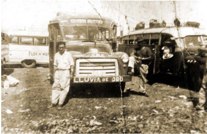
Medios de transporte