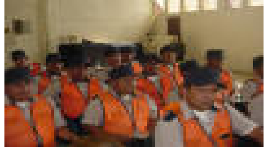
Policía Municipal de Tránsito