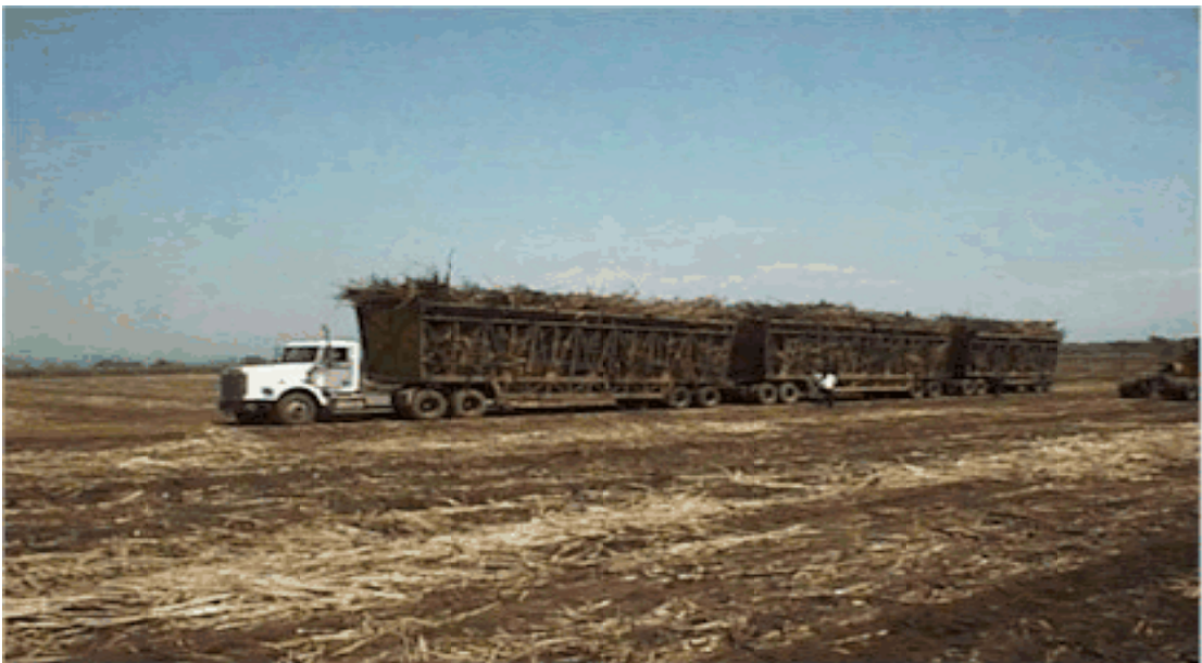
Transporte de caña de azúcar Tiempo de Zafra