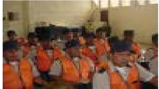
Policía Municipal de Tránsito