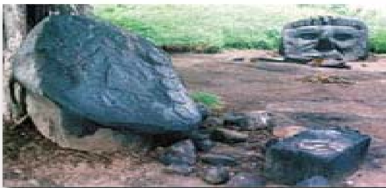
Altar y cabeza del Dios Mundo, en finca Santa Lucía Cotzumalguapa.

Además se encuentra el altar de sacrificio en el interior del edificio y el símbolo Luciano El Jaguar que está al lado derecho de la entrada