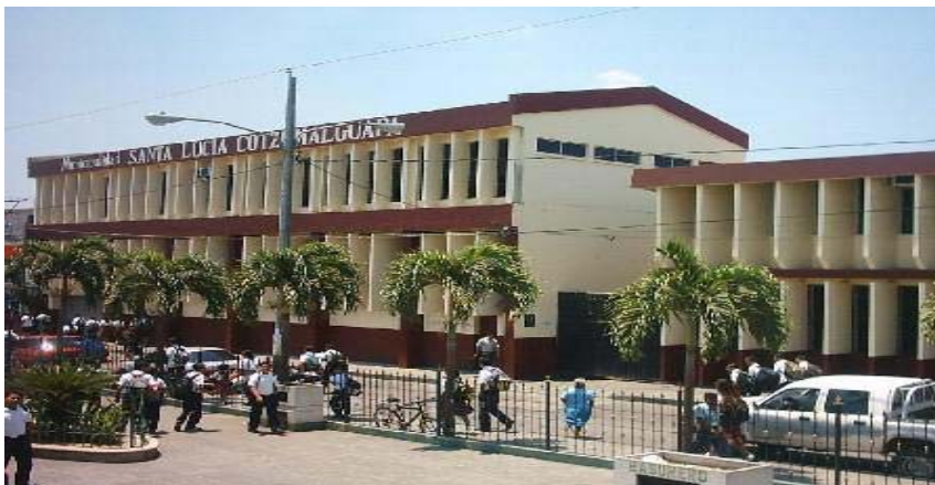
Municipalidad de Santa Lucía Cotzumalguapa