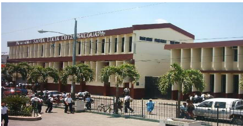
Municipalidad de Santa Lucía Cotzumalguapa