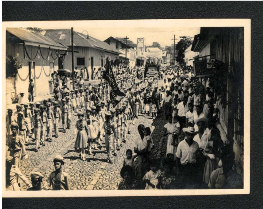
Desfile del 15 de Septiembre