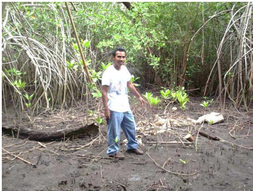
Preparando el terreno para Sembrar