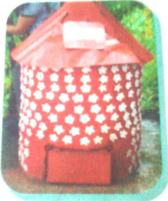
Fotos de los recicladores

Rojo: es el color elegido para los plásticos, tales como: bolsas, envases, entre otros.