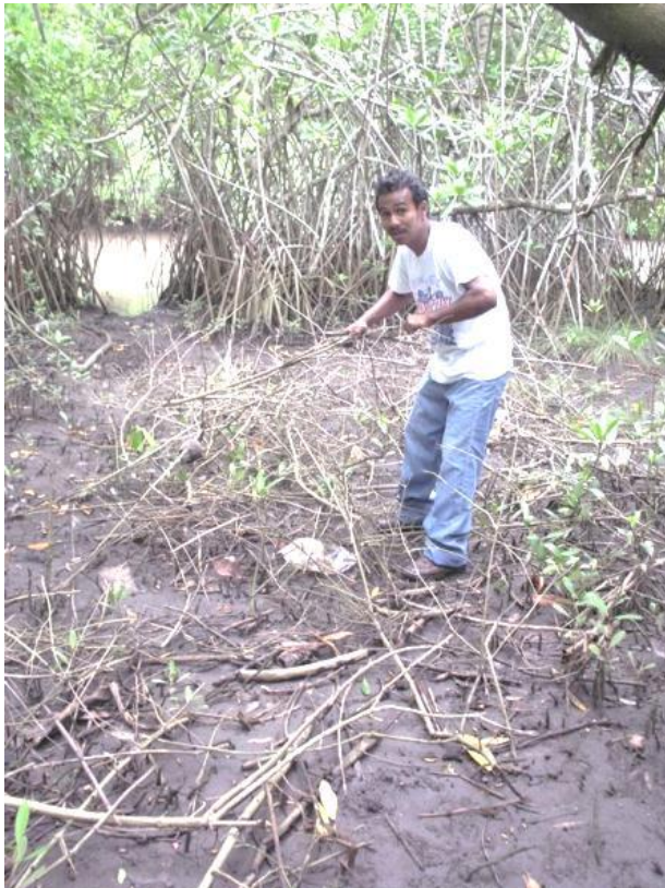
Limpiando el área a Reforestar