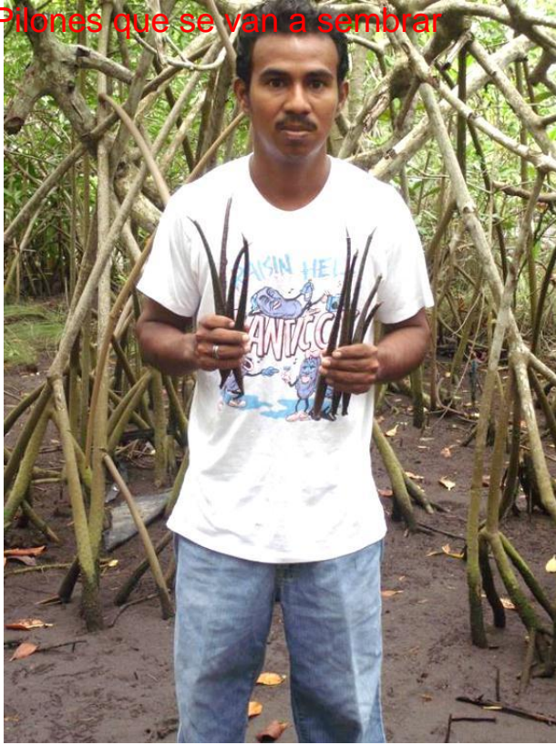
Pilones listos para Sembrar