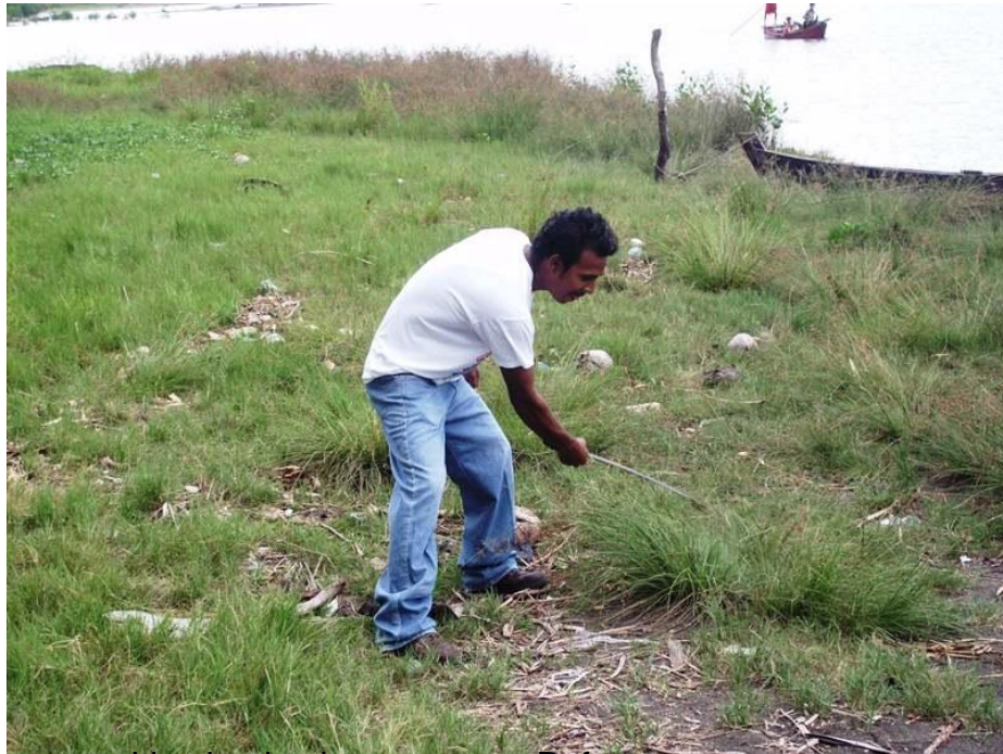
Limpiando el terreno para Reforestar