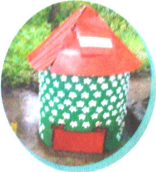
Fotos de los recicladores

Verde: para la basura orgánica, restos de algo que estuvo vivo o que fue parte de un ser vivo aquí se pueden encontrar ramas, hojas, cascara, semillas de frutas, huesos, restos de animales que luego de su descomposición se usan como abonos o fertilizantes para los suelos.