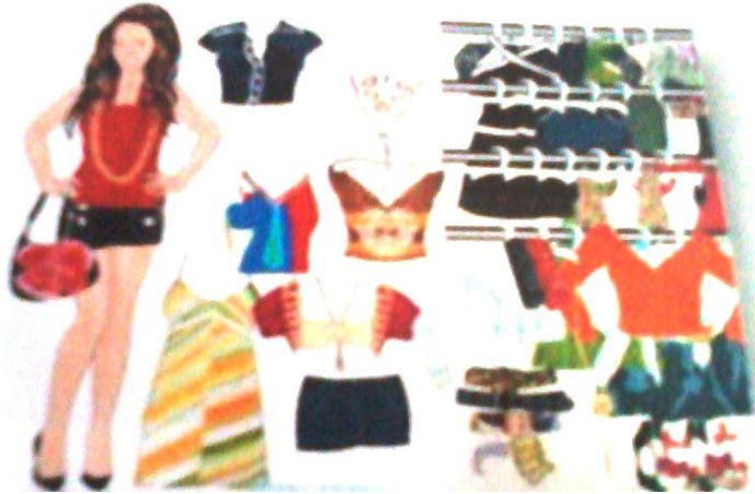
Trapos para limpieza del hogar.

Por último también se puede reciclar sin necesidad de desechos como en el caso de la ropa que se puede reutilizar bien donándola a una organización de caridad o transformándola en trapos para la limpieza del hogar.