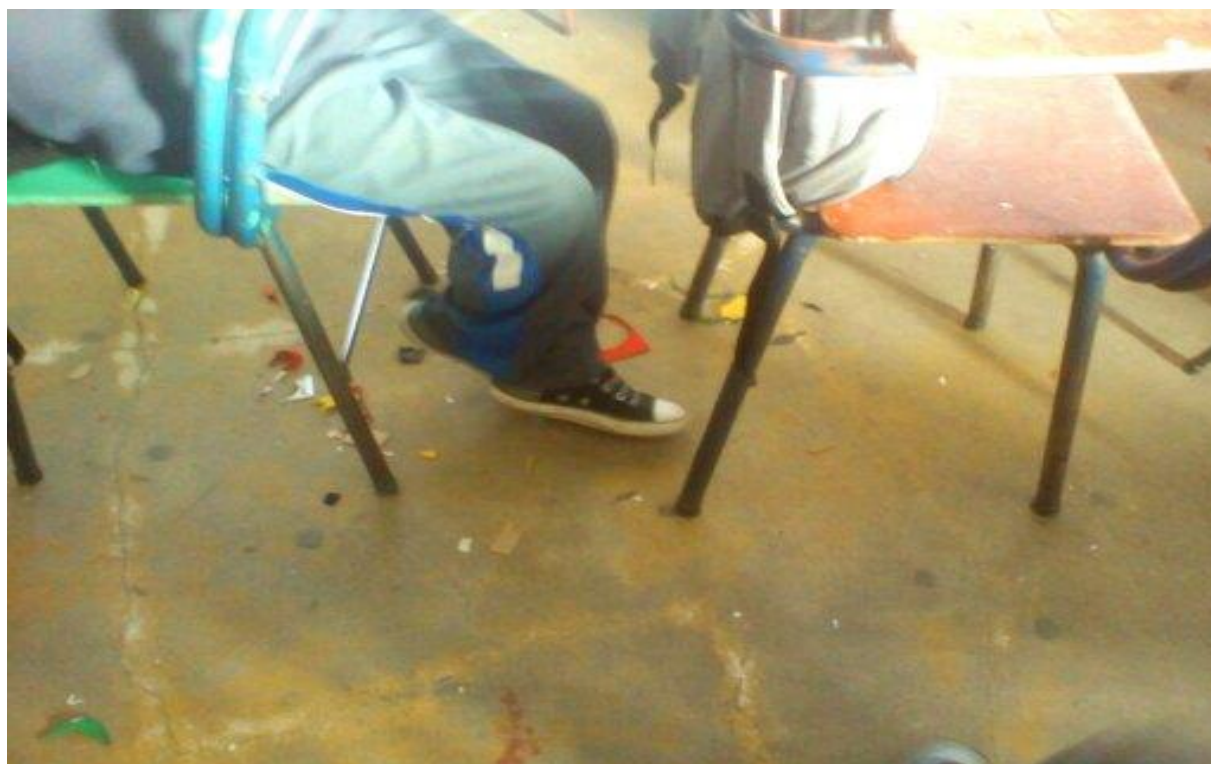
Evidencia de una de las aulas contaminado por la basura.