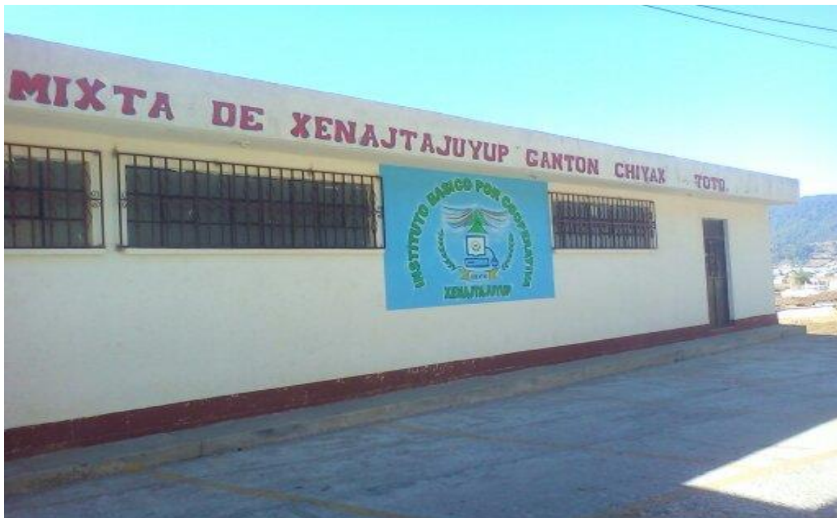
Evidencia del Establecimiento Educativo donde se realizó el proyecto.