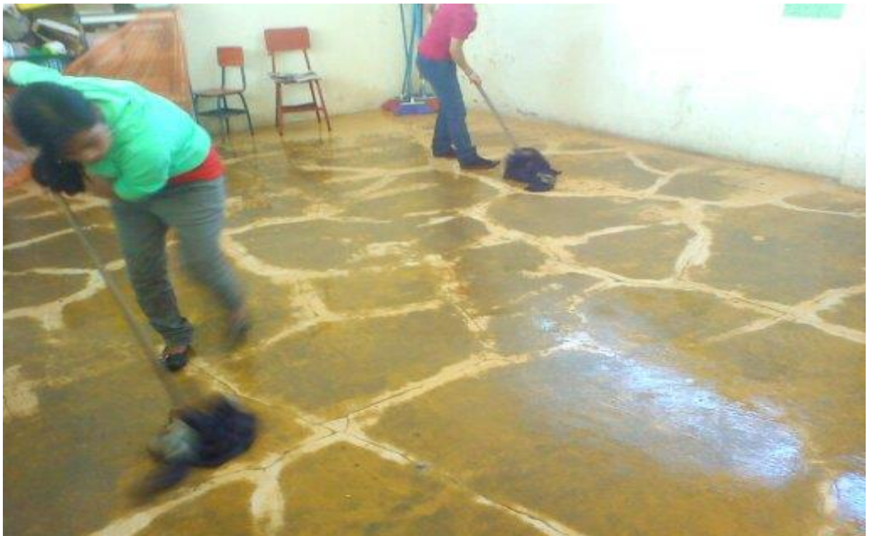
Estudiantes de tercero básico trapeando las diferentes aulas.