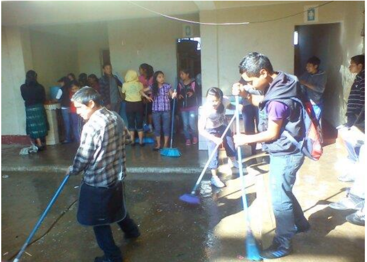
Estudiantes de tercero Básico barriendo y lavando el establecimiento.