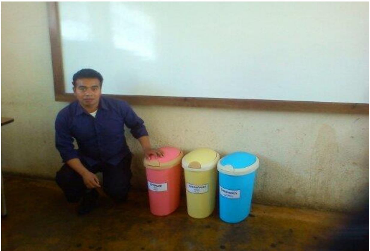
Entrega al establecimiento de utensilios para clasificar la basura.