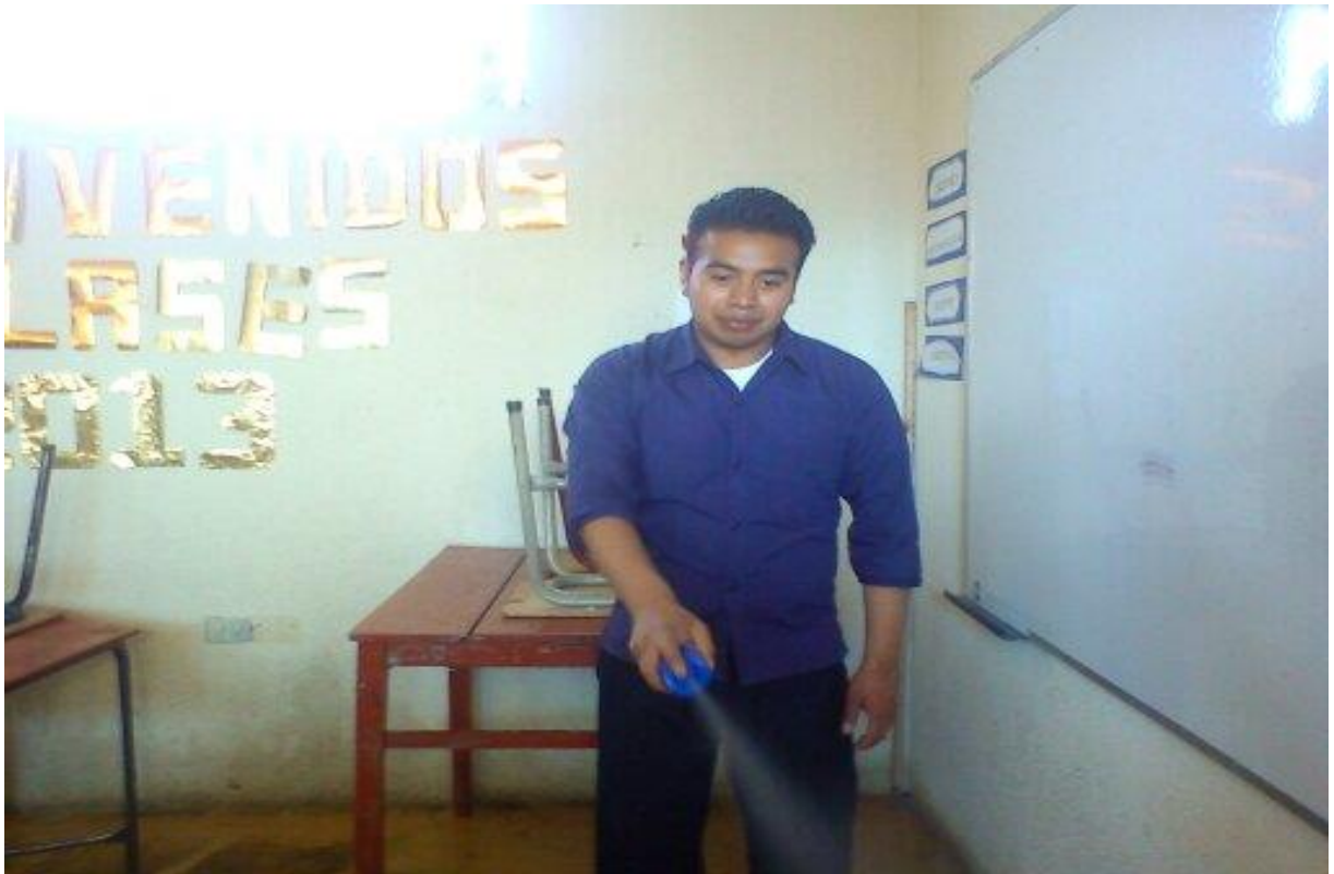
Yo como epesista utilizando ambiental para un buen aroma en las diferentes aulas.