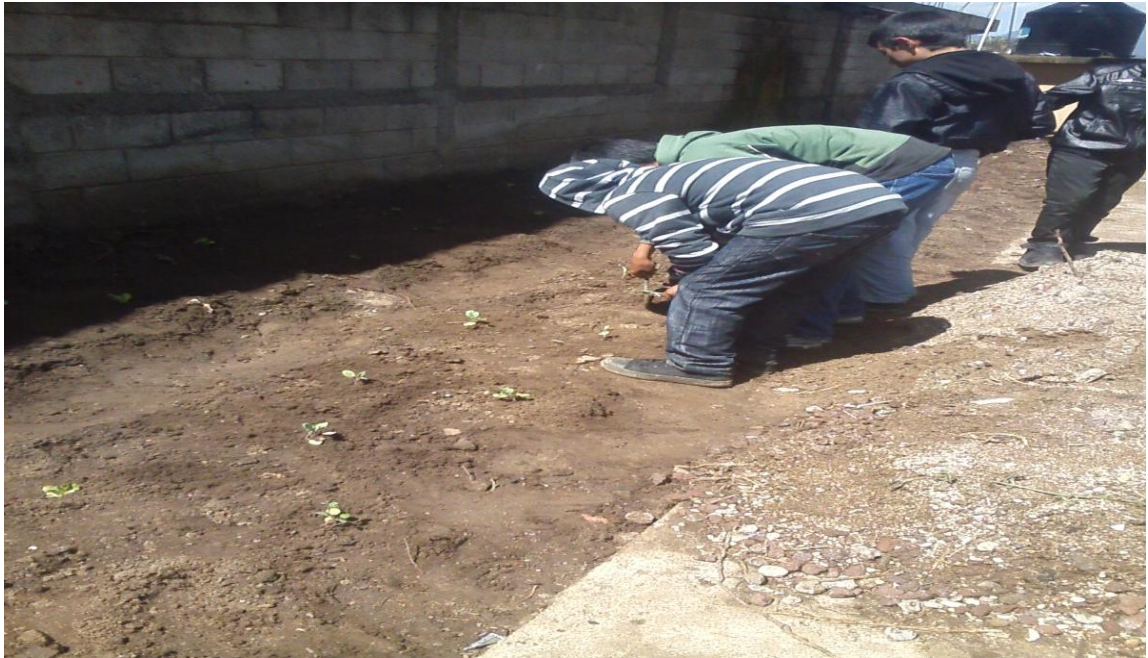
Los alumnos de la EORM Paraje chirramos de la aldea rancho de teja del Municipio de San Francisco el Alto, Totonicapàn plantando las semillas