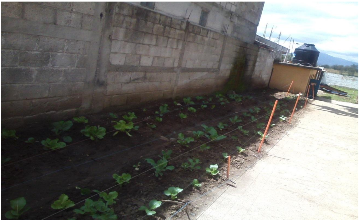
El proyecto del huerto escolar con la meta lograda