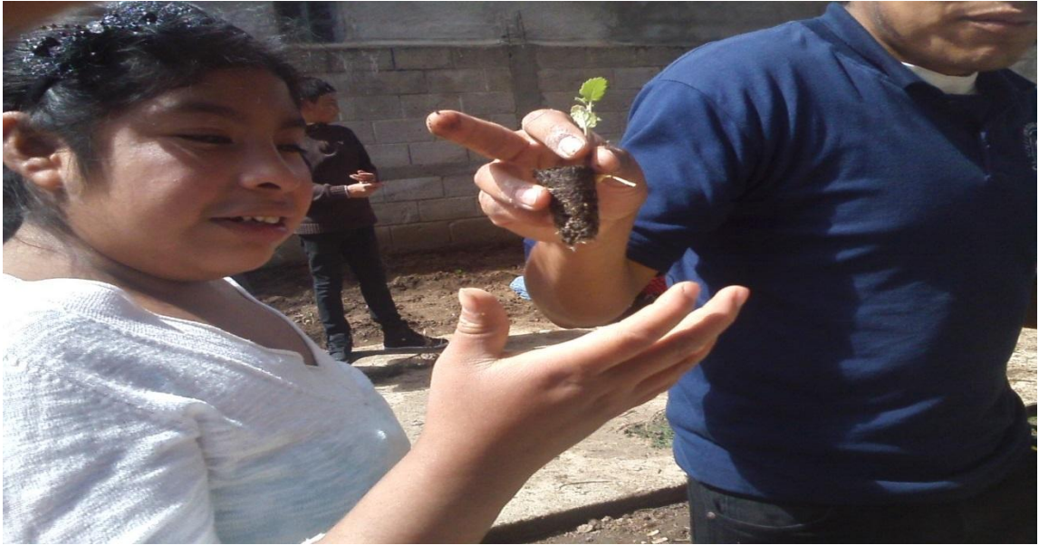
Entrega y muestra de algunas semillas para el huerto escolar