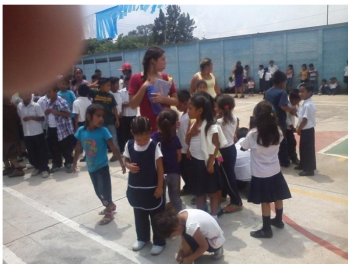
Epesista, directora y alumnos durante capacitación y entrega de aporte pedagógico.