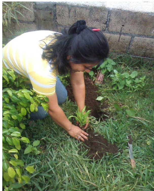
Alumnos trabajando en el huerto escolar