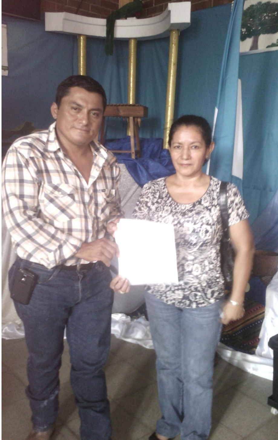
ENTREGA DE LA SOLICITUD AL SEÑOR ALCALDE MUNICIPAL DE CHIQUIMULILLA PARA EL DESARROLLO DE LA INVESTIGACIÓN ACCIÓN.