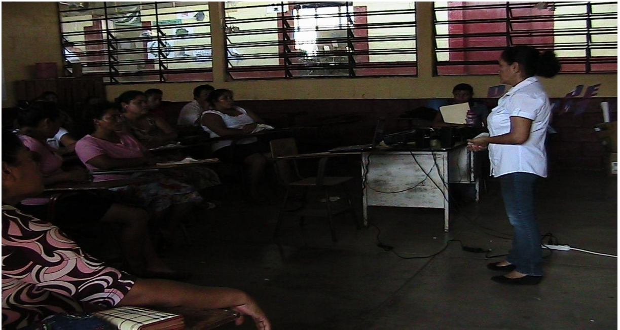
INVESTIGADORA COMPARTIENDO EL MODULO PEDAGÓGICO "COMO MINIMIZAR LA INCIDENCIA DEL BULLYING"; CON PADRES Y MADRES DE LOS ESTUDIANTES DE SEGUNDO BASICO DEL INSTITUTO "LIC CARLOS ARMANDO CASTAÑEDA DIAZ