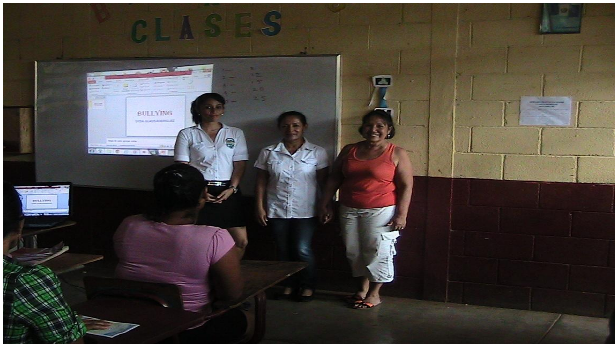
PSICOLOGA DE LA MUNICIPALIDAD DE CHIQUIMULILLA, INVESTIGADORA Y DIRECTORA DEL ESTABLECIMIENTO EDUCATIVO AGRADECIENDO LA ASISTENCIA A LOS PADRES DE LOS ESTUDIANTES DE SEGUNDO BÁSICO.