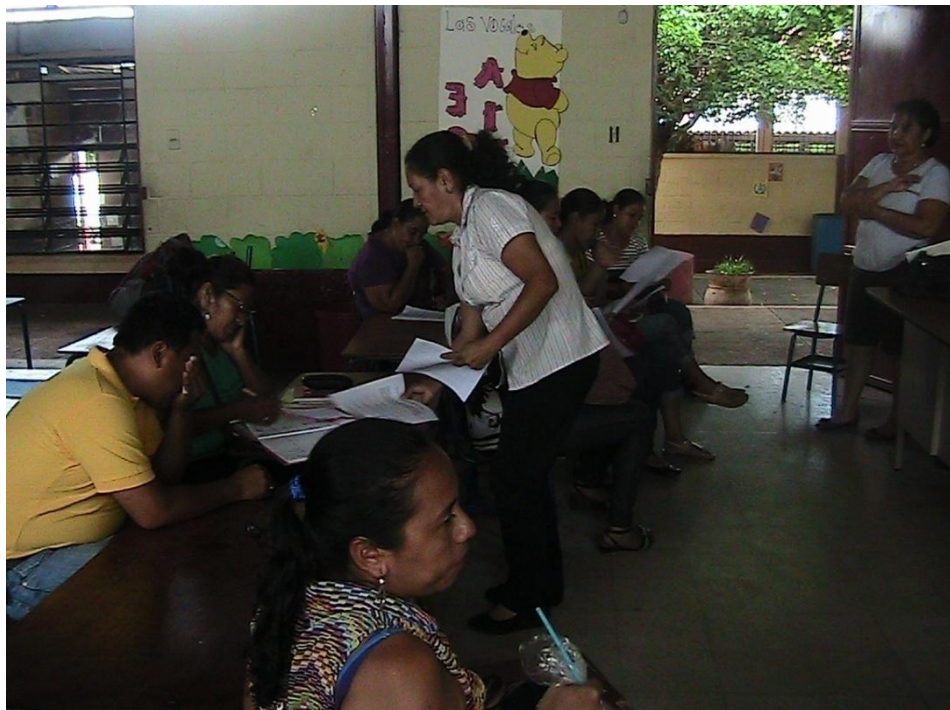
DOCENTES DEL ESTABLECIMIENTO RESPONDIENDO EL CUESTIONARIO ELABORADO PARA DETECTAR CARENCIAS EN LA INSTITUCIÓN.