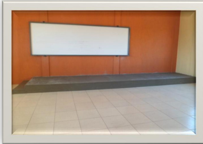
EVALUACIÓN DE MOBILIARIO