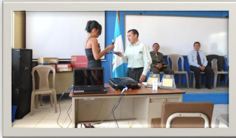
DEVELACIÓN DE PLAQUETA DE DONACIÓN