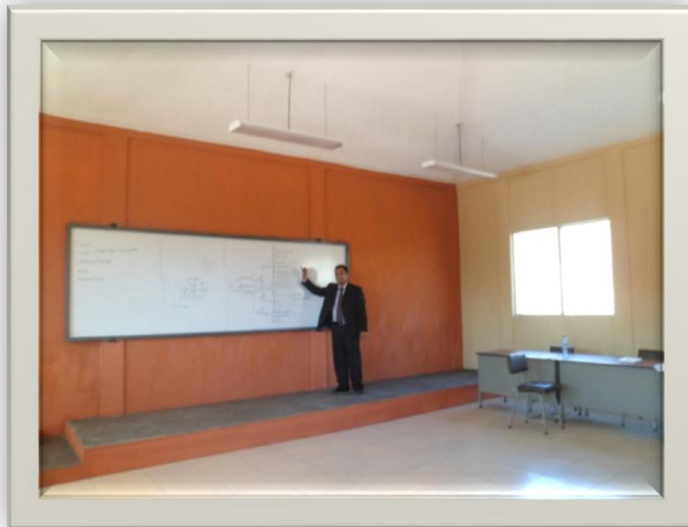
EXÁMENES DE GRADUACIÓN