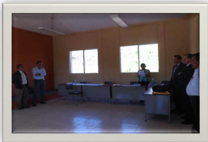
ENTREGA DE PROYECTO, “IMPLEMENTACIÓN DE MOBILIARIO Y EQUIPO”