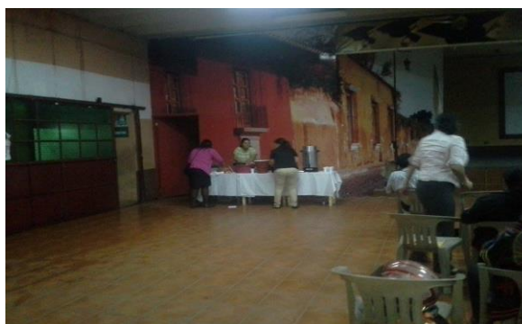
Capacitaci3n de docentes del INEB