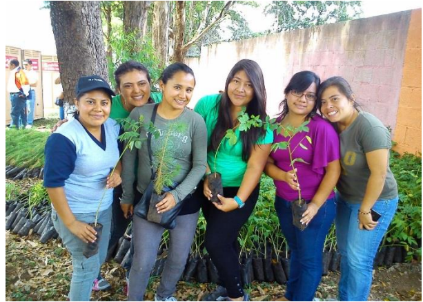
Reforestación de Árboles en San Cristóbal Guatemala