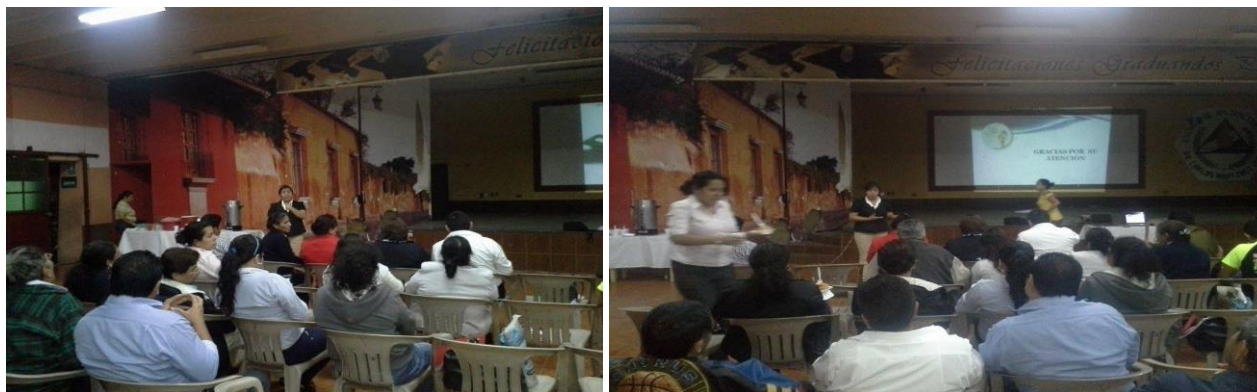
Capacitaci3n de docentes del INEB