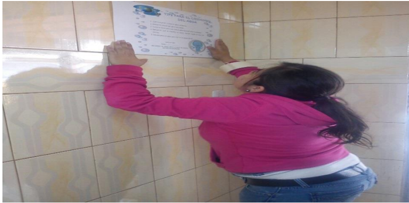
Campaña del agua por medio de afiches