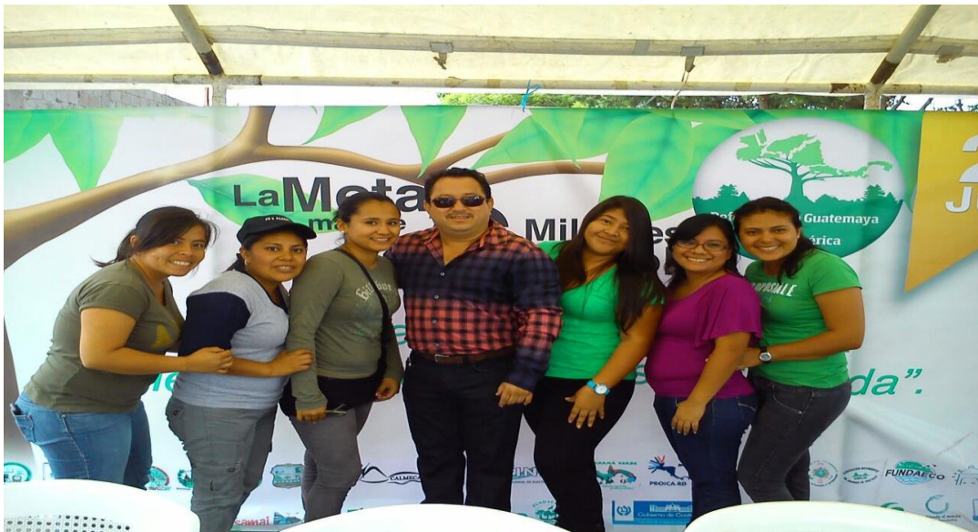
Reforestación de Árboles en San Cristóbal Guatemala