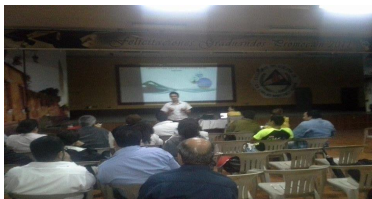
Capacitaci3n de alumnos del INEB