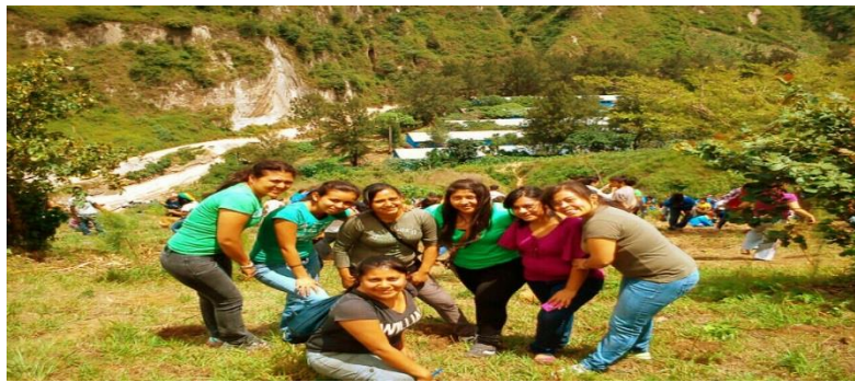
Reforestación de Árboles en San Cristóbal Guatemala