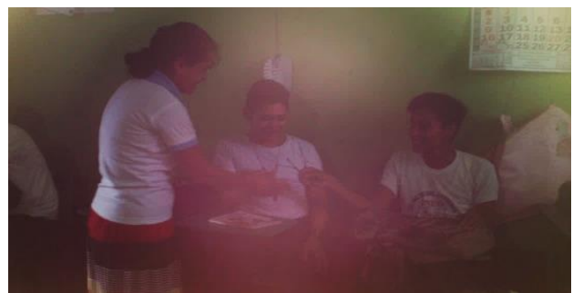
epesista realizando actividades relacionadas a los valores.

Uno de los pensadores más reconocidos de la historia como fue Aristóteles consideraba que las virtudes y los valores no son innatos, sino que se adquieren con la realización constante de actos buenos.