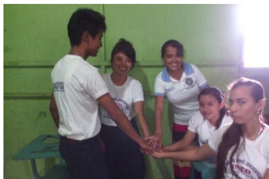
Epesista y estudiantes practicando valores.

En la vida todos enfrentamos problemas, la juventud, por ejemplo, tiene problemas específicos que enfrentar a lo larga de esta, problemas que en ocasiones por falta de responsabilidad son tomados como pretextos para justificar los comportamientos y actitudes para con los demás.