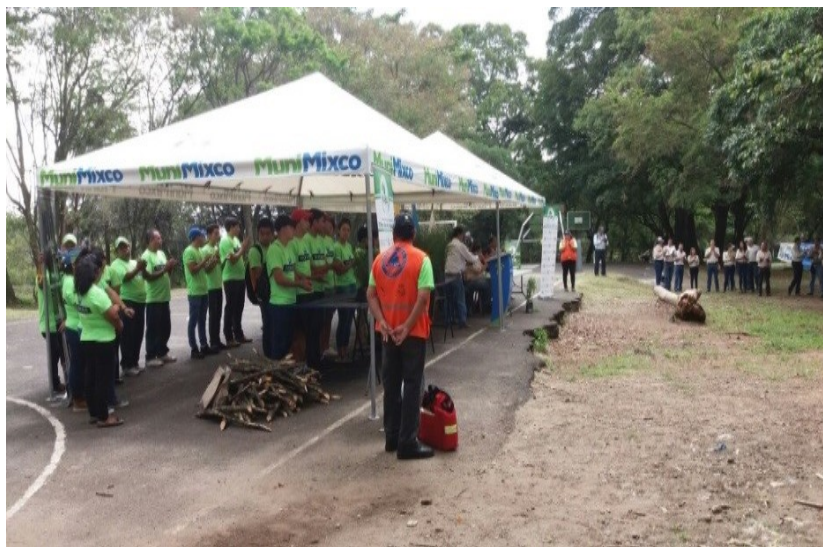
Fotografía No. 13

Se hace un el acto protocolar antes de iniciar la actividad.