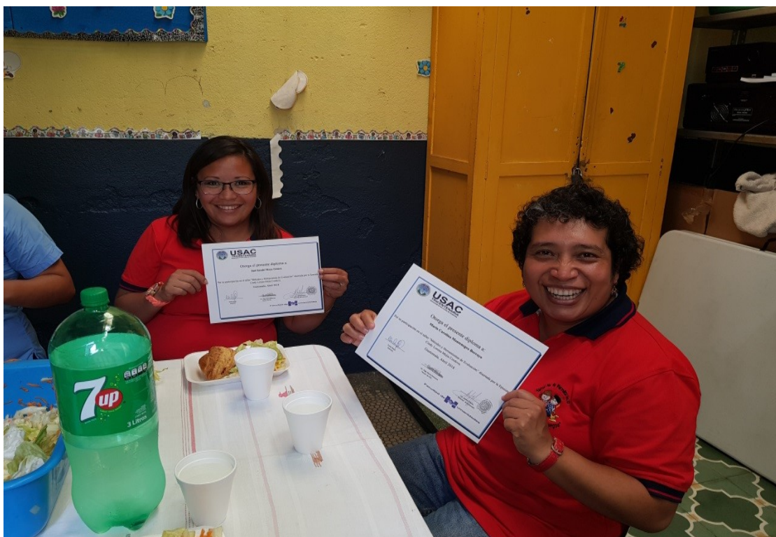
Entrega de diplomas a los docentes del establecimiento