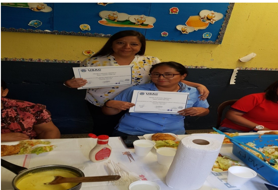
Entrega de diplomas docentes de 4 años