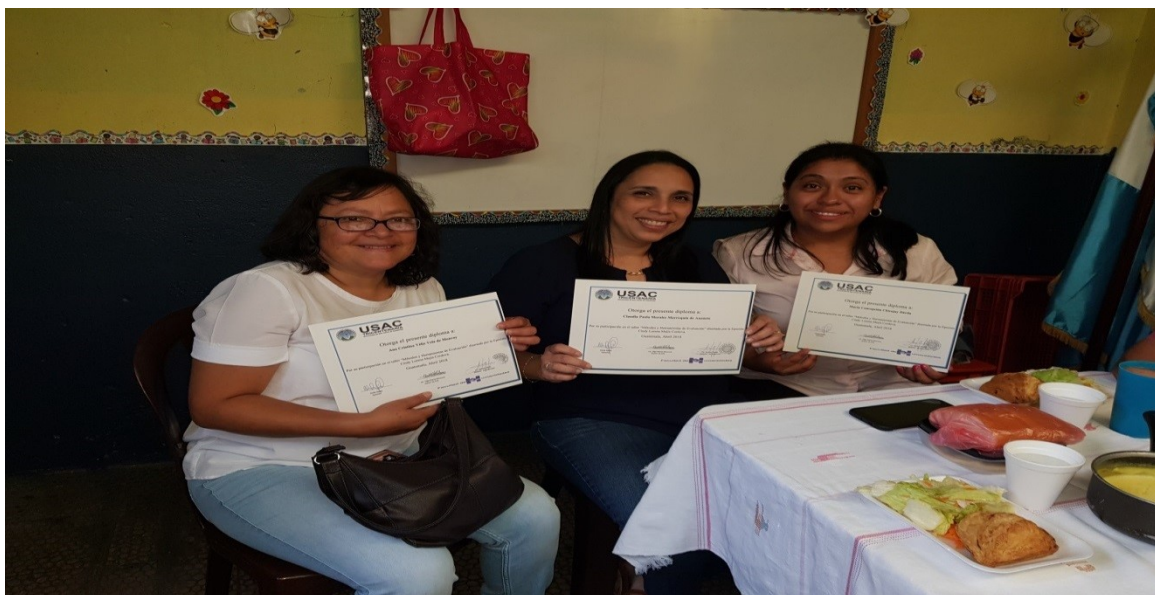
Entrega de diplomas a docentes Escuela Leonor "Cienfuegos"