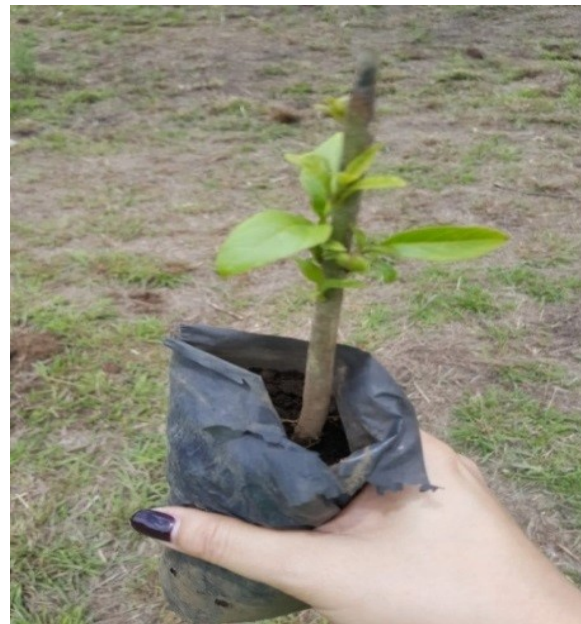
Empezando a forestar la colonia bosques de San Nicolás