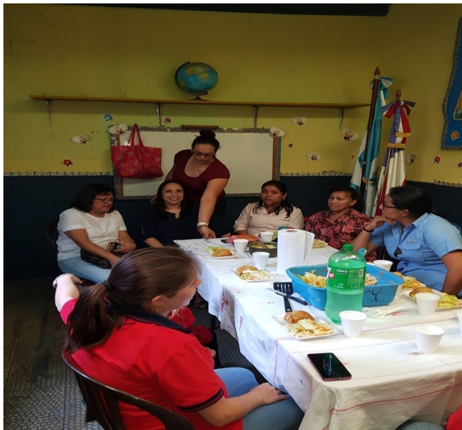
Se les da una refacción después de la capacitación