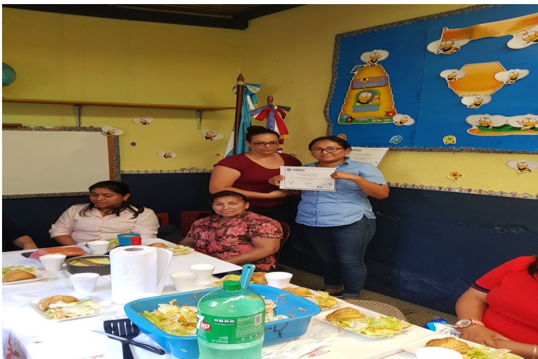
Reunión claustro de maestras despues de la capacitación.