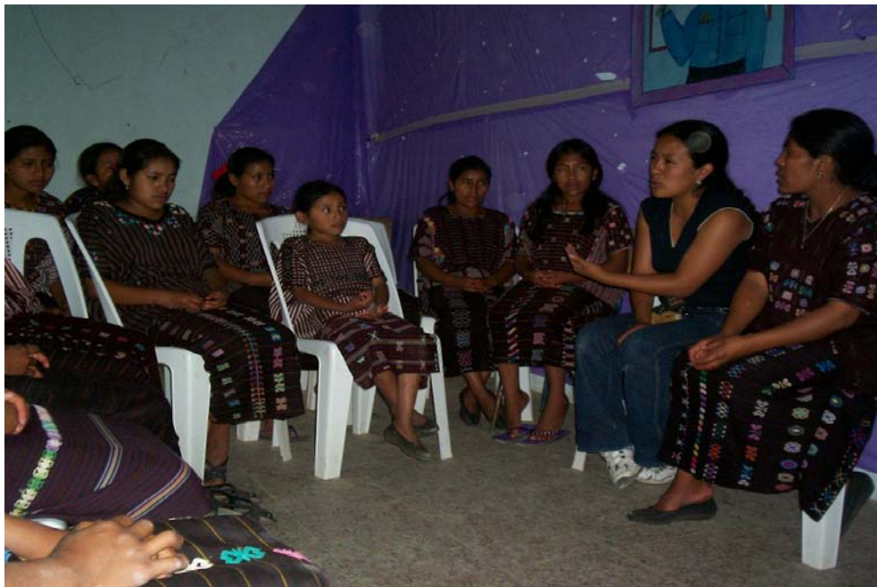
Reunión con grupo de jóvenes, aldea El Granadillo.