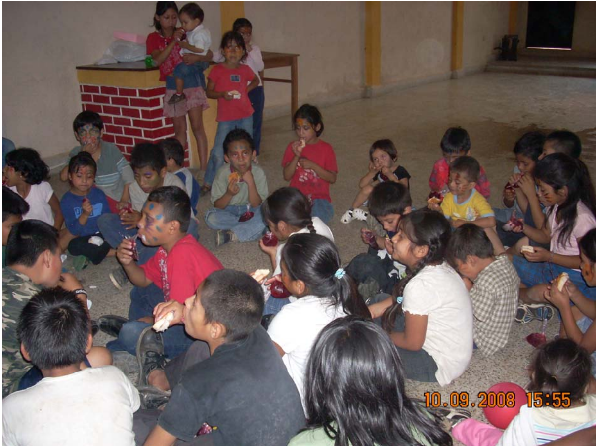
Grupo de niños y niñas afectados por el desbordamiento del Río Las Vacas Iglesia Santa Marta