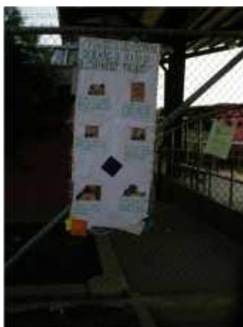
Mural de hábitos de estudio ubicado en la entrada de la preprimaria de la Escuela Nueva Esperanza.