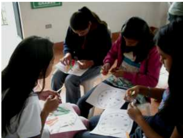
Niñas del Sexto grado realizando su horario de estudio para mejorar su rendimiento estudiantil.