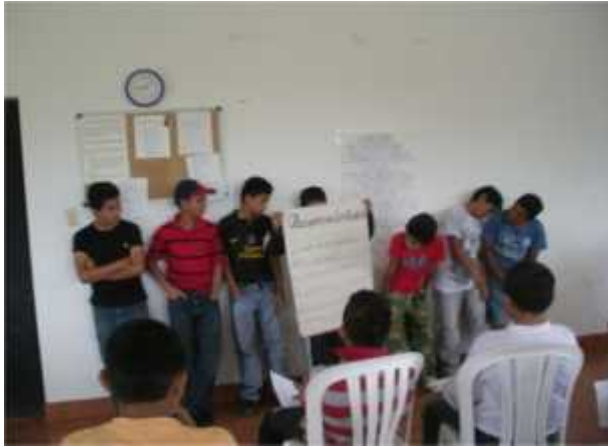
Jóvenes del Sexto Año de Primaria de la Escuela Nueva Esperanza durante su exposición de la Responsabilidad.