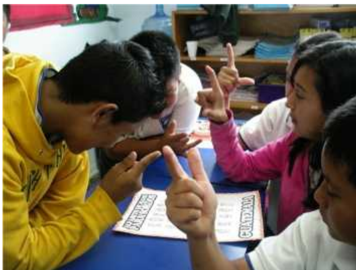
Niños de Sexto grado repasando el abecedario manual del lenguaje de señas.