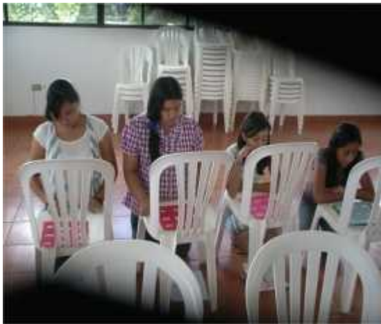
Niñas de Sexto Año de Primaria durante el juego de lotería para fijar conocimiento.