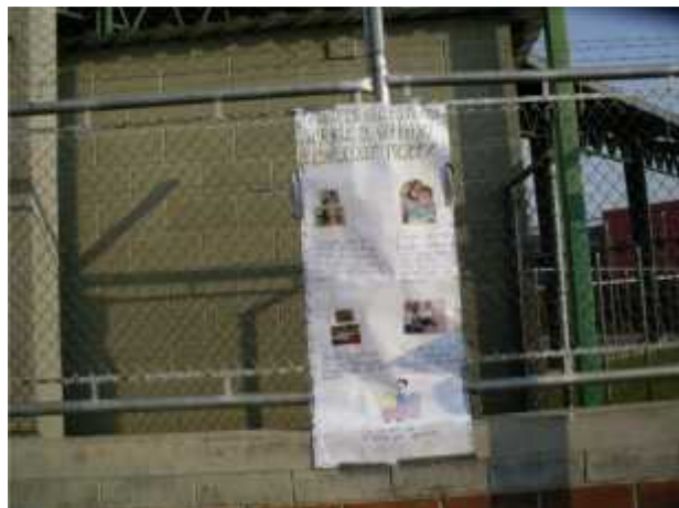
Mural de Hábitos de Estudio ubicado en la entrada de la Primaria de la Escuela Nueva Esperanza.