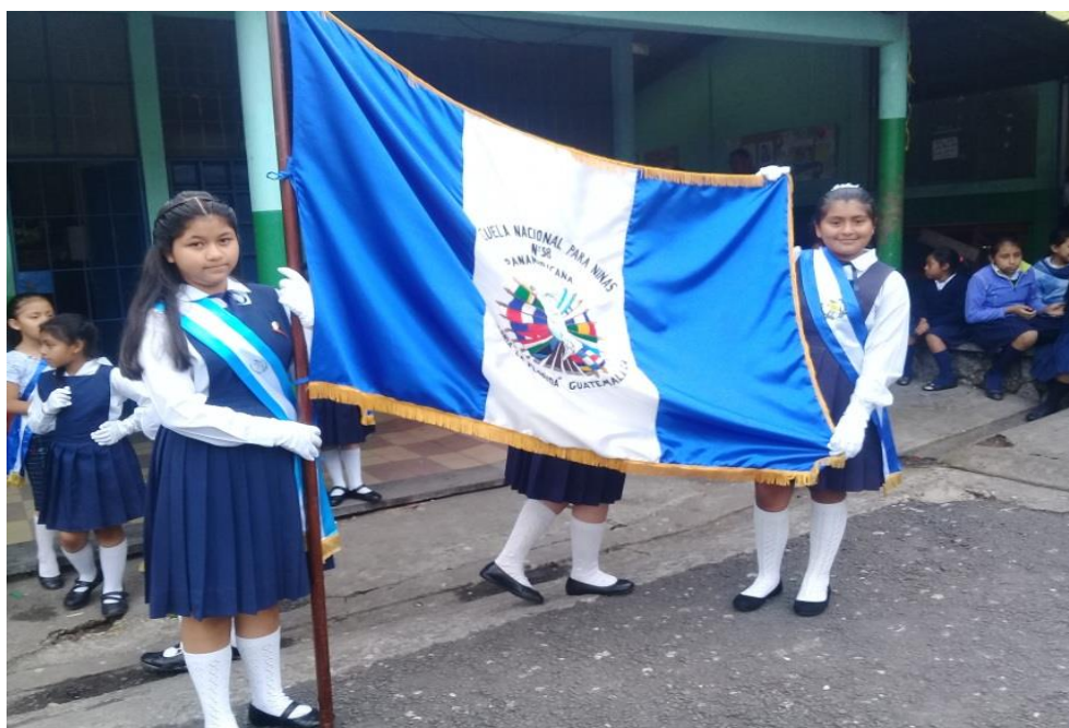
Pabellón de la escuela, en el mismo acto cívico. Junio de 2018.