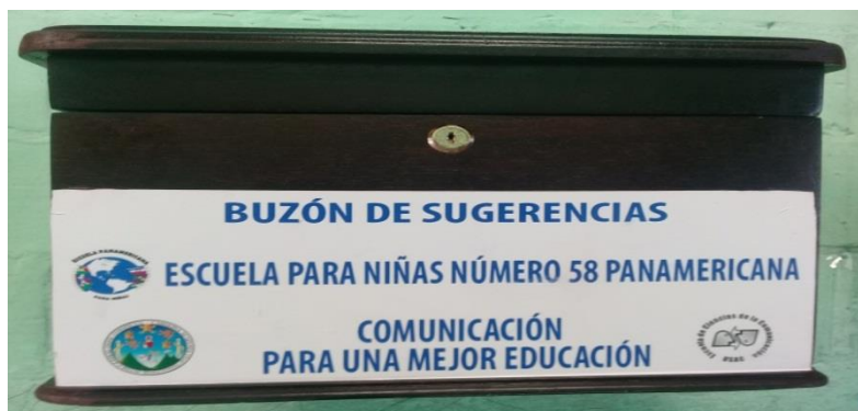
Buzón fabricado con madera de cedro. Junio de 2018.