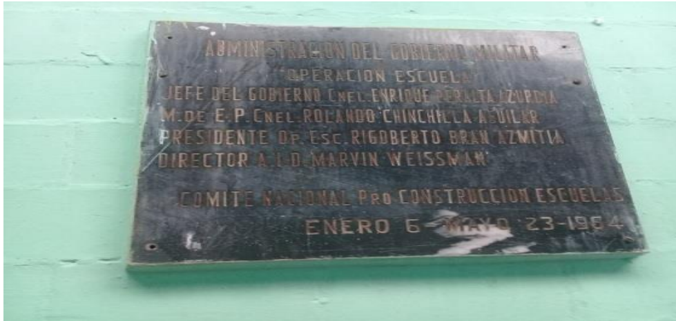
Plaqueta con los datos de fundación de la escuela. Mayo de 2018.