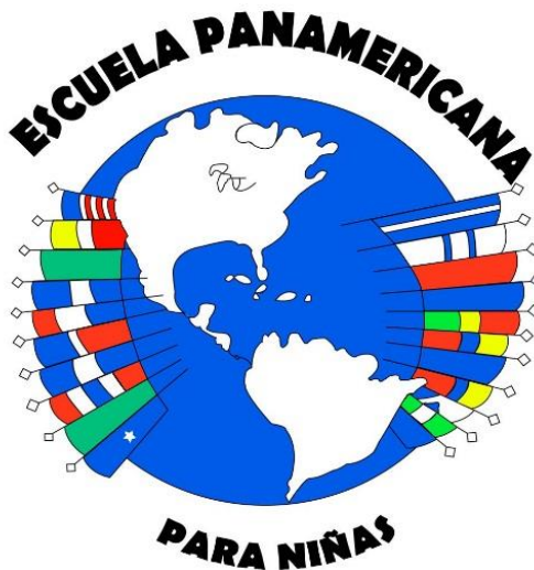
Logotipo escolar grabado en los pines de reconocimiento. Junio de 2018.