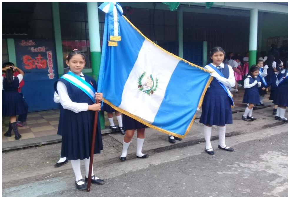
Pabellón Nacional portado por alumnas en el acto cívico de aniversario. Junio de 2018.