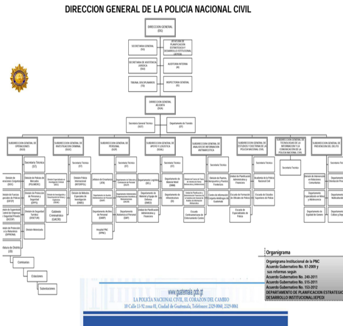
Gráfica 2. Organigrama de la Policía Nacional Civil

A continuación el organigrama de la dirección general de la Policía Nacional Civil