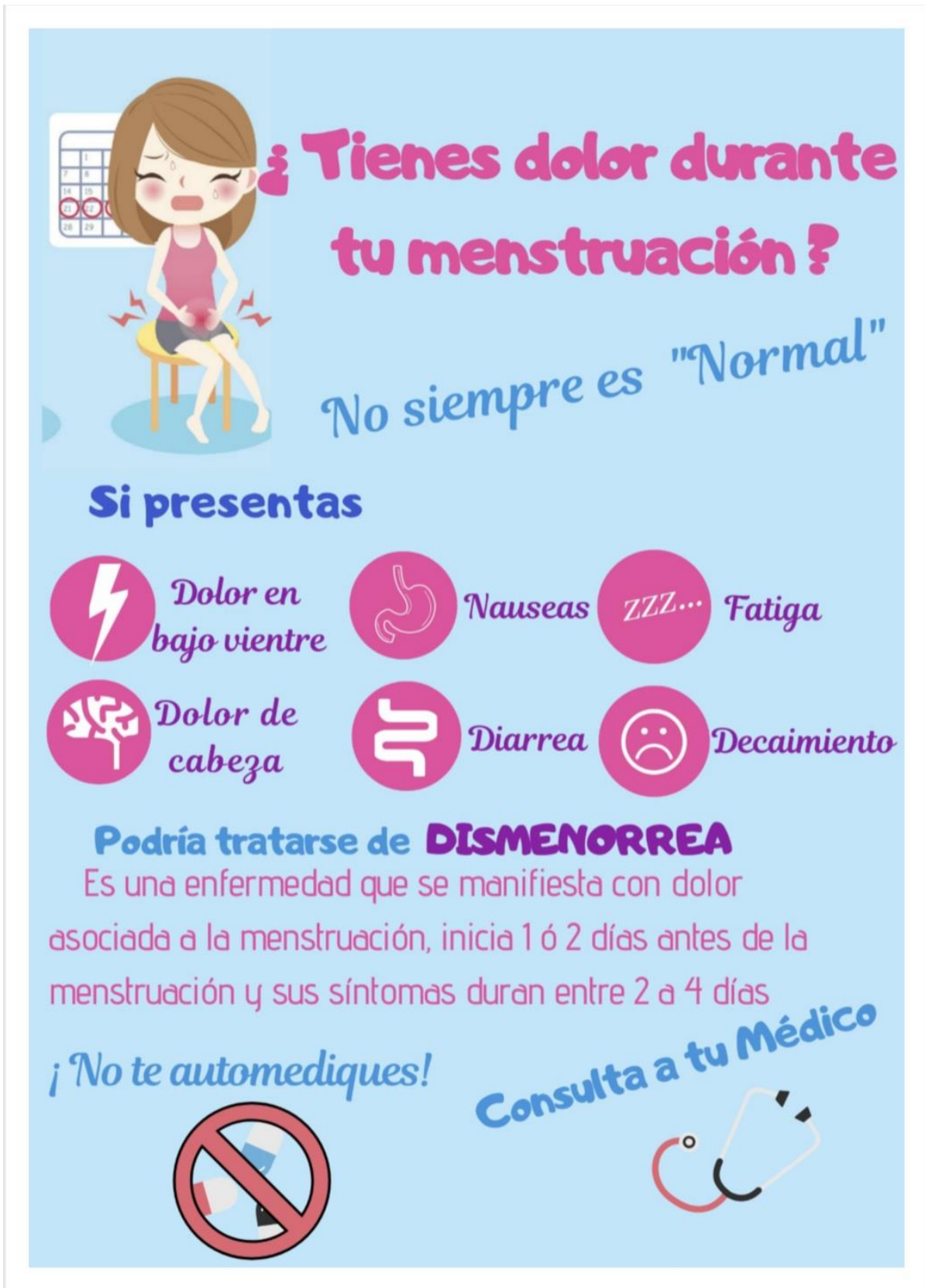
Anexo 11.10: Afiche informativo de promoción en salud femenina