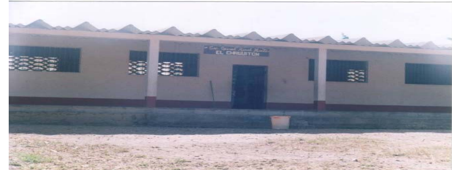
Escuela el Chaguitón , San Luis Jilotepeque. Foto 2003