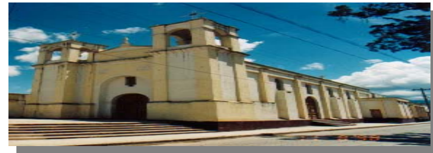
Templo de Carmen, Jalapa

Este mural se encuentra en el escenario al aire libre de la plaza de los Héroes, en la Escuela Tipo Federación "Luis Martínez Mont". En dicho mural sobresalen: Urraca, Lempira, Tecún Umán, Nicarao y Atlacatl. Fue edificado en el año de 1,946. El mural nació con la inauguración del edificio de la Tipo Federación en el año de 1,950, gracias al Gobierno de Juan José Arévalo Bermejo. Se ubica en el Barrio San Francisco