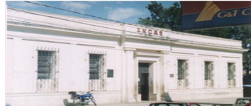
Instituto Normal Centroamericano para Señoritas. Foto 2003