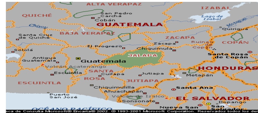
Ubicación geográfica del departamento de Jalapa

la Ruta de el Atlántico se comunica con el Petén, las Verapaces, Izabal, y otros pueblos y por el Sur, mediante la carretera Interamericana se comunica con los departamentos de; Jutiapa, Santa Rosa y con la República de El Salvador. Por el oriente mediante la ruta No. 18 se comunica con el departamento de de Chiquimula, Zacapa y con la República de Honduras. Y por el Occidente, se comunica además de la ciudad Capital con todos los departamentos del altiplano del país. Para la capital guatemalteca hay tres vías: Por la carretera Interamericana vía Jutiapa; por la Ruta de El Atlántico, vía Sanarate; por la ruta No 18 vía Mataquescuintla. De las anteriores vías son las más usadas: Jutiapa y Sanarate. Por la Vía de Mataquescuintla es usada sólo por éste municipio debido a la distancia de aquí para la ciudad capital.