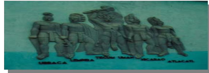
Mural de Héroes Centroamericanos

Este mural se encuentra en el escenario al aire libre de la plaza de los Héroes, en la Escuela Tipo Federación "Luis Martínez Mont". En dicho mural sobresalen: Urraca, Lempira, Tecún Umán, Nicarao y Atlacatl. Fue edificado en el año de 1,946. El mural nació con la inauguración del edificio de la Tipo Federación en el año de 1,950, gracias al Gobierno de Juan José Arévalo Bermejo. Se ubica en el Barrio San Francisco