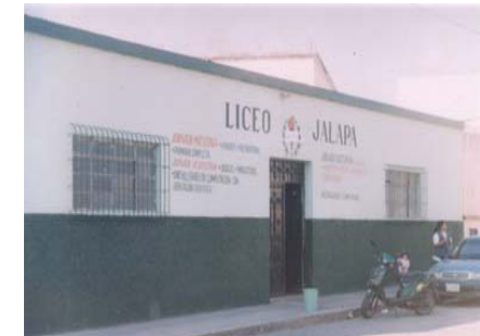
Colegio Particular Mixto Liceo Jalapa. (Colegio Católico)