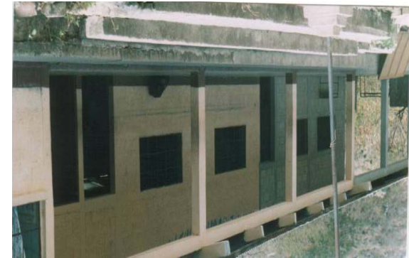
Escuela El Espinal en San Manuel Chaparrón 2003

Se autoriza el funcionamiento de 61 escuelas cubriendo los municipios de Jalapa, San Pedro Pinula, Monjas, San Luis Jilotepeque y Mataquescuintla, contratándose a 91 docentes para atender a 3046 alumnos. Lo que representa el 20% de los Centros Educativos Oficiales del departamento en el nivel primario.