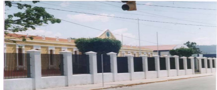
Instalaciones remodeladas del Instituto Centro Americano para Varones. 2003