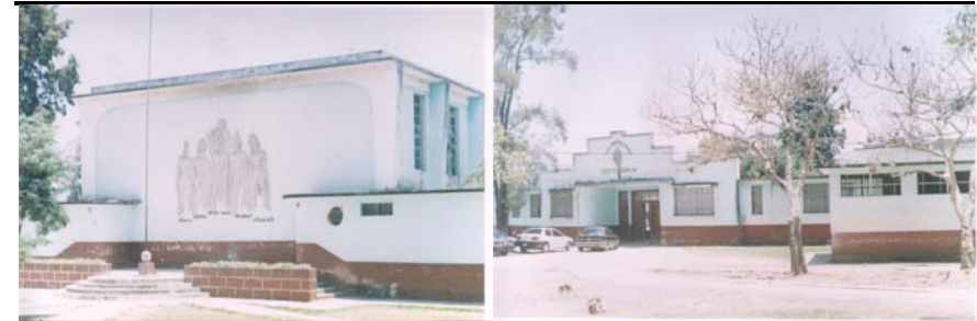
Escuela Tipo Federación.