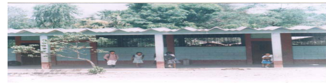
Escuela el Pinalito San Pedro Pinula