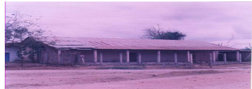
Escuela de Santo Domingo San Pedro Pinula.

Se autoriza el funcionamiento de 61 escuelas cubriendo los municipios de Jalapa, San Pedro Pinula, Monjas, San Luis Jilotepeque y Mataquescuintla, contratándose a 91 docentes para atender a 3046 alumnos. Lo que representa el 20% de los Centros Educativos Oficiales del departamento en el nivel primario.