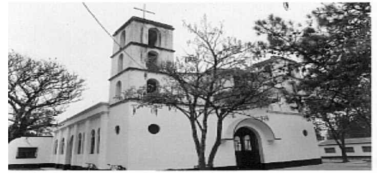
Templo del Sagrado Corazón de Jesús. Ubicado en el Barrio el Porvenir, Jalapa

Jalapa cuenta con algunos monumentos históricos, entre ellos : El templo del Sagrado Corazón de Jesús, Edificio de Tribunales, Concha Acústica, Mural de Héroes Centroamericanos, Templo Minerva, Templo del Carmen, etc.