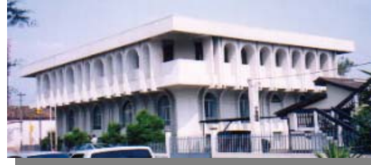
Edificio de Tribunale