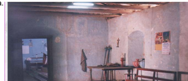
Antigua escuela de San Pedro Pinula, construida a la par de la Iglesia