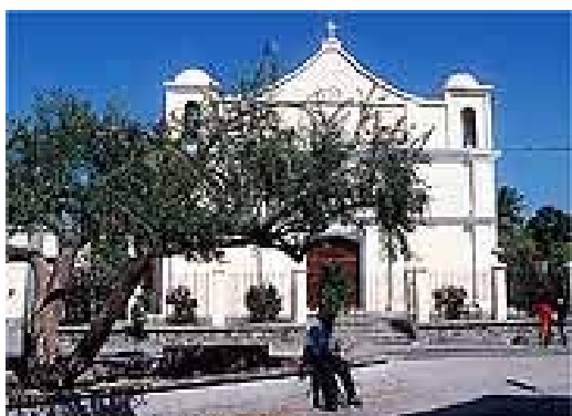
9.6 Iglesia y parque en Sanarate. Fotografía presentada en la revista Conozcamos El Progreso de los fascículos coleccionables Conozcamos Guatemala II del 6 de agosto de 1999.