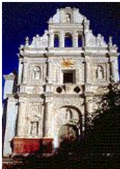
9.1 Frente de la Iglesia de San Agustín Acasaguastlán. Una de las más antiguas de la región. Fotografía presentada en la revista Conozcamos El Progreso de los fascículos coleccionables Conozcamos Guatemala II del 6 de agosto de 1999.