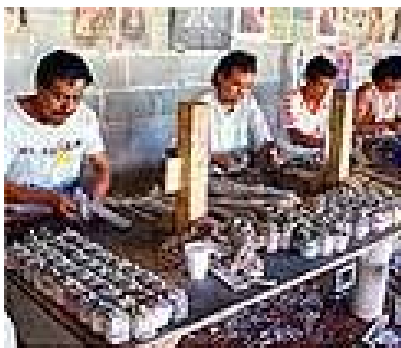
9.3 Elaboración de juegos pirotécnicos en Sansare. . Fotografía presentada en la revista Conozcamos El Progreso de los fascículos coleccionables Conozcamos Guatemala II del 6 de agosto de 1999.