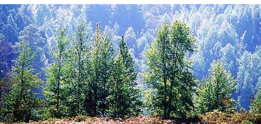
9.4 Vegetación en la Sierra de las Minas, aldea Albores, en San Agustín Acasaguastlán. Fotografía presentada en la revista Conozcamos El