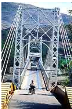
9.5 Puente Orellana sobre el Río Motagua, entrada a El Rancho. . Fotografías presentadas en la revista Conozcamos El Progreso de los fascículos coleccionables Conozcamos Guatemala II del 6 de agosto de 1999.

Progreso de los fascículos coleccionables Conozcamos Guatemala II del 6 de agosto de 1999.