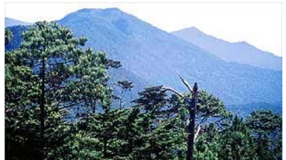
9.2 Panorámica de la Sierra de las Minas, desde la cumbre del cerro El Pinalón. Fotografía presentada en la revista Conozcamos El Progreso de los fascículos coleccionables Conozcamos Guatemala II del 6 de agosto de 1999.