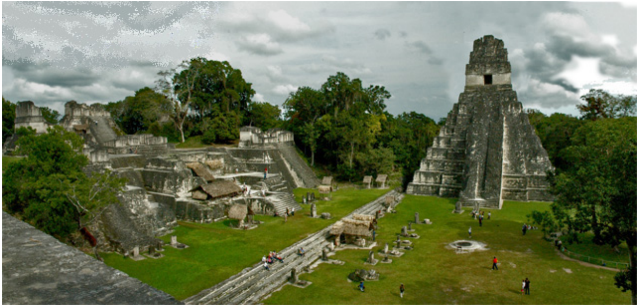
PANORÁMICA DE LA GRAN PLAZA DE TIKAL

religiosos de estuco pintado o piedra tallada. En su alrededor se aglomeran 350 templos menores. Dentro de los templos más grandes se encontraron restos de otras edificaciones anteriores, unas superpuestas encima de otras y cada una más antigua que la superior.