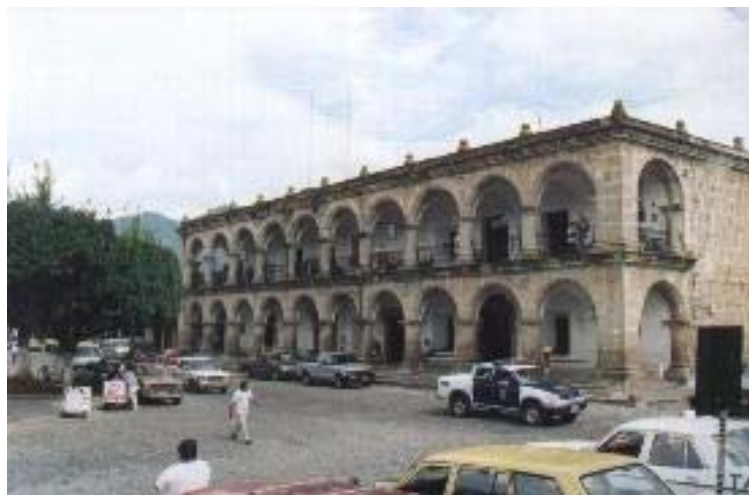
CATEDRAL DE ANTIGUA Y AYUNTAMIENTO