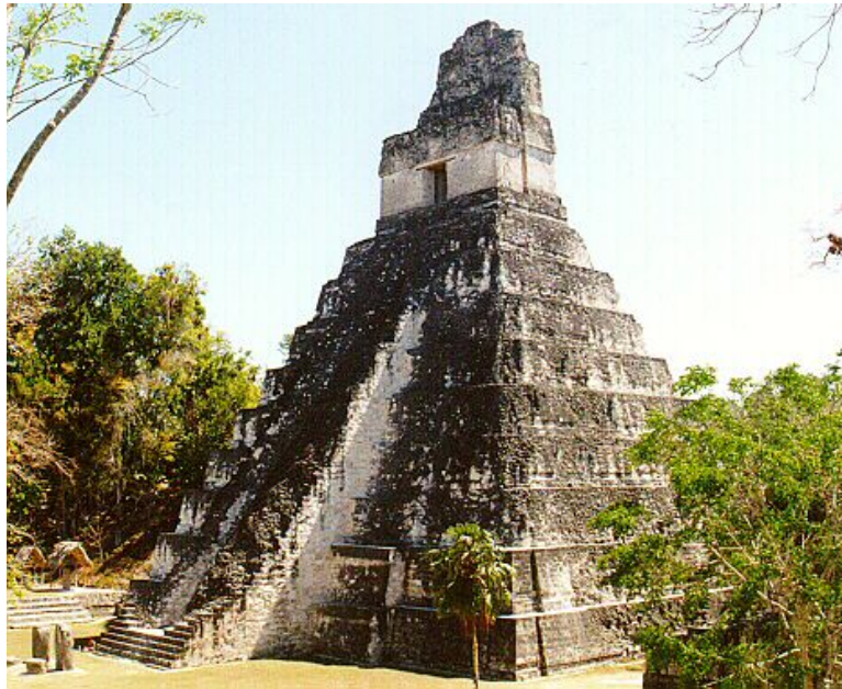
TEMPLO DEL GRAN JAGUAR