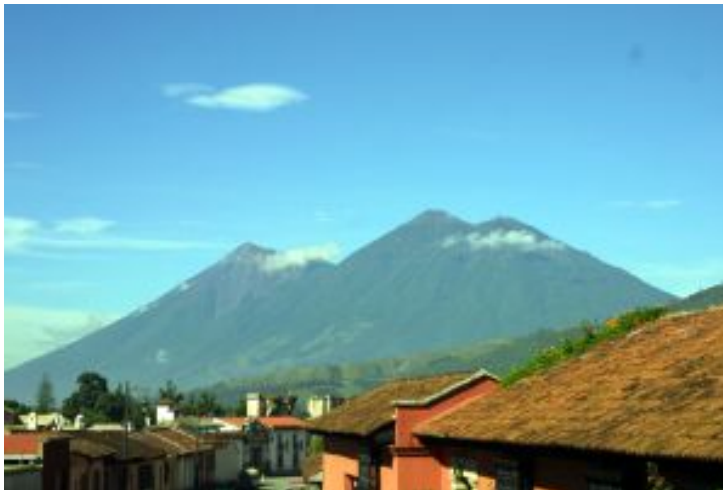
LOS VOLCANES DE FUEGO Y ACATENANGO