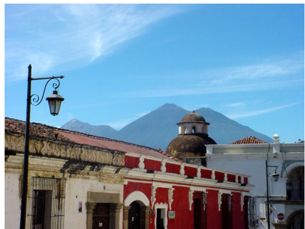
CHIMENEAS DE SANTIAGO DE GUATEMALA