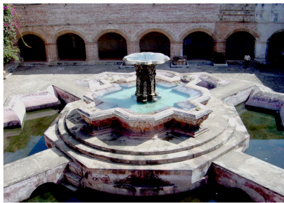
FUENTE DE LA MERCED

(fuente:www.guate360.com) (fuente:www.pbase.com)