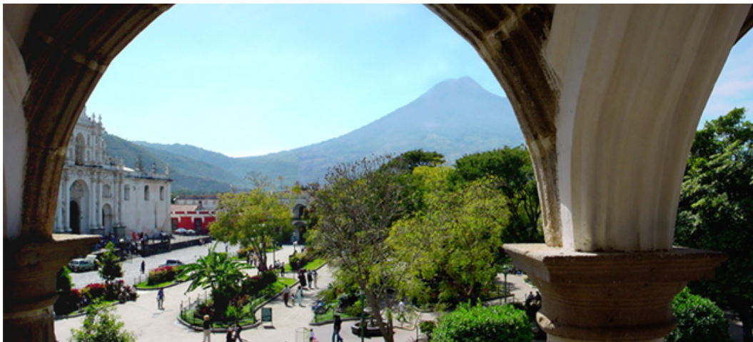
VISTA DESDE EL AYUNTAMIENTO, A LA IZQUIERDA LA CATEDRAL

Durante la Colonia la muy Noble Ciudad de Santiago de los Caballeros de Goathemala, hoy La Antigua Guatemala, evidenció un gran aporte en la arquitectura barroca de la época a través del uso de determinados elementos estructurales, fachadistas y decorativos, que a pesar de estar influenciados directamente por España se creó un arquetipo colonial y varias obras maestras: los portales y arcadas como el de la Capitanía General, la iglesia La Merced, conventos como el de Capuchinas, son sólo algunos ejemplos que contienen elementos propios de esta arquitectura colonial guatemalteca: arcos mixtilíneos, fuentes y búcaros como remates de las calles, ventanas talladas en esquina, fachadas masivas de gran complejidad y superposición de elementos en las iglesias sobre todo con maestría en el uso del estuco, son elementos que predominaron de tal forma que a esta ciudad le valió ser merecedora de ser considerada como Patrimonio Cultural de la Humanidad.