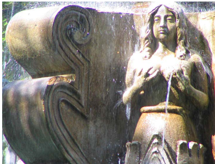
DETALLE DE LA FUENTE DE LAS SIRENAS obra de Diego de Porras EN LA PLAZA MAYOR DE LA ANTIGUA GUATEMALA

La construcción de fuentes fue una de las características muy particulares de Santiago, tanto en casas, como en edificaciones públicas o eclesiásticas, desde época temprana. En el caso de las residencias se colocaban en el centro del primer patio, con recipientes o tazones de estuco o piedra, en los patios menores iban adosadas al muro, probable tendencia renacentista o manierista italiana; consistían en un medio tazón de cantera o estuco, que recibían el agua de una parte más alta y que tenían figuras diversas: imágenes de santos, animales o decoraciones florales, desde ese tiempo fueron conocidas como búcaros, hasta la actualidad. Las fuentes públicas eran para denotar una plaza o jardín específico. Algunas de gran belleza y otras de grandes proporciones, como la Fuente de las Sirenas en la Plaza Central y la Fuente de La Merced o Capuchinas, respectivamente. En las casas también era frecuente encontrar búcaros en los jardines y patios interiores, algunos de gran belleza y con decoración barroca.