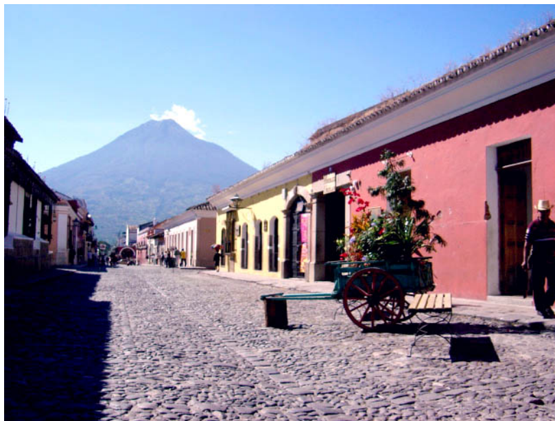
CALLE DE LA ANTIGUA GUATEMALA

Su importancia en América quedó demarcada como: Audiencia de los Confines o Capitanía General de Guatemala y se establecía su capital en Santiago. Para consolidar ese rango, Felipe II le dio el título de «Muy Noble y Muy Leal Ciudad de Santiago de los Caballeros de Guatemala», el 10 de junio de 1566. Poco después, el 14 de octubre de ese mismo año, la custodia de la provincia de Guatemala de la Orden de San Francisco elevó su jerarquía y adquirió el nombre de «Provincia del Santísimo Nombre de Jesús de Guatemala. Concibiendo un nuevo rango institucional gracias a los oficios de fray Bartolomé de las Casas y del Ayuntamiento, el 21 de diciembre se restableció la Real Audiencia en Santiago. (José Joaquín Pardo, Efemérides de la Antigua Guatemala 1541-1779 , Consejo Nacional para la Protección de la Antigua Guatemala, 1984, p. 12.)