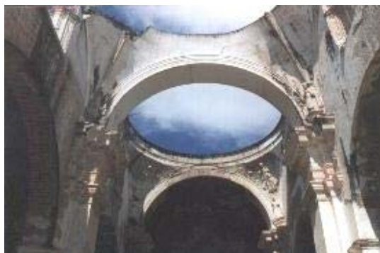
ARCOS Y CÚPULAS DE LA CATEDRAL

Con Joseph de Porres, se inicia una “dinastía” que dominó la historia de la arquitectura en la ciudad durante la primera mitad del siglo siguiente, ya que su hijo Diego participó en los primeros edificios de Santiago. Joseph(1635-1703), fue el primer Arquitecto Mayor de Santiago, designado en 1687, un año después de finalizar la Catedral. En el expediente de su nombramiento se conserva el impresionante listado de sus obras: primero la iglesia de San Pedro, aún bajo la dirección de su maestro Juan Pascual, a quien sustituyó a su fallecimiento; luego continuó además de la Catedral, Nuestra Señora de Belem, La Compañía de Jesús, San Francisco, Santa Teresa y el Palacio Arzobispal.