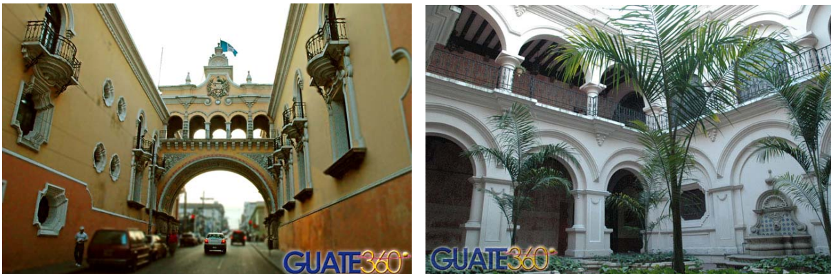
EDIFICIO DE LA DIRECCIÓN CENTRAL DE CORREOS VISTA DEL ARCO E INTERIOR DEL EDIFICIO

La arquitectura fue escenográfica, con una confusión de forma y contenido. La búsqueda de algo propio, producto de las influencias mencionadas, condujo al uso de un lenguaje neocolonial, en las construcciones. Corresponden a dicha corriente edificios como el Palacio Nacional, la Dirección Central de Correos, la Policía Nacional y la antigua terminal aérea, en donde quizás se muestra la mejor expresión nacional de este estilo. Durante esta época se inició la introducción del modernismo en sus diversas manifestaciones internacionales. Teniendo ejemplos en los edificios de Sanidad Pública, la Aduana Central, el Banco Nohtebohn de Roberto Hoegg. En ellos es evidente la ausencia de decoración, ya que se limitan a una geometría de mucha fuerza, el uso de planos negativos y masa, en un estricto balance formal, que es reminiscencia del art-deco . El Hospital Roosevelt presentó otra faceta hacia la consolidación del modernismo a través de corrientes internacionales y planos importados.