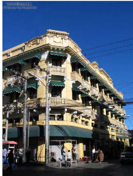
HOTEL ROYAL PALACE

A partir de 1940 la Capital entró en una fase de expansión que continuó durante las siguientes décadas, fruto de la migración de las provincias, que debido a varios fenómenos, primero de orden económico y luego de orden social, se asentaron en nuevos sectores del Valle de La Virgen. La población creció de 248,276 habitantes en 1950; a 572,671 en 1964, y para 1973 se contaba con 700,500 personas en la ciudad y sus municipios vecinos.