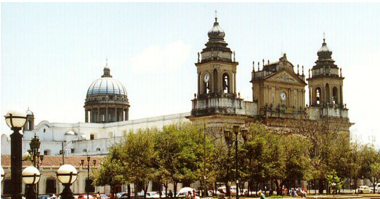
PALACIO ARZOBISPAL Y CATEDRAL METROPOLITANA