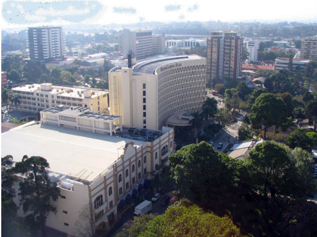
VISTA DE LA ZONA VIVA. CIUDAD DE GUATEMALA

En el resto de la República se inicia un despertar hacia la incorporación de servicios urbanos y facilidades de orden comercial, gracias al desarrollo vial y la descentralización de los medios de producción, lo que paulatinamente permitirá su crecimiento urbanístico y mejoramiento en la calidad de vida de sus ocupantes.