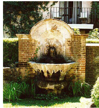
DETALLE DE BÚCARO