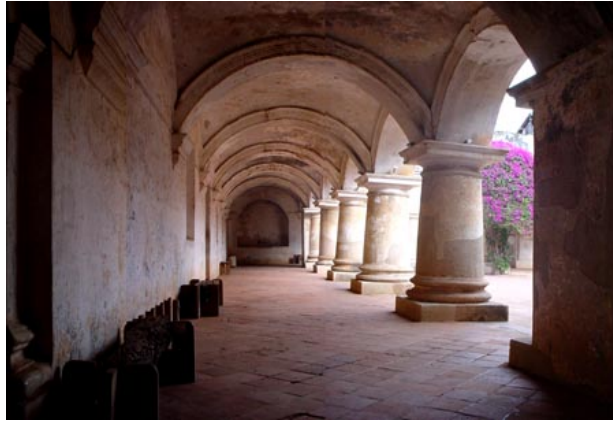
VISTA DE UN CORREDOR LATERAL DE “LAS CAPUCHINAS”