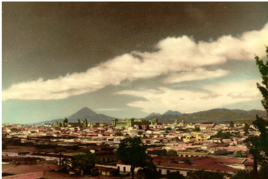
VISTA DE LA CIUDAD DE GUATEMALA EN 1940

El crecimiento hacia el Sur se dio en los barrios de Tívoli y Santa Clara (actuales zonas 9 y 10) y, hacia el poniente, en La Palmita y la Barranquilla en donde después se ubicarían la Ciudad de los Deportes y el Centro Cívico, respectivamente. La remodelación de la 18 calle, en 1945, y principalmente de la iglesia de El Calvario, contribuyó a crear una conexión más fluida hacia el sur de la ciudad, que influyó en su urbanización. Durante los siguientes años surgió una preocupación en la ciudad por encontrar las raíces arquitectónicas, lo cual se tradujo en la incorporación de revivals propios. Uno fue el neocolonial con variantes de lo hispánico a lo californiano, en el que se incorporaron obras con reminiscencias de cultos folclóricos, acentuando más la confusión. El otro fue una limitada expresión del estilo maya, que había alcanzado popularidad en Estados Unidos durante la década de 1920 a 1930, y que se inició en 1908 con el edificio de la Organización de los Estados Americanos. En Guatemala se llamó primero Colonial Moderno, y fue copiado sobre todo de revistas estadounidenses y utilizado por constructores improvisados, maestros de obra, que en la mayoría de los casos se limitaban al aspecto formal (fachadismo).