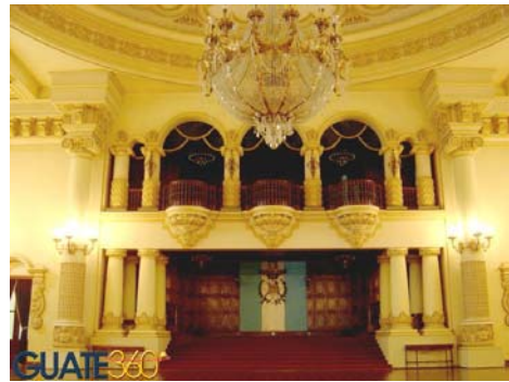
VISTA INTERIOR SALÓN DE RECEPCIONES