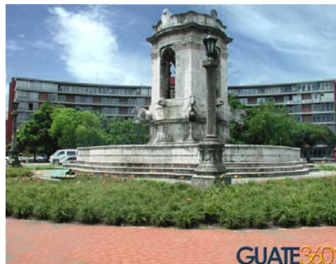
FUENTE CARLOS V EN LA PLAZUELA ESPAÑA

A partir de la década de los noventa, la ciudad de Guatemala experimenta un acelerado desarrollo económico, probablemente por encaminarnos cada vez más a una plena vida democrática y búsqueda de un proceso de paz interna. Esto hace que el desarrollo humano se plasme a través de la construcción de nuevas obras que benefician el desarrollo de muchos miles de habitantes, es un hecho real que la infraestructura tiene que crecer a la par del desarrollo comercial o residencial de los distintos sectores habitacionales.