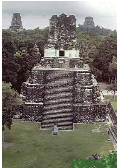
TEMPLO II. AL FONDO LOS TEMPLOS VI Y IV

Finalmente es preciso indicar que el aporte maya a la arquitectura y a la cultura en general, aún no se ha dimensionado en toda su extensión y gracias al interés de organizaciones no gubernamentales, instituciones universitarias y sociedades culturales, éste esfuerzo, sigue explorando y descubriendo nuevos sitios y estructuras que antes habían permanecido ocultas no sólo para evitar el saqueo, que tanto daño ha hecho al patrimonio, sino por la falta de fondos que nuevamente posibiliten redescubrir ese magnífico legado para la cultura universal, que representó la concentración humana más grande del nuevo continente y que fue superada únicamente hasta muchos siglos después de la conquista y la llegada de miles de inmigrantes de Europa y luego de África y Asia, al Nuevo Continente.