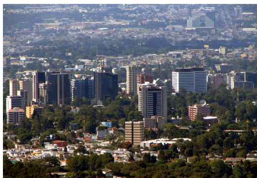
VISTA ACTUAL DE LA CIUDAD

Aún se tiene tiempo para meditar sobre la conceptualización o creación de un espíritu arquitectónico guatemalteco genuino, que de forma a un cuerpo urbano particular, con una personalidad y un nombre propio en el contexto mundial de las naciones, este reto continua presente y debe ser motivo para continuar analizando, reinterpretando y seguir estudiando la Arquitectura de Guatemala en sus valores patrimoniales.