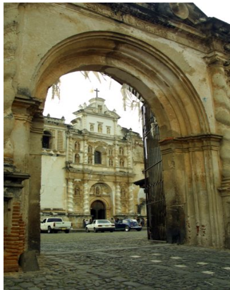
PERFIL AMURALLADO DE LA IGLESIA DE SAN FRANCISCO

En cuanto a la arquitectura civil o doméstica, fue durante esta época y hasta finales del siglo XVII, se crearon los tipos básicos de casas de habitación, tanto en el área rural como en la urbana. En la ciudad y debido al problema sísmico, las residencias eran de una sola planta y siguiendo el prototipo de 2 y 3 patios; según su importancia. En el primer patio se accedía por medio de un zaguán y al centro de éste se encontraba generalmente una fuente rodeada de jardines y bancas con esculturas, en el caso de las más lujosas, en su alrededor se encontraban los espacios principales como la sala de recibimiento, las habitaciones a los lados y al fondo el comedor, cerca de la cocina. En el segundo patio se ubicaban habitaciones de menor importancia y servicio. Al final se encontraba el área para los animales domésticos y bestias, generalmente tenían su ingreso aparte. Cuando las casas eran de esquina, el salón principal se ubicaba en ésta, con un balcón o ventana de esquina y una columna en el ángulo. Si existía algún comercio, había puertas de esquina.