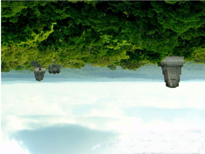
VISTA EN PRIMER PLANO DEL TEMPLO VI, AL FONDO LOS TEMPLOS I Y II.