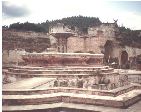
FUENTE DE LAS CAPUCHINAS