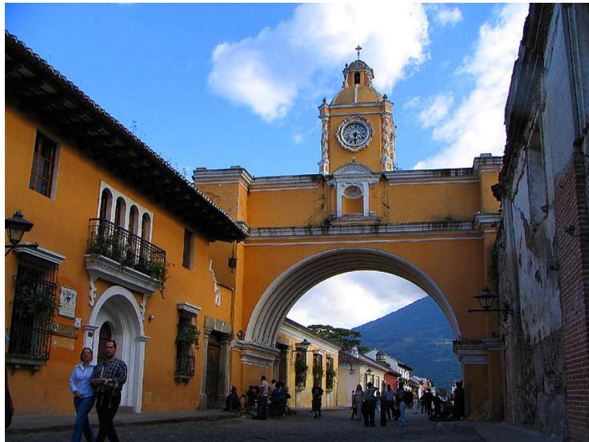
ARCO DE SANTA CATALINA

Situado en una de las vías principales de La Antigua, la Calle del Arco, el templo se inauguró en el año 1647, en 1694 se concluye la construcción del Arco, que comunicaba el convento con la huerta y los jardines. El Arco de Santa Catalina se ha convertido en un símbolo iconográfico y emblema de la ciudad, por sus proporciones y el templete con cúpula, que dan cabida a uno de los primeros relojes de la colonia.