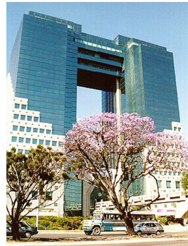
LA NUEVA ARQUITECTURA DE GUATEMALA EDIFICIOS SCI, BANCO INTERNACIONAL Y TIKAL FUTURA

La renovación urbana también ha despertado por conservar, restaurar y revitalizar antiguas casas coloniales del antiguo casco urbano de la ciudad en la zona 1, así como en la ciudad de La Antigua. Lamentablemente algunas veces no se realizan los estudios históricos del caso y se pierden valiosos elementos de la obra original, el caso del Centro Comercial El Cazador ejemplifica esta situación. Sin embargo, existen buenos ejemplos como el restaurante Mcdonal's ubicado frente al antiguo Parque Concordia, en la zona 1 o el hotel Casa Santo Domingo, en la ciudad colonial.