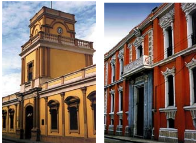
EL NEOCLÁSICO EN GUATEMALA Vistas de las fachadas del Instituto Central para Varones y Museo de Historia en la Zona 1.

En 1925 se edifican la Escuela de Farmacia y la Escuela de Medicina (actual Paraninfo Universitario), con tendencias tardías renacentistas y neoclásicas, fruto del diseño de arquitectos educados en Europa. Aunque también las tendencias eclécticas aparecieron por doquier se inicia la conversión hacia la adaptación de estilos foráneos, como rompimiento con los patrones neoclásicos.