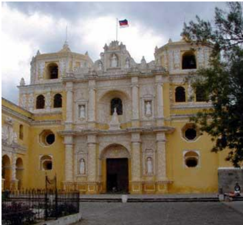
FACHADA PRINCIPAL DE LA MERCED

La portada de acceso al convento está enmarcada por columnas salomónicas y su puerta de madera es una las pocas tallas originales que se conservan en la ciudad. En el patio central se encuentra la fuente de más grandes dimensiones en La Antigua Guatemala, decorada ricamente con ángeles y elementos vegetales. (Arquitectura Antiguaña. . mayo-junio 1997. p.14-18)