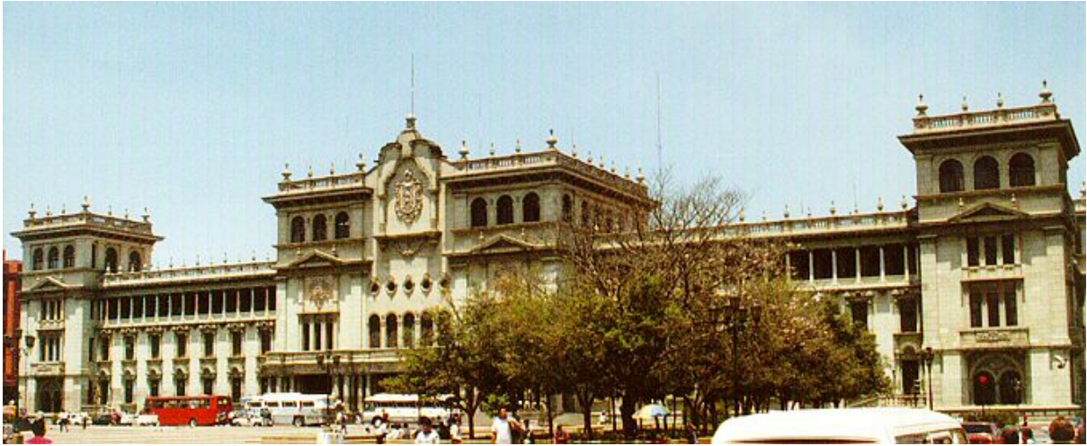
PALACIO NACIONAL DE LA CULTURA