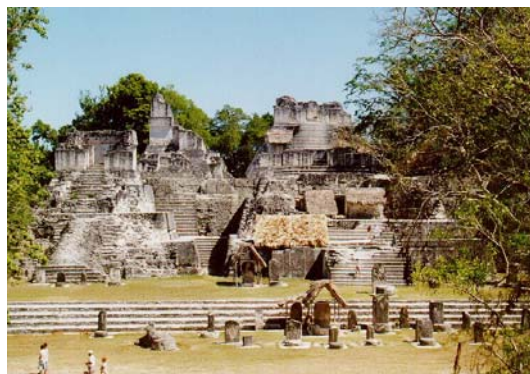
PALACIOS DE LA ACRÓPOLIS

En las ceremonias públicas que se realizaban en las plazas, plataformas ceremoniales se realizaban misteriosos ritos en derredor de palacios y estructuras de importancia. En términos más generales, Gerhart T. Kramer (Roof Combs in the Maya Area; an introductory Study. Maya Research, Vol. II, No. 2, New York, April 1935), considera las siguientes conceptualizaciones respecto de la arquitectura maya; muy adecuada la aproximación a cualquier unidad cultural desde el ángulo de su arquitectura, porque ésta cambia lentamente, marcando el proceso de su desarrollo. “El edificio en construcción –dice- aprovecha práctica y estéticamente del progreso hecho desde la concepción de la estructura; además corrige los diseños que no han tenido buen éxito en construcciones anteriores”. Cabe recordar que los antiguos constructores mayas tenían la tendencia de superponer una nueva estructura, sobre una anterior, ya sea para exaltar la grandeza de un nuevo gobernante o bien remodelar el templo-pirámide anterior. (Vela. P.111)