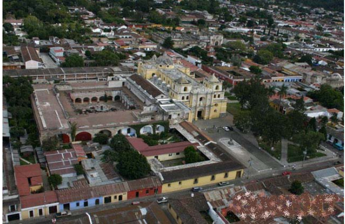
VISTA DEL CONJUNTO CONVENTUAL