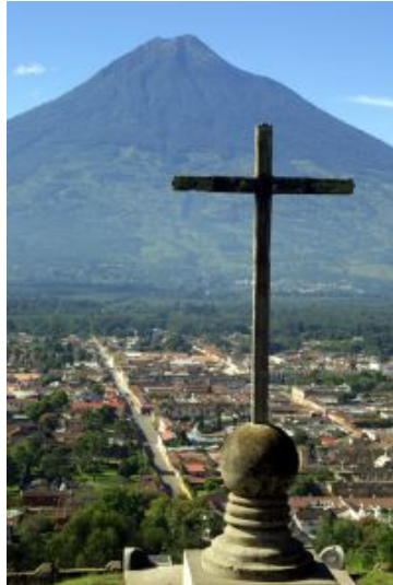
EL VOLCÁN DE AGUA VISTO DESDE EL CERRO DE LA CRUZ