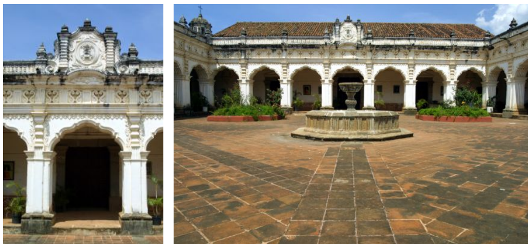
ARCOS MIXTILÍNEOS Y PATIO DE LA UNIVERSIDAD SAN CARLOS

En el Altar Mayor existía una cúpula cuyas pechinas aún conservan hermosas figuras de ángeles turiferarios, realizadas en estuco, las que están sobre las figuras de los cuatro Evangelistas. En los capiteles de los pilares y en las cornisas del edificio se conservan finas decoraciones con estuco que están en las bóvedas y las ventanas, probablemente toda esa yesería estuvo policromada influyendo sobre otras decoraciones de iglesias de la ciudad. Como era de esperarse la fachada catedralicia ejerció una gran influencia en la arquitectura de Santiago y en todo el Reino, como se aprecia en las fachadas de la Compañía de Jesús, Santa Teresa, San Francisco y la Catedral de Ciudad Real, en Chiapas.