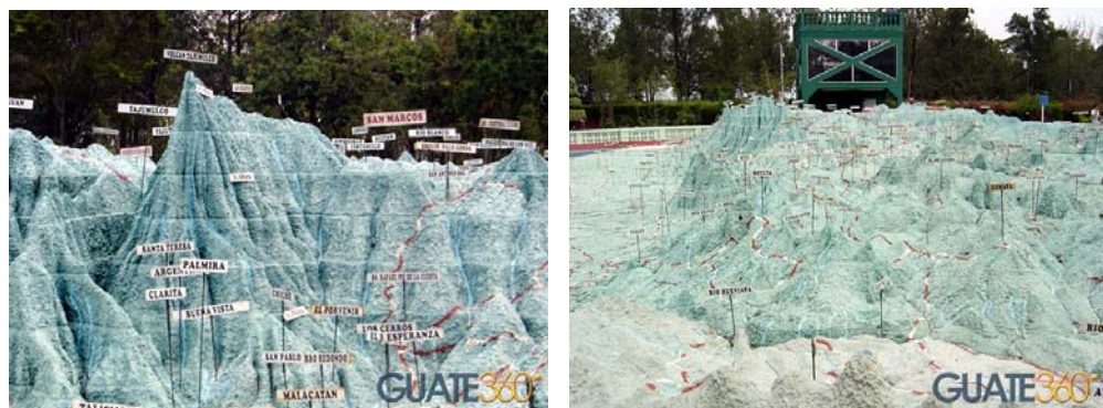
MAPA EN RELIEVE AL FINAL DE LA AV. SIMEÓN CAÑAS. ZONA 02

A raíz del triunfo militar contra El Salvador, en 1863, se construyó la Plaza de la Victoria, conocida como Concordia y luego Enrique Gómez Carrillo, en el sector sur-meridional del cantón central. Después de la muerte de Rafael Carrera, el 14 de abril de 1865, se designó al mariscal Vicente Cerna al gobierno del país, quien ordenó construir el Mercado Central, atrás de la Catedral, reordenando el comercio de la Plaza Mayor. El 30 de junio de 1871, se da la Revolución Liberal, comandada por Miguel García Granados y Justo Rufino Barrios, trayendo consigo nuevos cambios al sistema urbano de la ciudad y del país: se introdujo el ferrocarril, se trazó la 7ª. Avenida y el bulevar 30 de Junio (hoy avenida La Reforma) que definió el crecimiento de la urbe hacia el Sur, con monumentos, parques y barrios residenciales al estilo parisino. Se calcula que la ciudad era habitada por aproximadamente 72 mil personas. En 1879 se construyó el hipódromo cerca del pueblo de Jocotenango (zona 2, actual). Y en a principios del nuevo siglo, se le incorporaron el Templo a Minerva y el Mapa en Relieve a instancias del gobierno de Rafael Carrera.