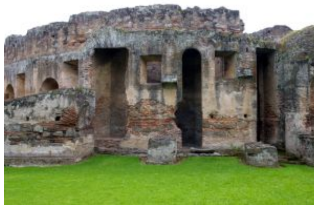
CONVENTO DE CAPUCHINAS área de celibato

Las cruces de atrio fue otro elemento arquitectónico que aparece profusamente en la arquitectura antiguena, incluso servían para determinar nodos de calle o remates de solares en la ciudad.