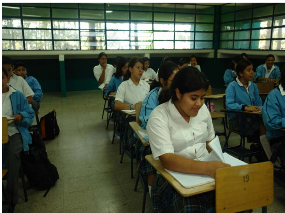
Grupo de alumnos escuchando instrucciones para responder instrumentos

Basados en lo anterior se procede a pasar los instrumentos.