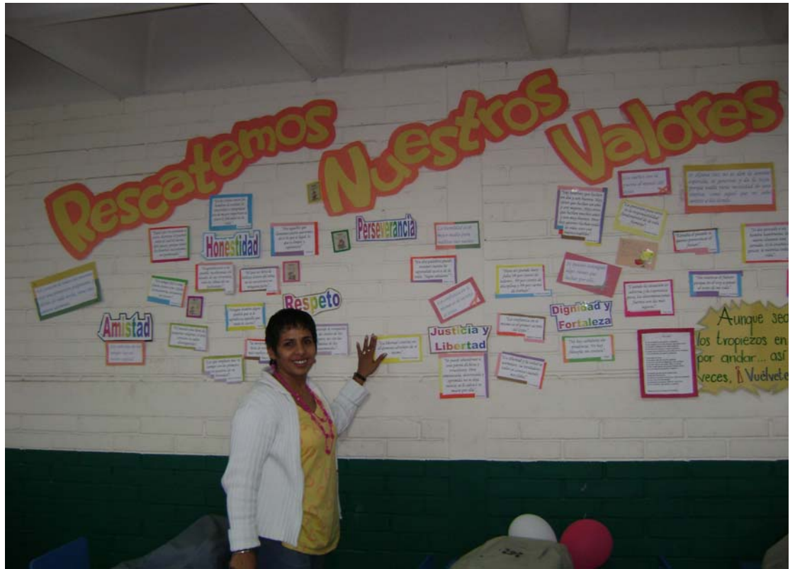
Trabajo en aula desarrollado por maestra y alumnos