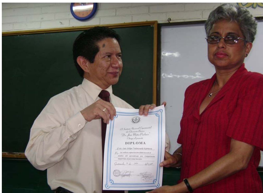
Diploma, posterior a la implementación, entregado al investigador por parte del instituto