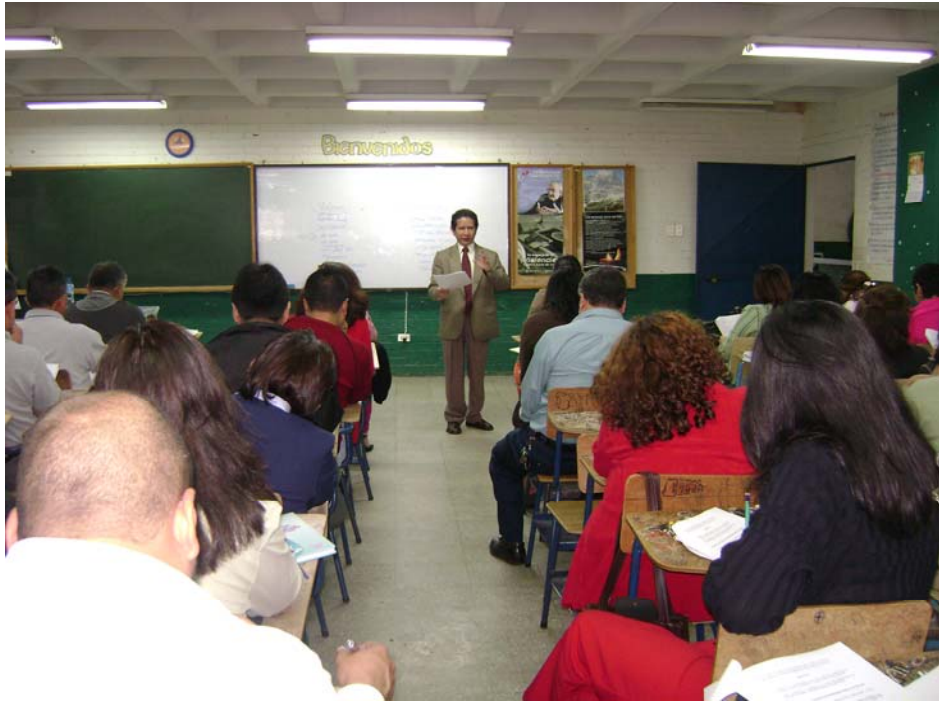
Inducción a maestros