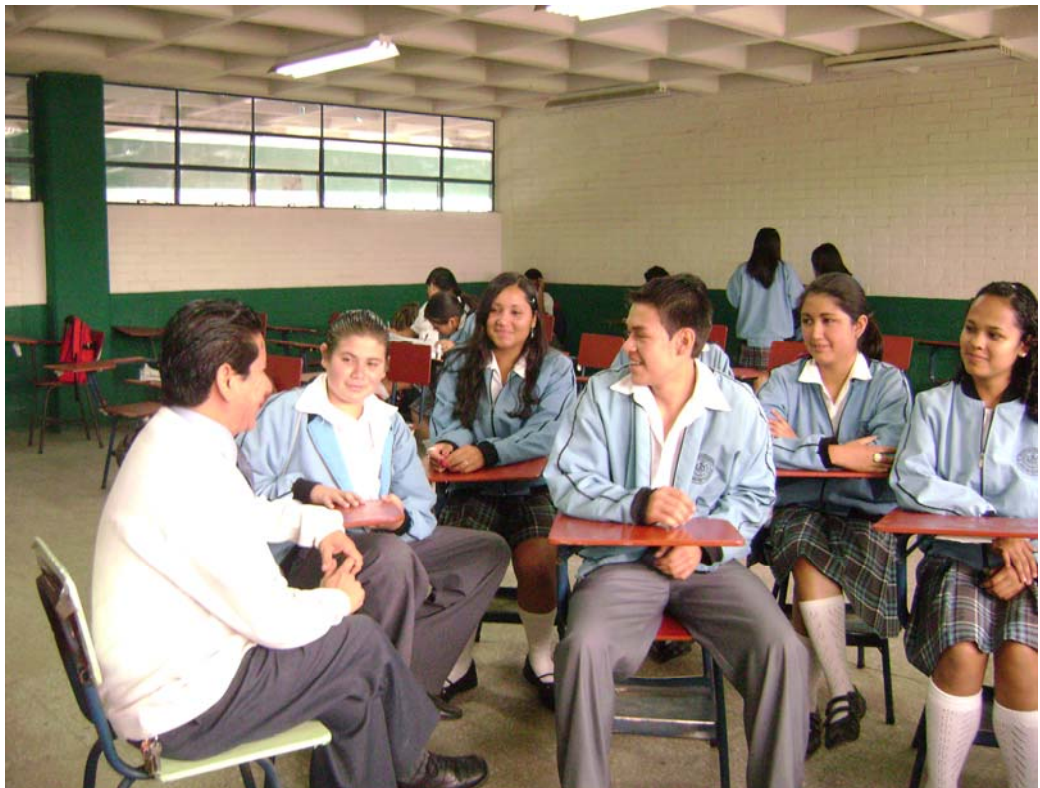
Con alumnos y alumnas del instituto