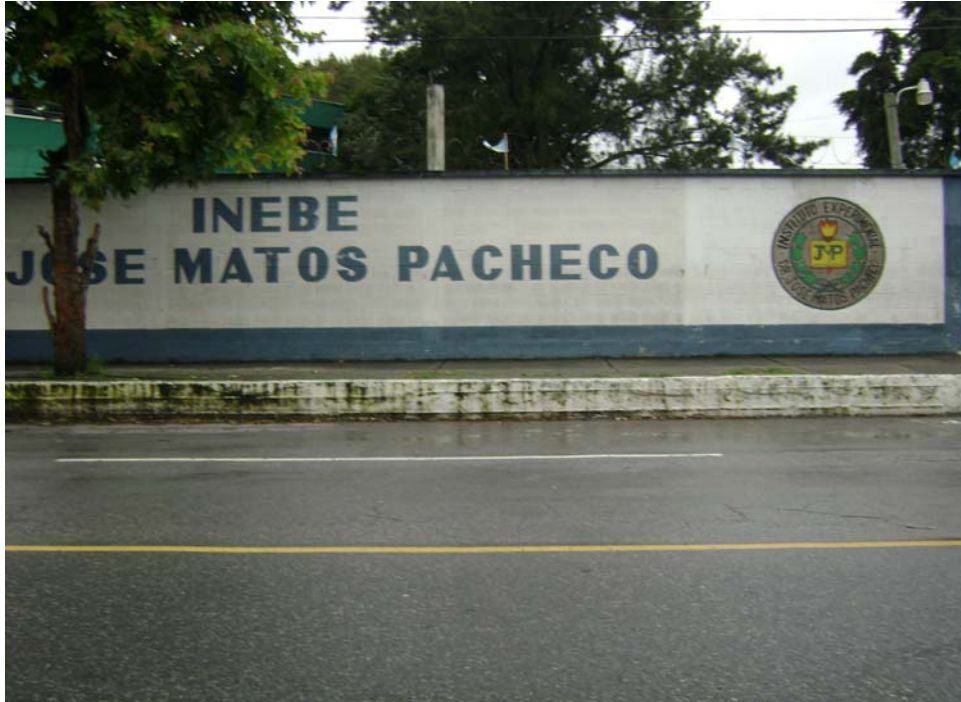
Fachada del instituto experimental “José Matos Pacheco” INEBE

edades de los alumnos del instituto, por ser alumnos de secundaria iniciando su período de la adolescencia, por demás atractivo a un proyecto. En este caso el instituto “José Matos Pacheco”, dio la oportunidad de realizar el estudio.