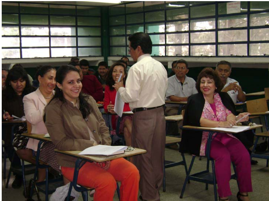
Inducción a maestros