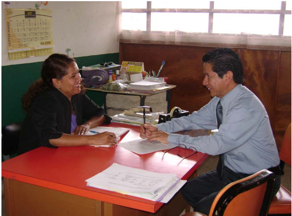
Con la sicóloga del instituto