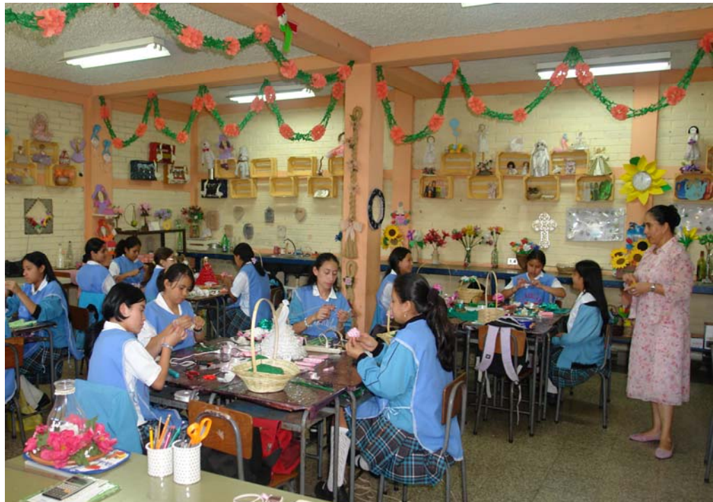
Taller con maestra implementado transversalmente el programa de valores