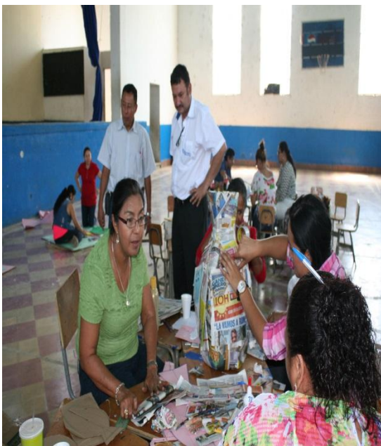
Se contó con la presencia del asesor.