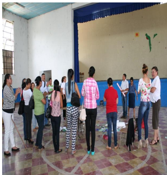
Clausura del evento.