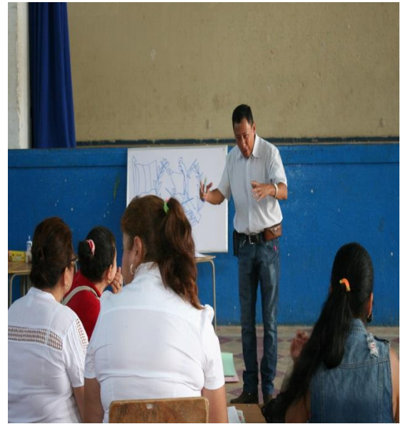
Explicación del material didáctico.