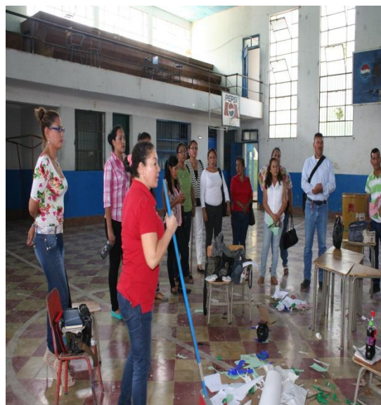
Limpieza del área utilizada.