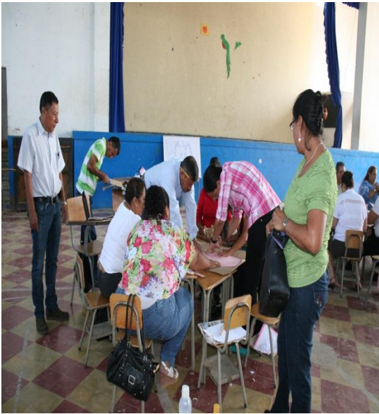
Coordinación del trabajo.