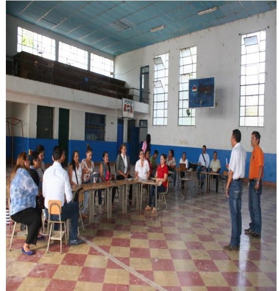
Explicación previa de la actividad.