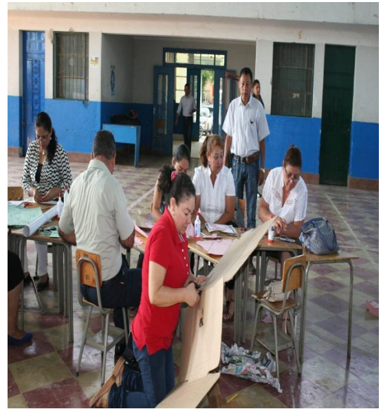
Recortando cartón reciclable.