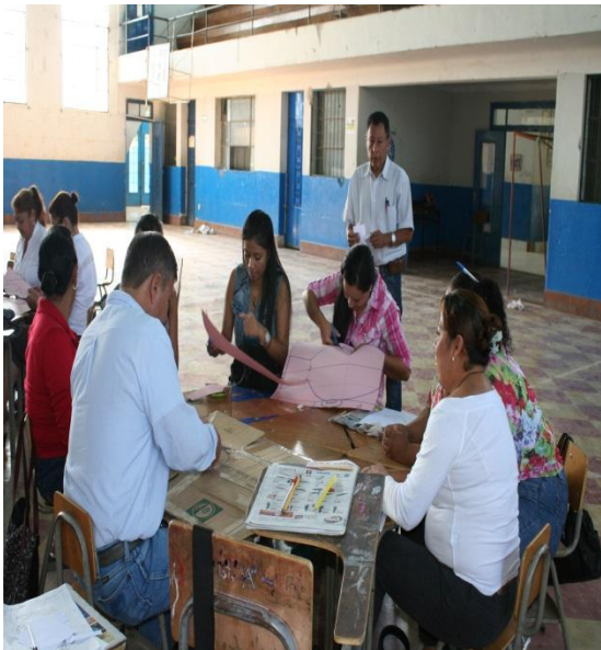
Trabajando con material de desecho.