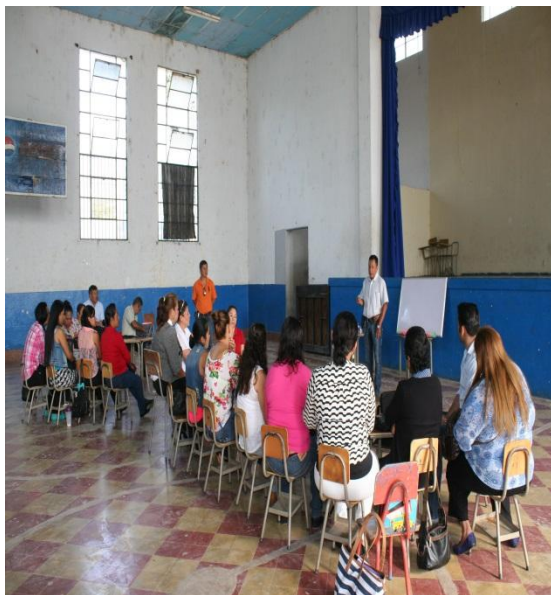
Elementos de dibujo.