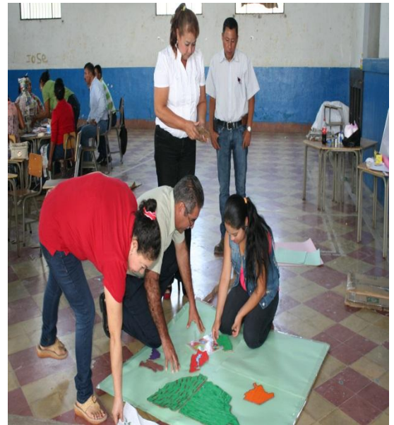
Forrando los cartones.