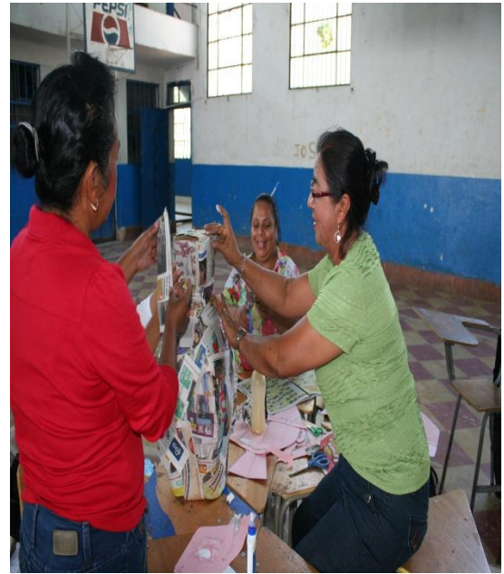
Dando forma al jarrón decorativo.