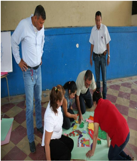
Recortando la figura de cada departamento.