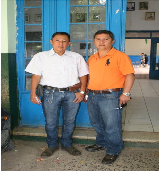
Reunidos con el Director del establecimiento.

MEDIOS DE VERIFICACION DEL TALLER DIDACTICO, REALIZADO EN LA ESCUELA OFICIAL TIPO FEDERACIÓN, “SALOMÓN CARRILLO RAMIREZ”, DE LA CIUDAD DE JUTIAPA. ACTIVIDAD LLEVADA A CABO EL DIA VIERNES 09 DE OCTUBRE DE 2015, EN EL SALON DE USOS MULTIPLES DE LA ESCUELA.