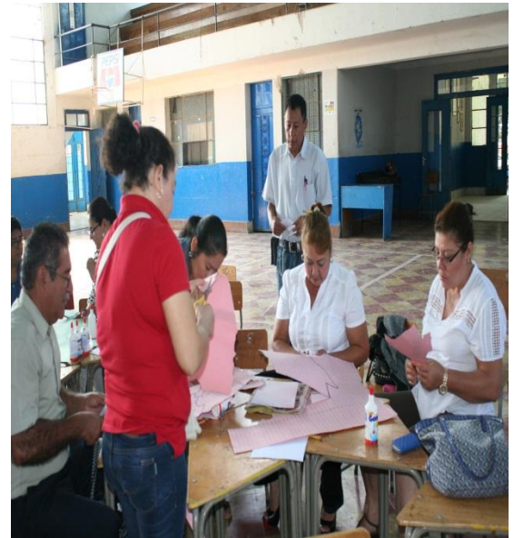
Trabajo en grupo.