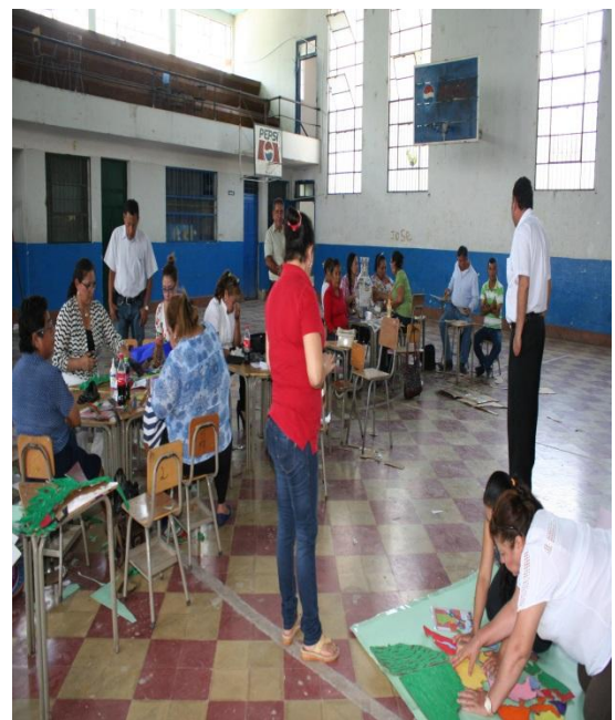
Supervisando el taller.