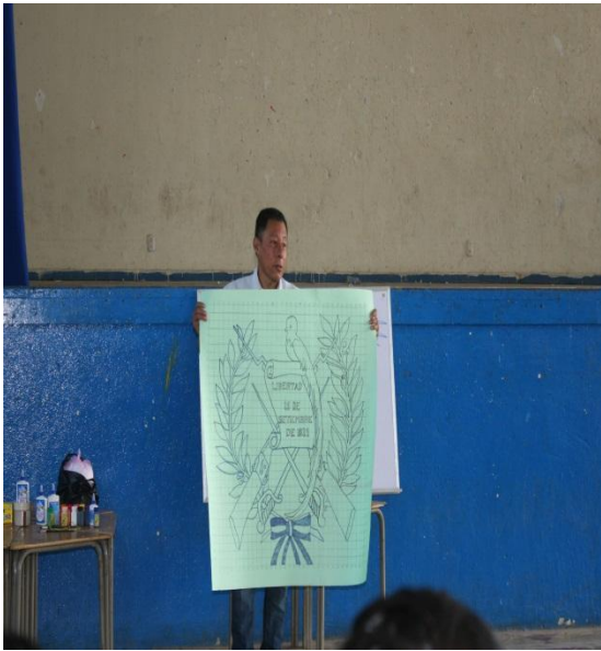
Elaboración del símbolo nacional.