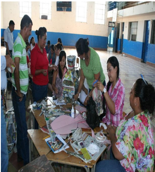
Organizando un mapa de Guatemala.