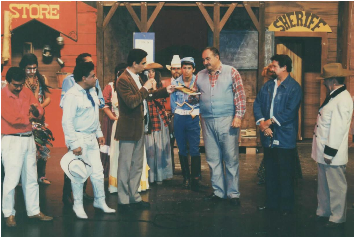
(Elenco de El Benemérito pueblo de Villa Buena, última participación del primer actor Rafael Pineda en 1993)