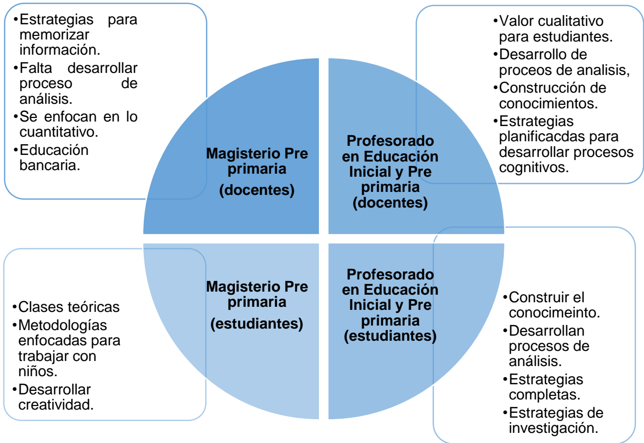
Figura No. 2 Diferencias entre las Estrategias utilizadas en el Profesorado en Educación Inicial y Pre primaria