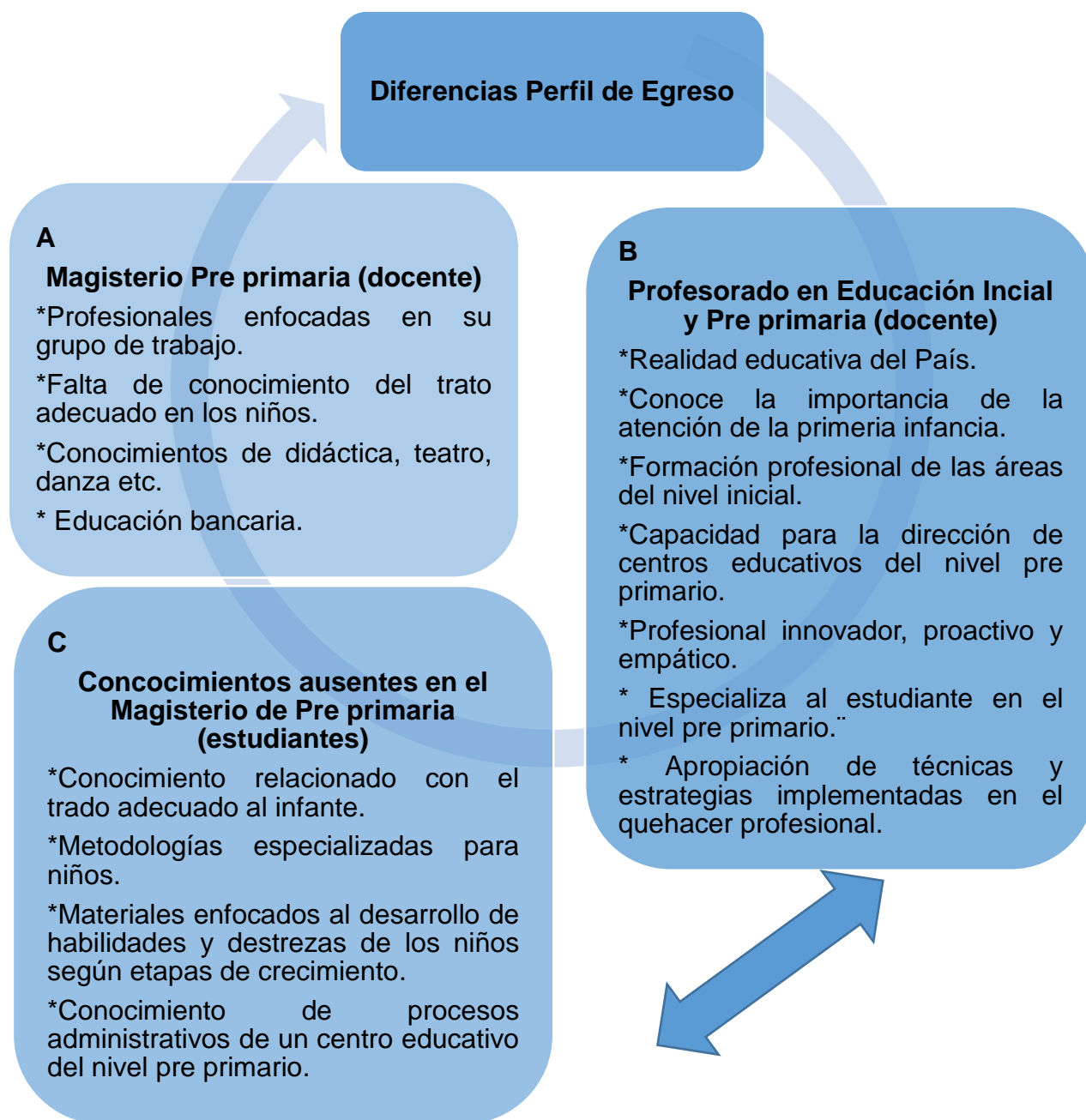
Figura No. 4 Perfil de Egreso del Profesorado en Educación Inicial y Pre primaria