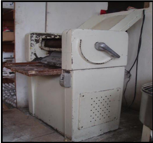
Figura 7. Cilindro Horizontal