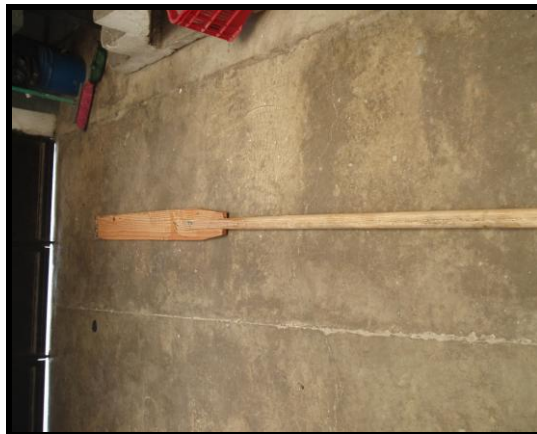
Figura 11. Pala de panadería

Los mangos de las palas suelen astillarse fácilmente, cuando esto suceda cambie el mango para evitar daños en las manos.