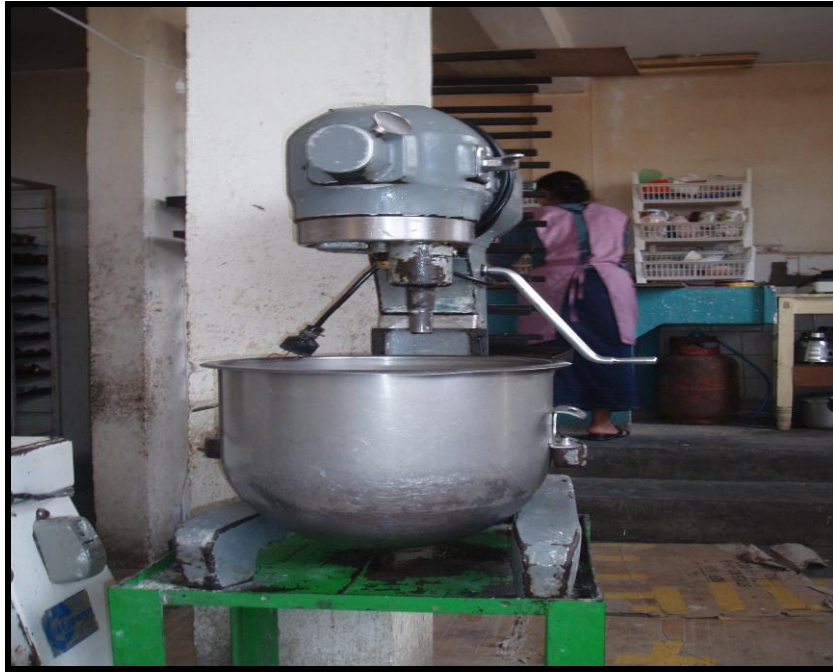
Figura 12. Batidora Hobart de panificadora Buena Vista