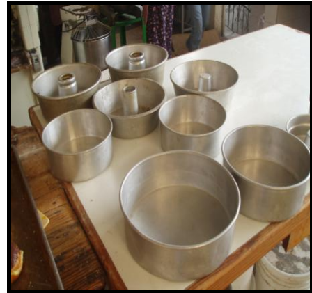
Figura 6. Moldes de repostería