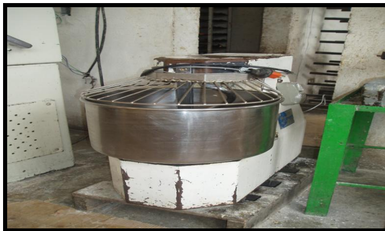
Figura 3. Amasadora

Este aparato debe emplearse exclusivamente para amasar o mezclar alimentos. No utilizar este aparato para mezclar alimentos congelados. No cargar en exceso el aparato superando los límites de capacidad de la cuba, es decir: 2,5 kg de harina más 1,5 litros de agua (4 kg de masa dura).