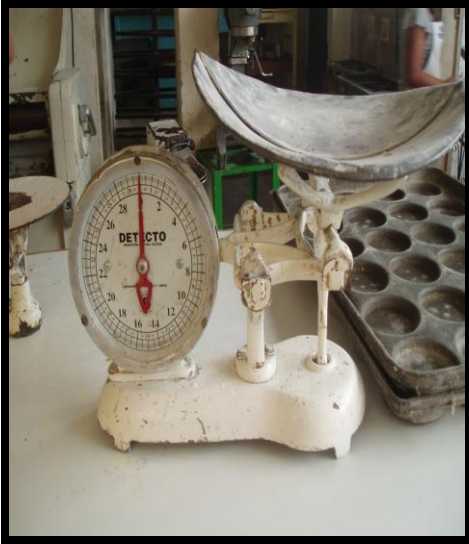
Figura 1. Balanza de libras-onzas

El intercambio comercial entre los países obliga a convertir libras a kilogramos y viceversa.