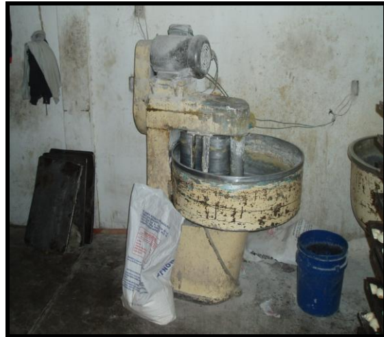
Figura 8. Cilindro vertical