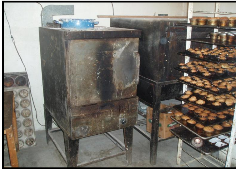
Figura 9. Horno de panadería

bien todos los tipos de pan económicamente, tanto en lo que se refiere a consumo de combustible como a los costos de operación.