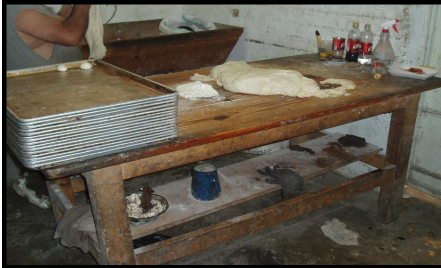
Figura 4. Mesa de trabajo