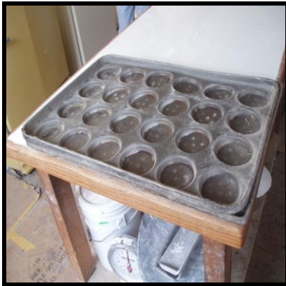
Figura 5. Latas de panadería