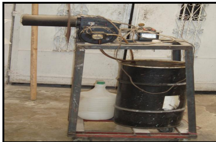
Figura 10. Quemador para horno de mampostería utilizado en panificadora Buena Vista

En la parte derecha inferior de la puerta (90 cm de altura del suelo), se instala un apoyo de ángulo metálico de 1" para apoyar las palas