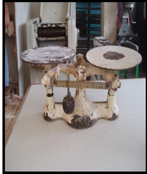
Figura 2. Balanza de onzas