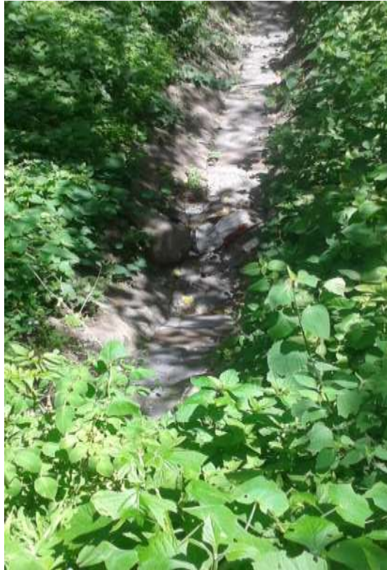
Figura 3. Canal de cuneta