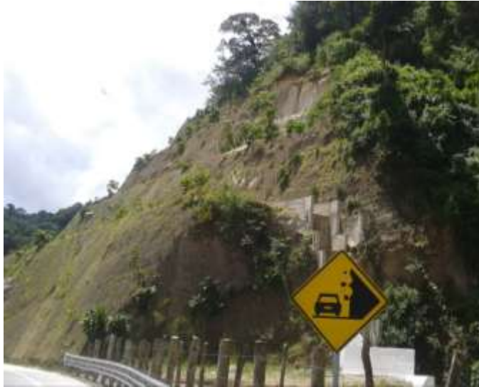
Figura 4. Taludes