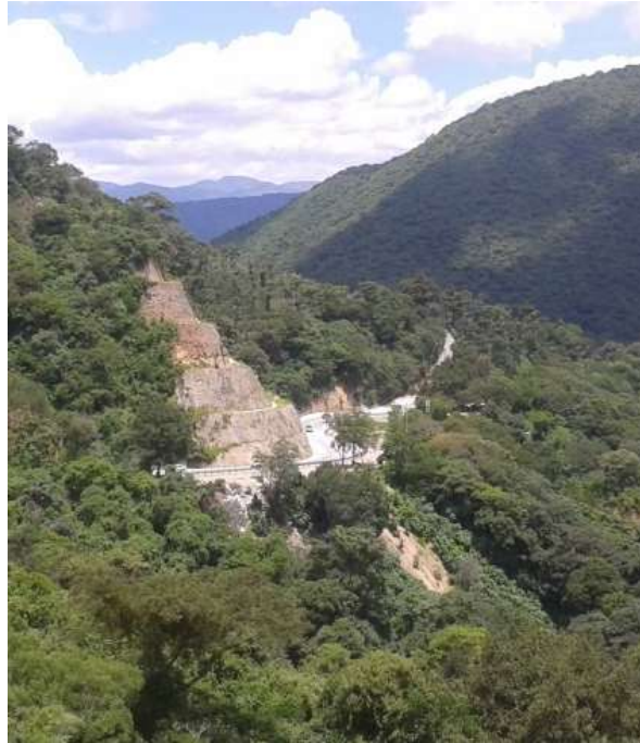
Figura 5. Punto de mayor vulnerabilidad