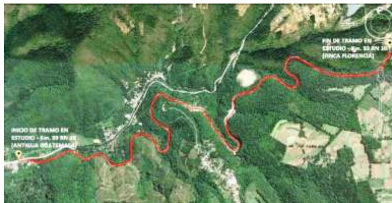
Figura 1. Tramo en estudio

Fuente: Google Earth. Consulta: 15 de diciembre de 2014.