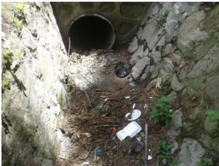
Figura 2. Entrada de cuneta