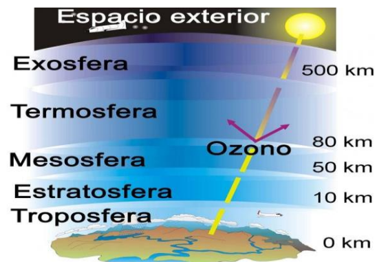
Figura 1. Capas de la atmósfera