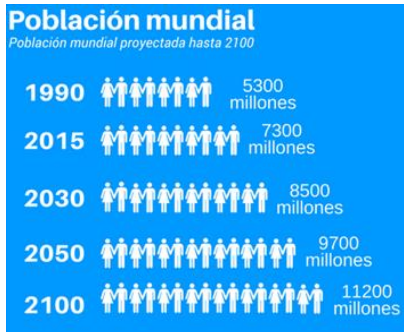
Figura 3. Proyección del crecimiento poblacional mundial