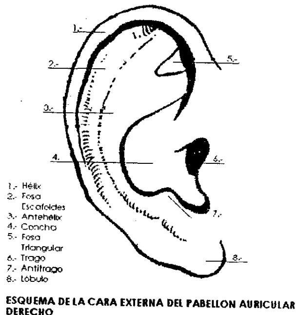
Fig. No. 2

El borde de la oreja se llama hélix. El lóbulo, que está desprovisto de cartilago, está formado por tejido fibroso y grasa. A veces se usa como fuente de sangre para la conducta de células sanguíneas.