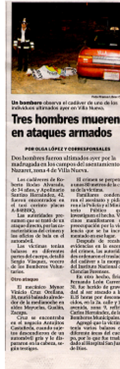
Imagen 3

En el cuerpo de la noticia presentada en nuestro diario se incluye un subtítulo “LOS REGISTRARON” que deja entre dicho que esto sucedió (que los occisos fueron registrados) posteriormente aclaran que esta es la hipótesis de la policía al parecer los hechores los bajaron del vehículo y luego de robarles “les dispararon hasta darles muerte” esta narrativa puede darse a muchas interpretaciones y es aquí donde entra en juego la subjetividad del individuo (lector), pues el que los bajaron del auto no es indicador de robo.