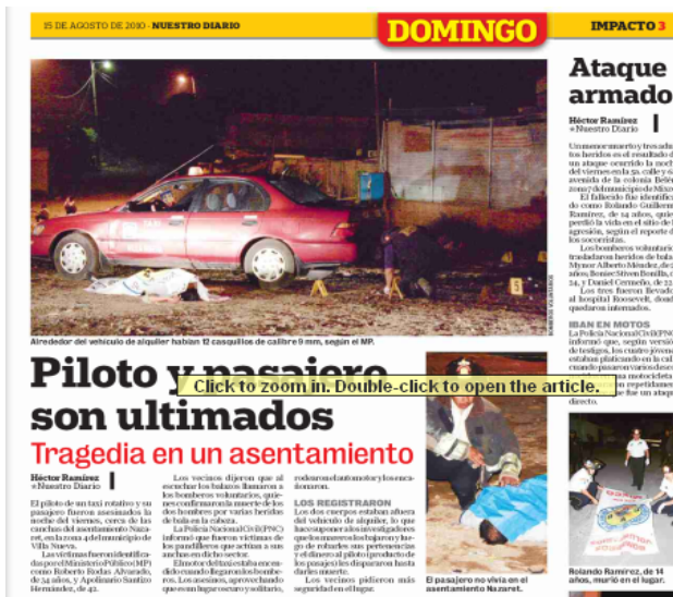
Imagen 2(Nuestro diario)

Ocupa aproximadamente la mitad de esta mostrando dos fotos de regular tamaño donde se enfoca al los cadáveres bastante cerca, en prensa libre se muestra en la página número 10 ocupando un tercio de la página total.