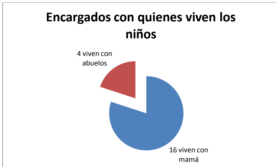
Gráfica No. 2

La totalidad de niños presentan creencias religiosas, siguiendo la fe que profesan las respectivas familias. Así mismo todos presentan la carencia de la figura paterna dentro de su estructura familiar, viviendo con la mamá o bien con los abuelos o tíos quienes cumplen como figuras encargadas de los niños, según se explica en la siguiente gráfica.