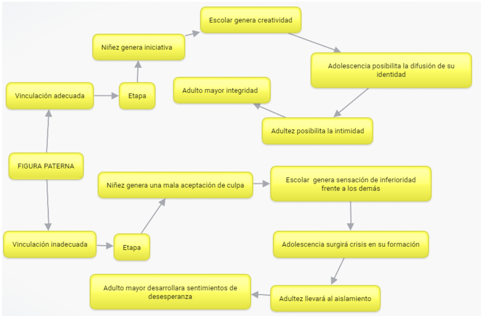
Cuadro 1 aspectos de la vinculación con la figura paterna en el niño por etapas de vida