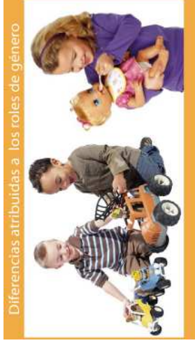
Diferencias atribuidas a los roles de género.

Dicha autora nos indica que el "género" utiliza de plataforma la diferenciación sexual, para construir socialmente lo que se entiende que un hombre o una mujer "deberían" pensar, actuar o ser según lo aceptable y esperado, para clasificarlos dentro de lo que se considera femenino o masculino dentro de una cultura y tiempo determinado. Son aprendidos desde la infancia.