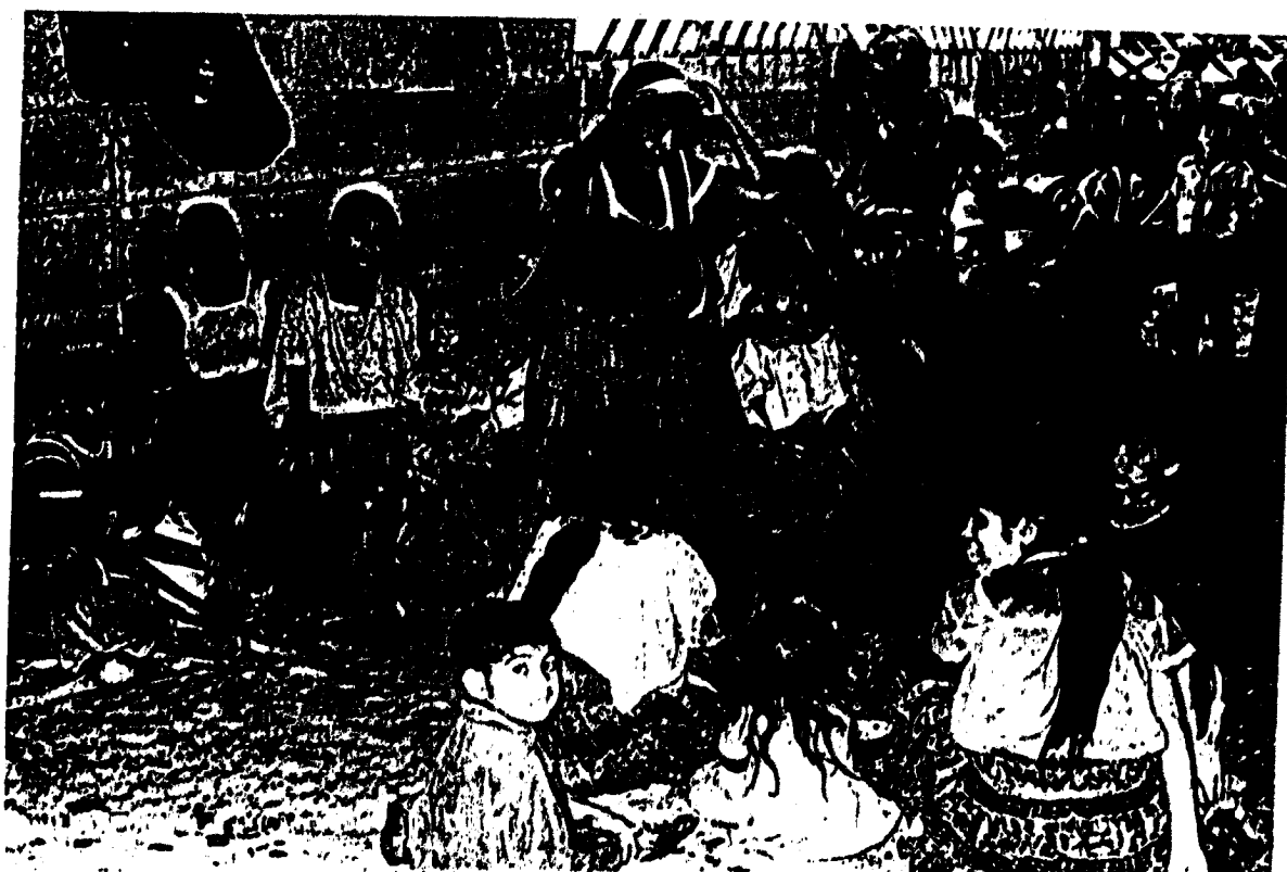
Foto 2. Grupo de indígenas desplazados de Cobán.