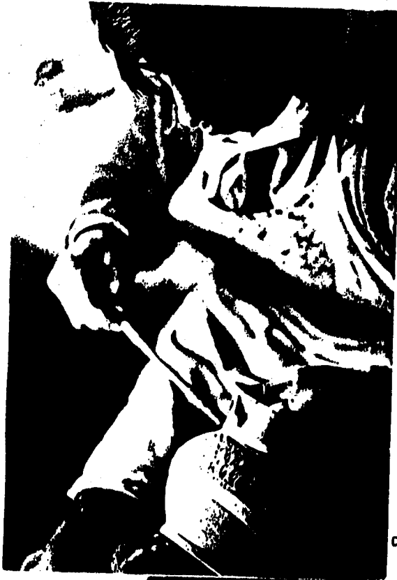
Foto 7. Artesano de vidrio decorando el "Totanic" sin decoración.