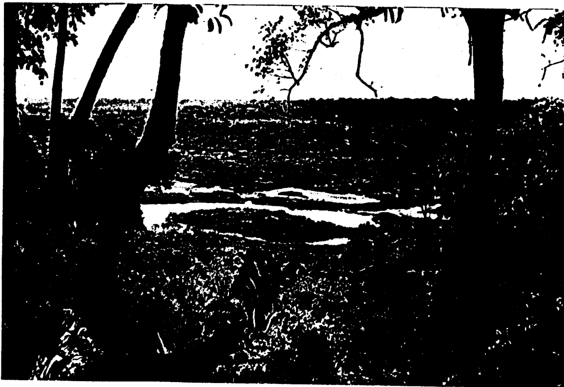
Foto 1. Vista del arroyo Aguateca. Petén.