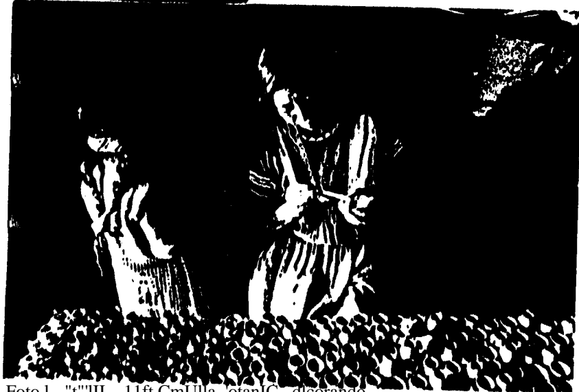
Foto 1. - "III .. 11ft CmUlla, 'otanIC_ decorando 'ft,atur... .. C".iCl ,tntUl.