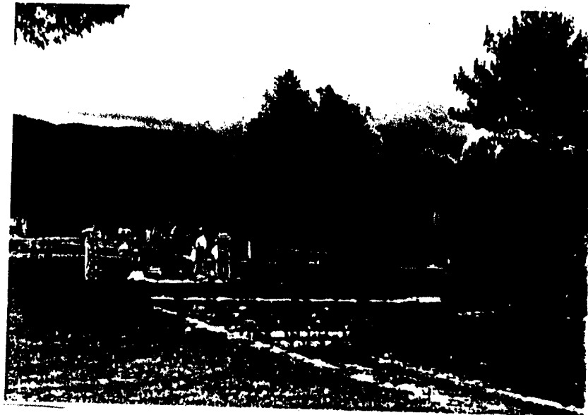
Foto 10. Sitio Arqueológico de IXIMché en Chimaltenango.