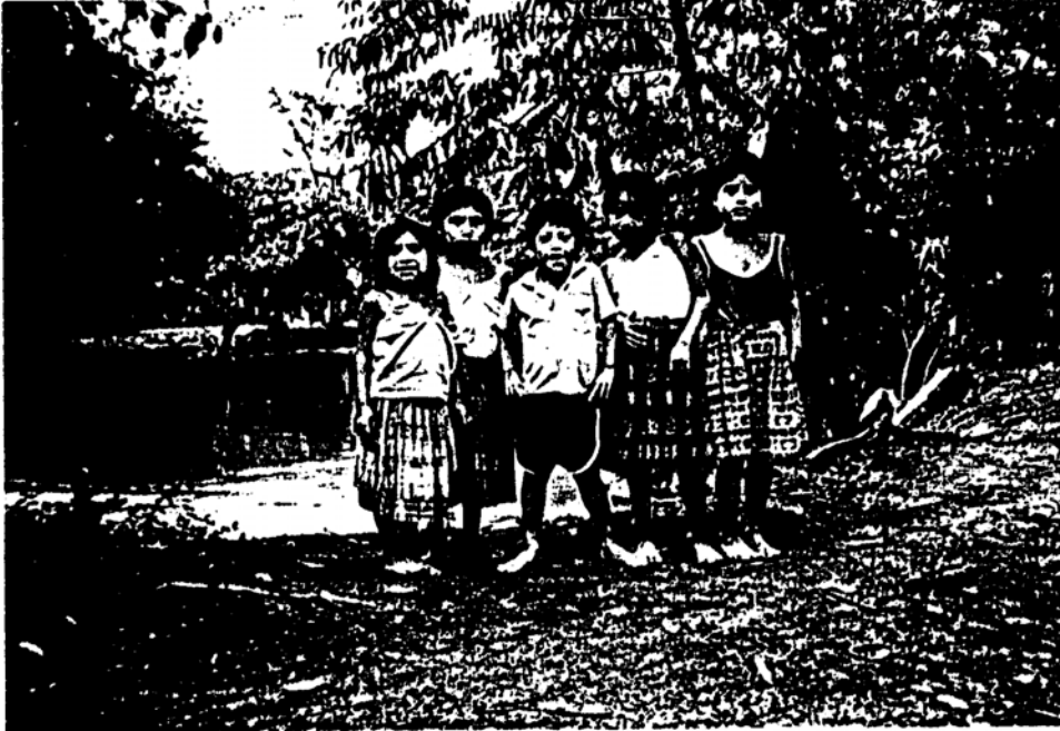
Foto 3. Niños K'ekchi's, en un caserío del Río Zarquito, Izabal.