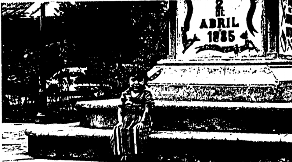
Foto 4. Niña de San Antonio Aguascalientes en el Parque Central de Antigua Guatemala.

“El hombre tiene el derecho fundamental a la libertad, la igualdad y el disfrute de las condiciones de vida adecuadas en un medio de calidad tal que le permita llevar una vida digna y gozar de bienestar, y tiene la solemne obligación de proteger y mejorar el medio para las generaciones presentes y futuras”. (Conferencia de las Naciones Unidas sobre el Medio Ambiente)