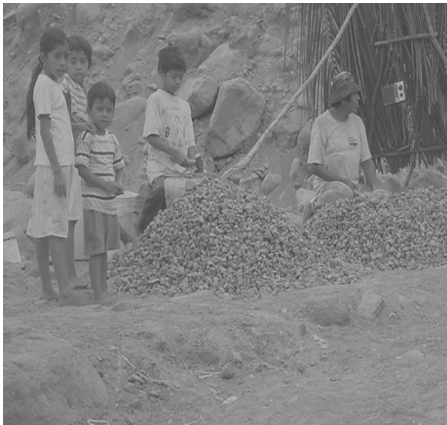
Foto No. 2 Trabajadores de la piedra en la playa del Río Samalá

El Departamento de Protección al Menor Trabajador del Ministerio de Trabajo y Previsión Social, tiene como misión analizar las diversas situaciones en las que se encuentran los menores en todas las formas de trabajo infantil y del alto riesgo que corren al hacer cualquier trabajo forzado a muy temprana edad.