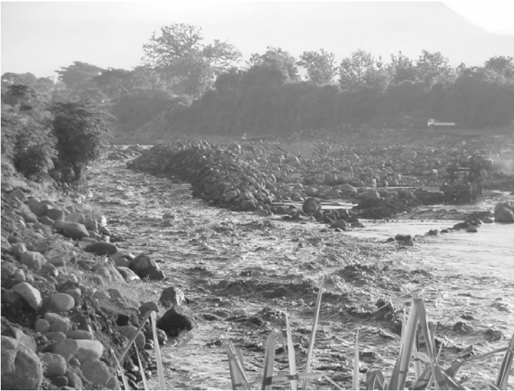
Foto No.1 Extracción del material del Río Samalá

Las materias primas que proporciona la naturaleza contribuye a la sobrevivencia de los trabajadores de la piedra. Anteriormente ellos toman de ella lo esencial, lo que el río les proporciona (piedra volcánica), que transformaban en producto directo para la comercialización, no pagaban arrendamiento por