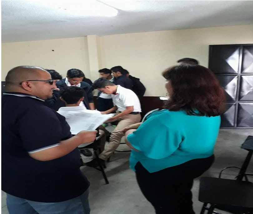
Fotografía No 4. Realizando proceso de acompañamiento en un establecimiento educativo donde se realizó el Pilotaje.