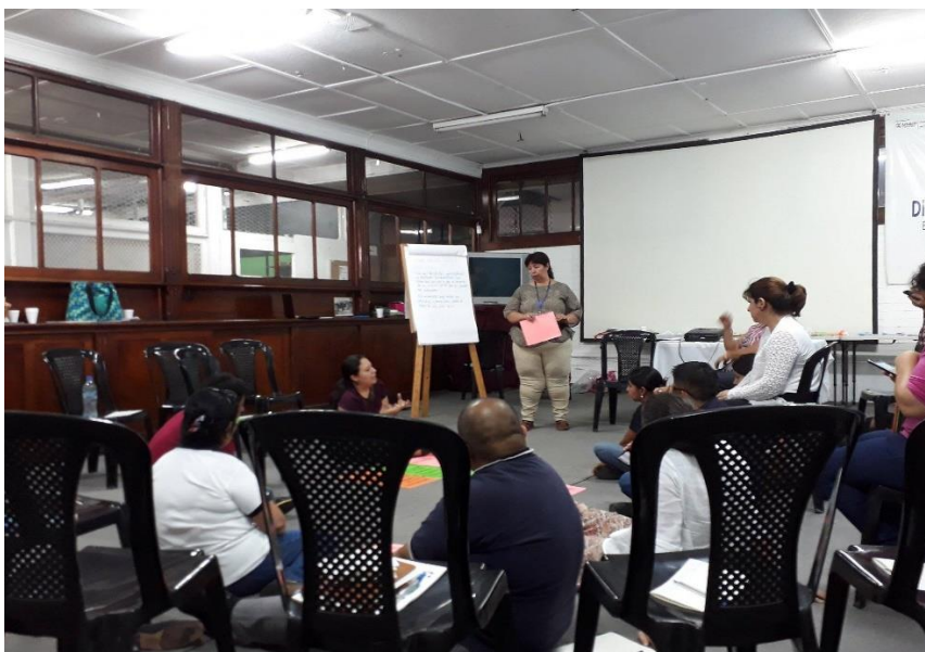
Fotografía No. 2 en talleres de Formación Ciudadana con los docentes.