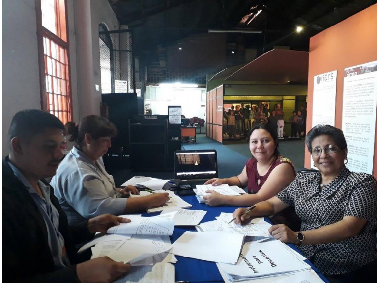
Fotografía No. 5 Preparando los talleres para docentes