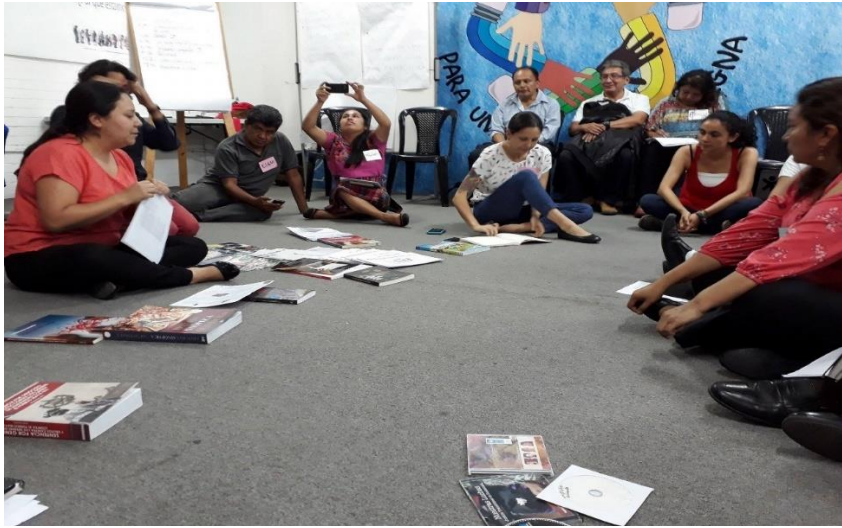
Fotografía No. 1 Preparando los talleres para docentes