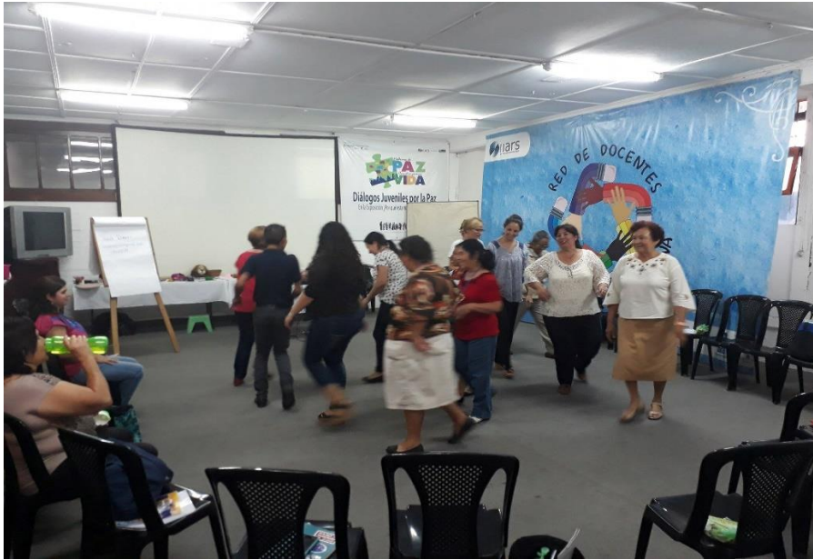
Fotografía No. 3 en talleres de Formación Ciudadana con los docentes, sede Guatemala IIARS.