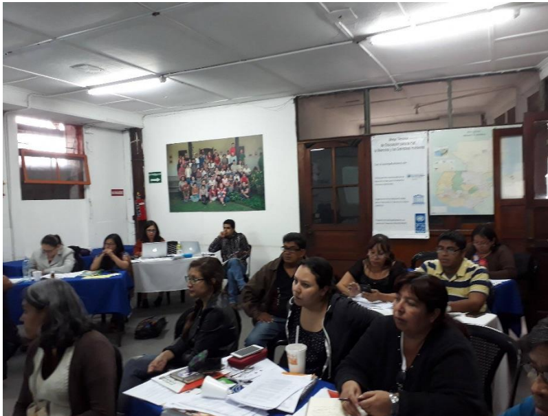
Fotografía No. 6 Trabajando en la Propuesta de la Nueva Guía de Formación Ciudadana para tercero básico.