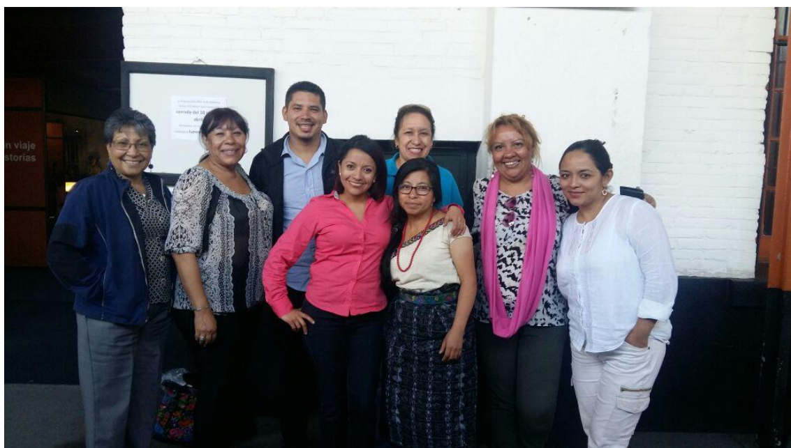
Anexo 4: Parte del equipo de facilitadores de la Escuela de Historia