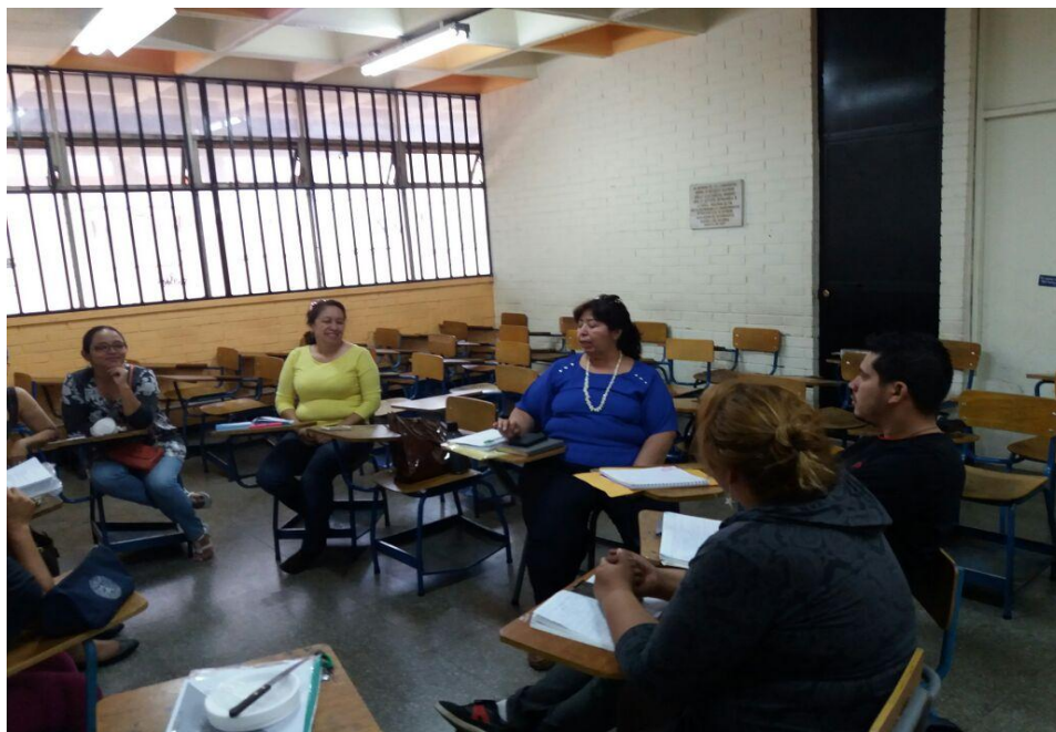
Anexo 3: Reunión de facilitadores con asesoras en Escuela de Historia