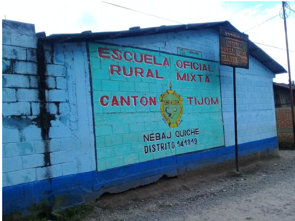
Anexo 16: Escuela donde se llevó uno de los procesos de acompañamiento en Nebaj, Quiché.