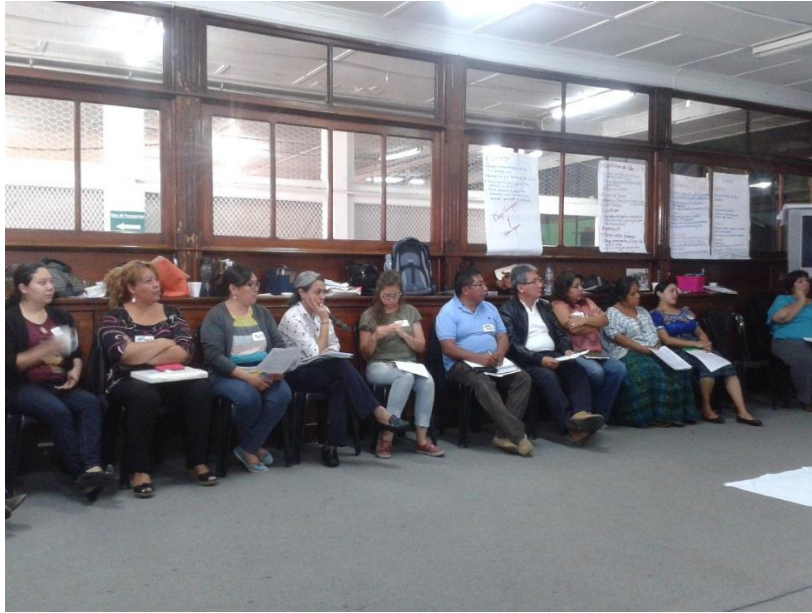
Anexo 6: Presenciando el modelaje de un taller