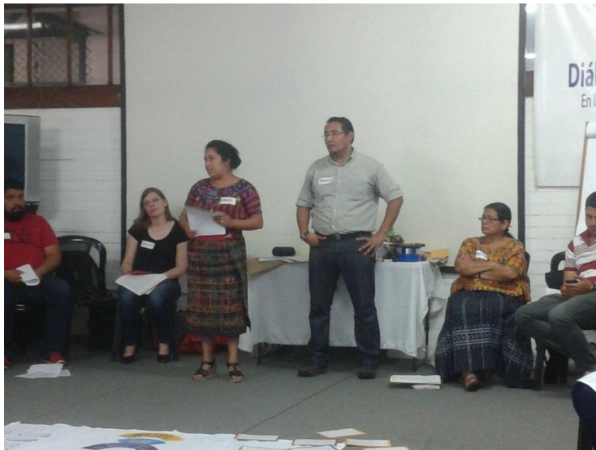
Anexo 7: Compañeros facilitadores colaborando en una actividad