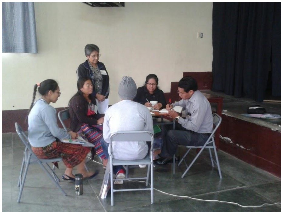
Anexo 19: Conversando con docentes participantes en Santa Cruz, Quiché