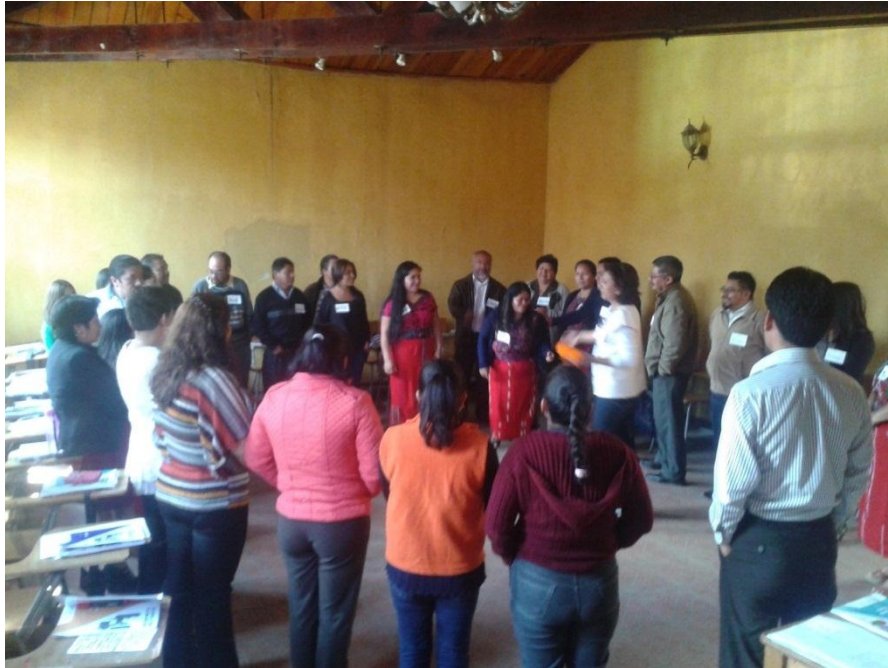
Anexo 8: Tercer taller en Nebaj, Quiché