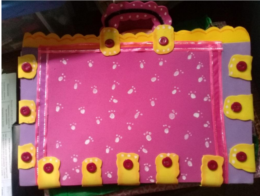
Anexo 14 Portafolios de los docentes de Nebaj, Quiché