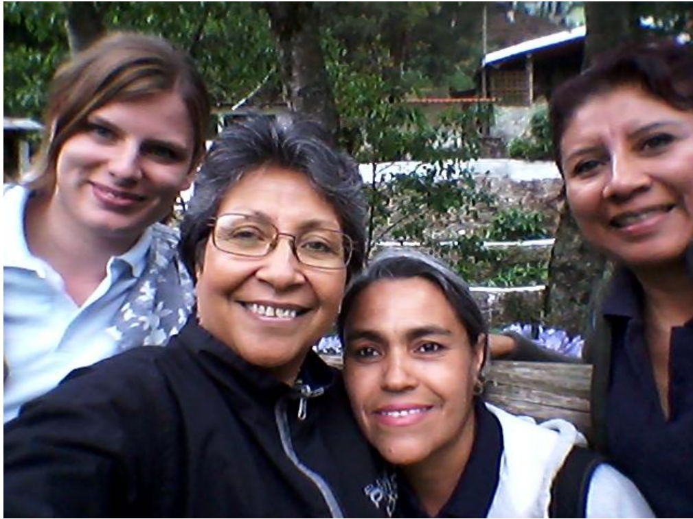
Anexo 10 Grupo facilitador en taller No. 4 en Santa Cruz, Quiché