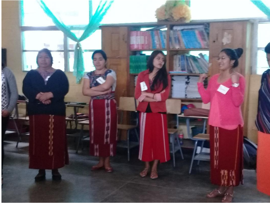
Anexo 12: Taller No. 5 en Nebaj, Quiché