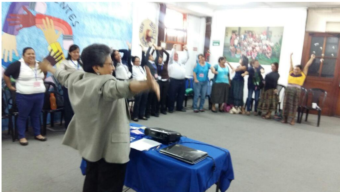
Anexo 2: Dirigiendo una actividad en el segundo taller en IIARS