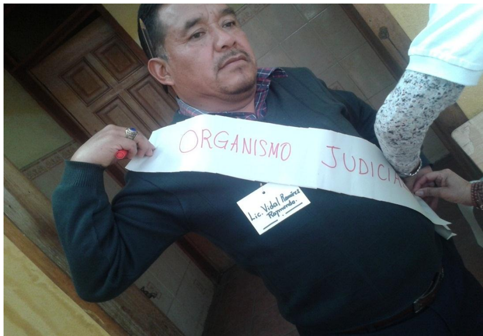
Anexo 9: Colaborando con un docente participante a ser parte de una actividad