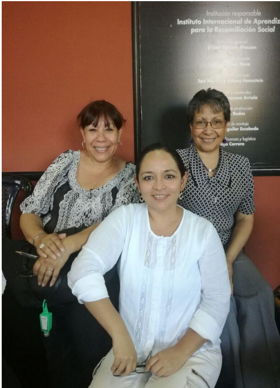
Anexo 5: Recibiendo capacitación en IIARS