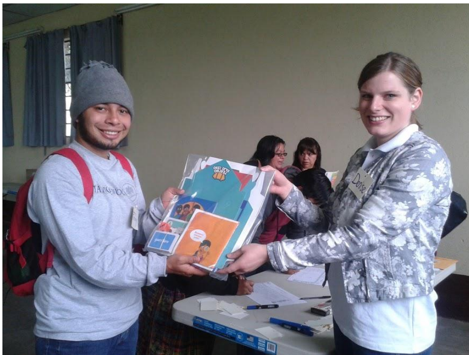
Anexo 15: Entrega de material didáctico en Nebaj, Quiché