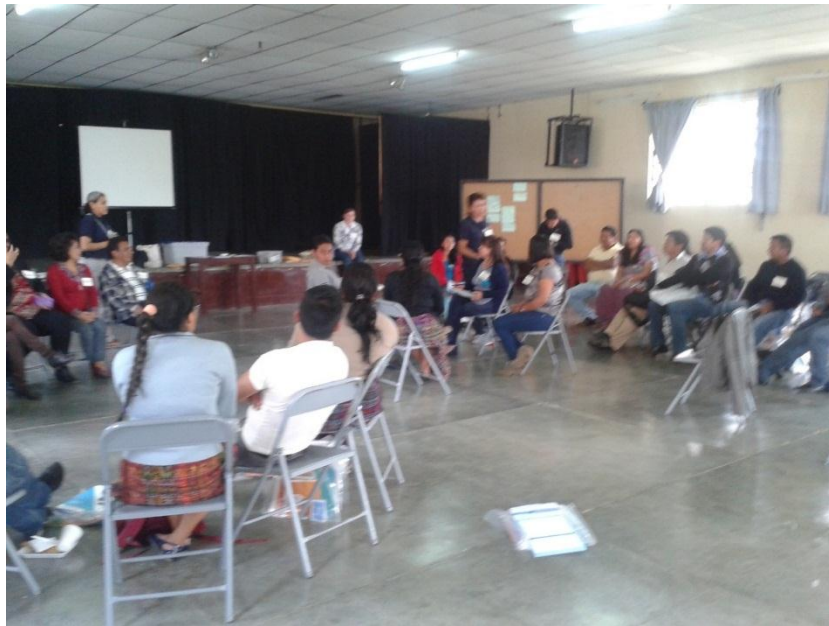
Anexo 11: Impartiendo el taller 4 en Santa Cruz, Quiché