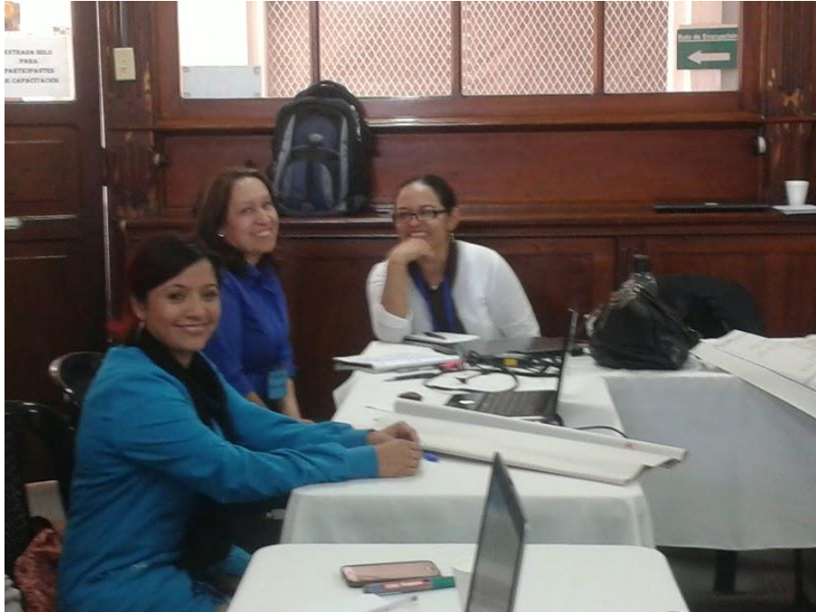
Anexo 20: Capacitación de tutoría virtual