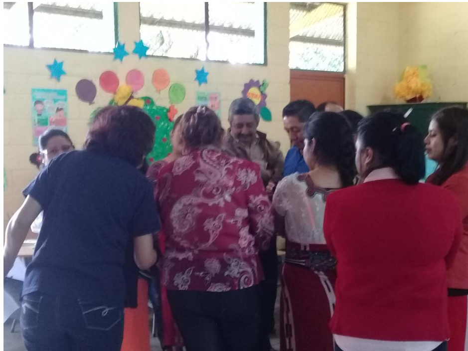
Anexo 13: Llevando a cabo una actividad en el taller No. 5