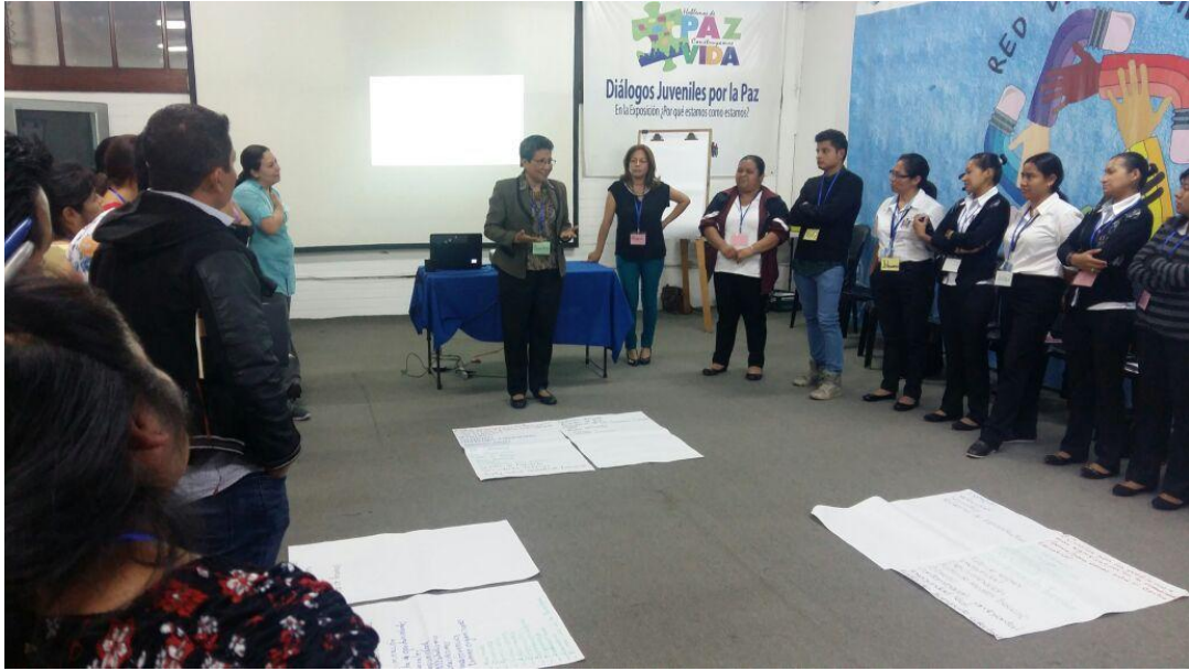
Anexo 1: Impartiendo el primer taller en IIARS