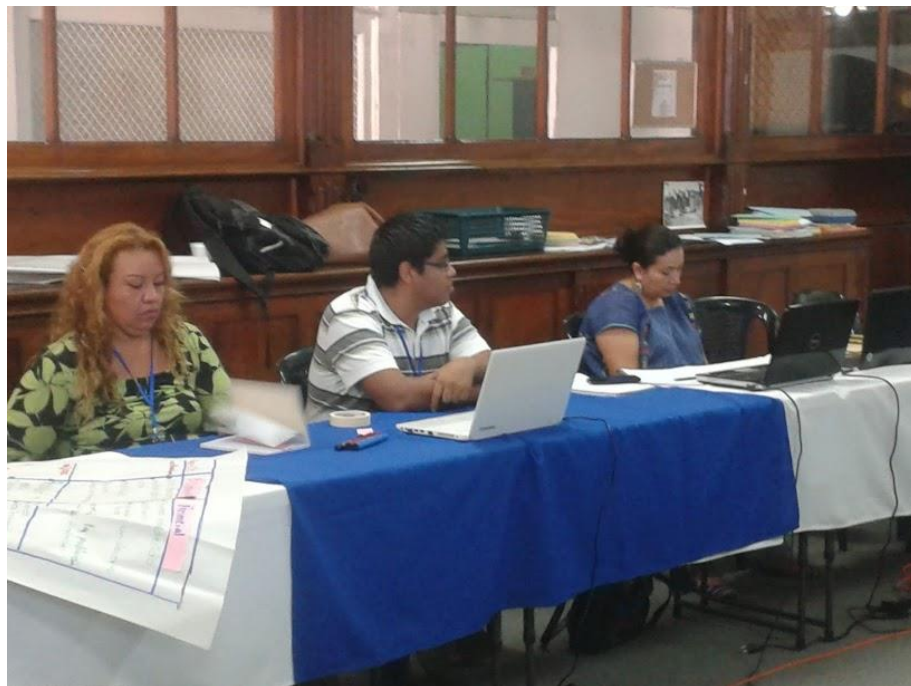
Anexo 21: Recibiendo instrucciones para la tutoría virtual en IIARS