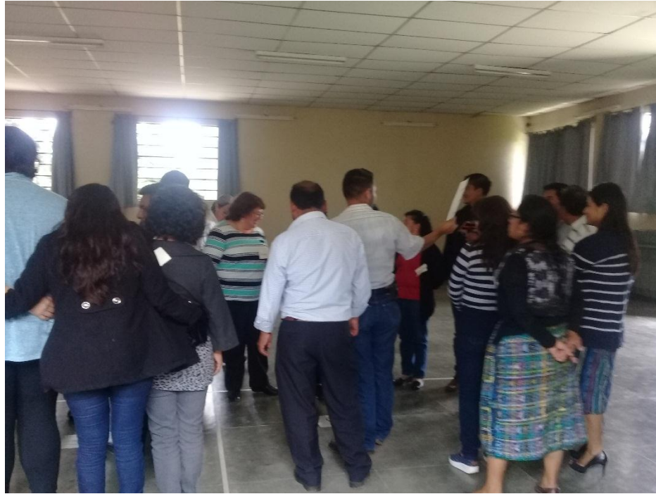
Anexo 18: Taller No. 6 en Santa Cruz, Quiché.